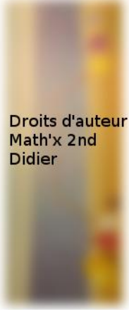
Droits d'auteur Math'x 2nd Didier

Problème 3 : A 50 mètres, face aux poteaux !