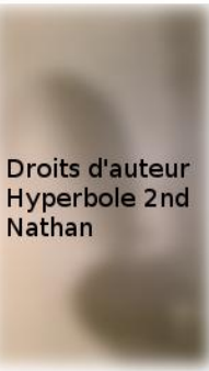
Droits d'auteur Hyperbole 2nd Nathan

Problème 1 : Le hangar à dirigeables d'Ecausseville (Manche) est le dernier de France. La façade de ce hangar peut être modélisée par une portion de parabole représentant la fonction f , tel quel, f(x) = -0,075x^2 + 30 dans un repère orthonormé (unité : 1m).