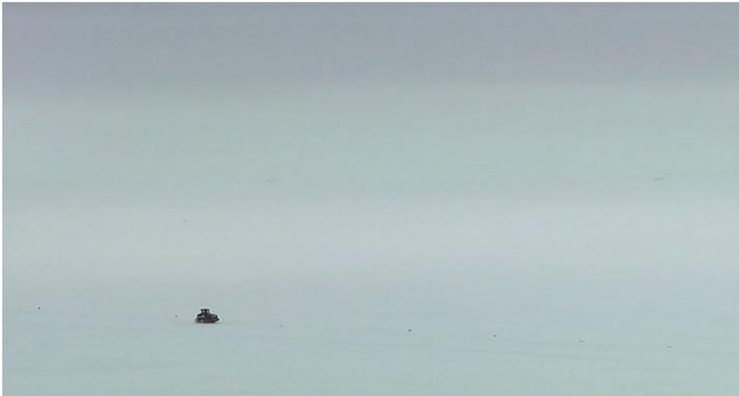
Un tracteur sur la banquise antarctique dans Rencontres au bout du Monde .

Dans Rencontres au bout du Monde , aux confins de l'Antarctique, Herzog continue ce jeu des proportions en filmant le passage de l'homme qui cherche à conquérir toutes portions de nature mais qui demeure infime face à l'immensité de ce désert blanc glacé.