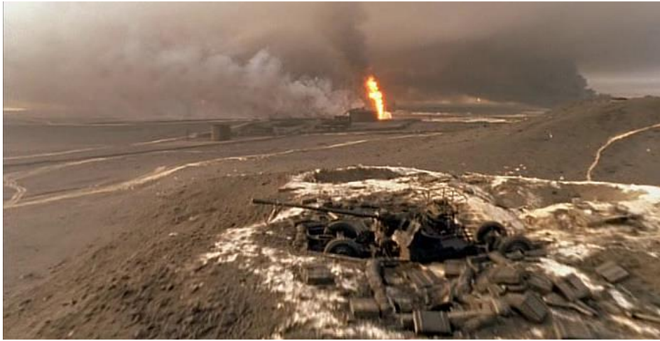
Leçons des Ténèbres.