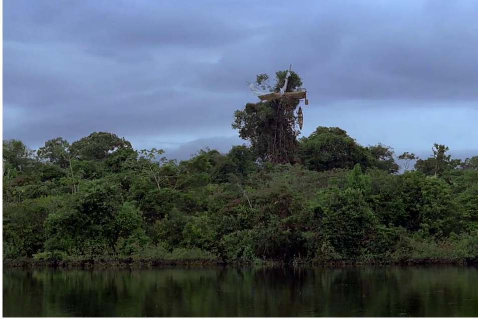
Point de vue irréal, des personnages du radeau : un bateau dans un arbre.