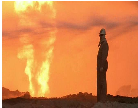
Les hommes devenus créatures.

Dans La Soufrière , le silence inquiétant des rues désertées, l'attente d'une éruption sont mis en exergue par la voix-off de Herzog, qui tel un conteur renforce cette inquiétude « C'était inquiétant comme un film de science-fiction. » Dès lors, il génère une forme de suspens, de peur intrigante et immersive. Lors d'une séquence de Rencontres au bout du Monde , on voit les plongeurs dans les fonds marins, en contact de créatures inhabituelles, presque inquiétantes si bien qu'on pourrait les penser conçues pour le film. Elles sont pourtant bien réelles.