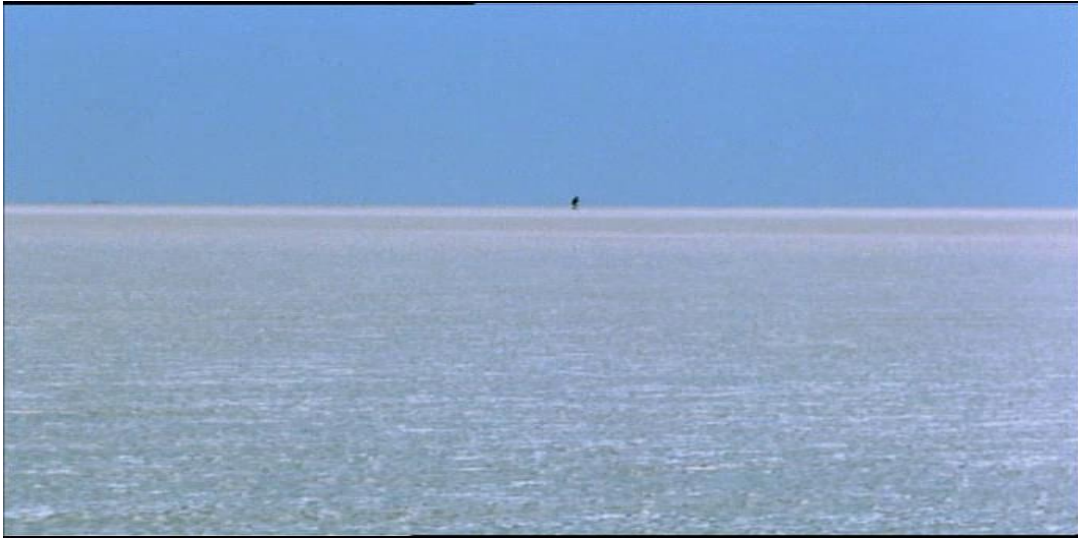
Un être humain, au loin dans le désert de Fata Morgana

On pourrait multiplier les exemples qui figurent ces différences de proportions et qui marquent visuellement cette distance de l'homme à la nature, cette insignifiance mais aussi cette admiration et ce respect que lui voue Herzog.