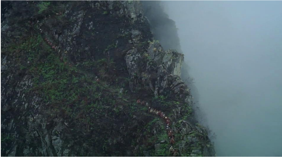
Cortège de l'expédition dévalant la montagne au début de Aguirre, la colère de Dieu .

Dans Rencontres au bout du Monde , aux confins de l'Antarctique, Herzog continue ce jeu des proportions en filmant le passage de l'homme qui cherche à conquérir toutes portions de nature mais qui demeure infime face à l'immensité de ce désert blanc glacé.