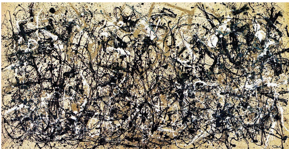
Jackson Pollock, Forêt enchantée (1947). Huile sur toile (221,3 x 114,6 cm) Venise (Italie), fondation Peggy Guggenheim.

Les avancées technologiques telle que la photographie viennent aussi bouleverser la représentation artistique du paysage, qui tend de plus en plus à s'émanciper des représentations académiques et naturalistes pour se rapprocher des mouvements de l'âme, comme l'attestent les perceptions paysagères impressionnistes, qui cherchent de nouveaux points de vue, plus intimes. Ainsi, le paysage devient subjectivité, sensibilité. Un même paysage, une même portion de nature, peut recouvrir une multitude de représentations, dès lors qu'il passe par la double médiation d'un individu et d'un médium (avec ses caractéristiques, ses matériaux, son langage singulier), accaparé par une sensibilité. Il est intéressant de constater la manière dont la peinture abstraite s'est également éprise de paysages. Le tableau de Jackson Pollock Forêt enchantée témoigne cette volonté d'émancipation de toute représentation codifiée ou référentielle de la nature.