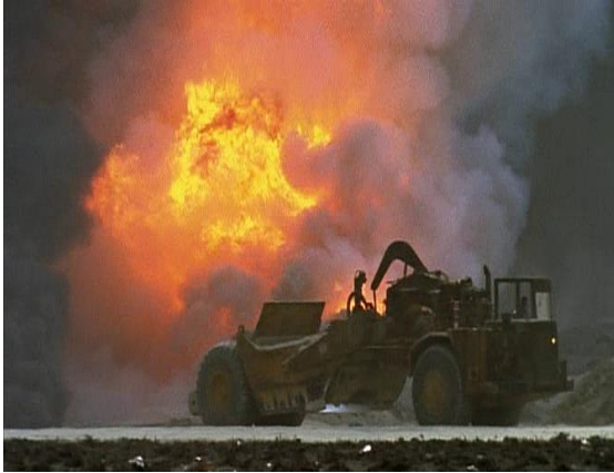
Les engins devenus dinosaures.