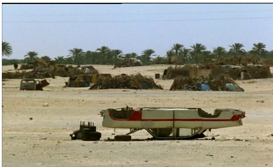
Carcasse de voiture retournée en plein désert dans Fata Morgana.

réalité. Les commentaires nous bercent et nous emportent dans une autre dimension spatio-temporelle renvoyant à notre propre conscience. Selon Eric Ames, le film repose sur cette ambivalence d'un monde intérieur suscité par la réalité même : « Fata Morgana initiates a process of mythologizing the landscape as an internal space, which is also a documentary representation of the material world. 21 » C'est par le recourt à la narration, aussi vaporeuse semble-t-elle, que Herzog parvient à un tel résultat. Tel est son procédé : raconter sans jamais imposer, invitant ainsi le spectateur à créer les histoires. Ainsi, en face de ces étendues désertiques, parsemées de débris et de traces industrielles, on ne peut que s'interroger sur la provenance et la direction de ces objets.