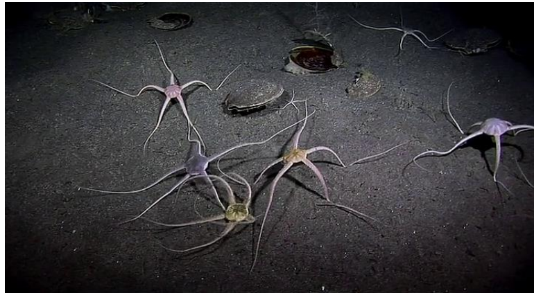
Créatures sous-marines dans Rencontres au bout du monde .

Dans La Soufrière , le silence inquiétant des rues désertées, l'attente d'une éruption sont mis en exergue par la voix-off de Herzog, qui tel un conteur renforce cette inquiétude « C'était inquiétant comme un film de science-fiction. » Dès lors, il génère une forme de suspens, de peur intrigante et immersive. Lors d'une séquence de Rencontres au bout du Monde , on voit les plongeurs dans les fonds marins, en contact de créatures inhabituelles, presque inquiétantes si bien qu'on pourrait les penser conçues pour le film. Elles sont pourtant bien réelles.