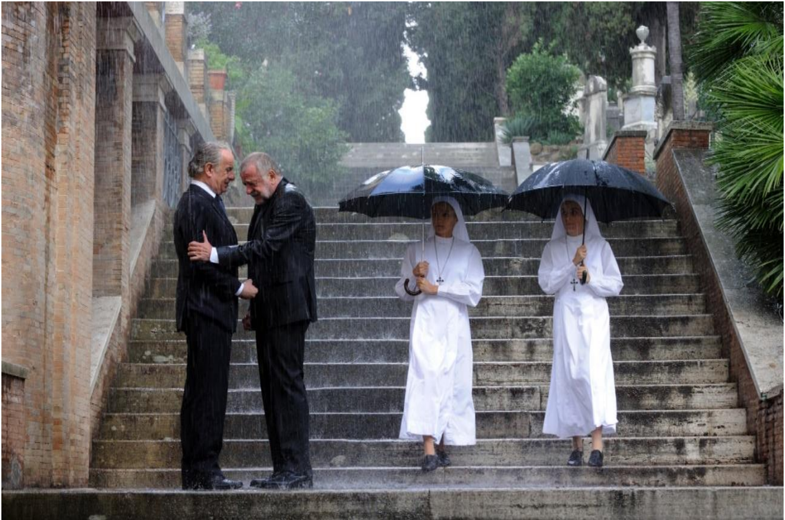
Fig.8 Sorrentino Paolo. La grande Bellezza . Roma : 2013. Photogramme