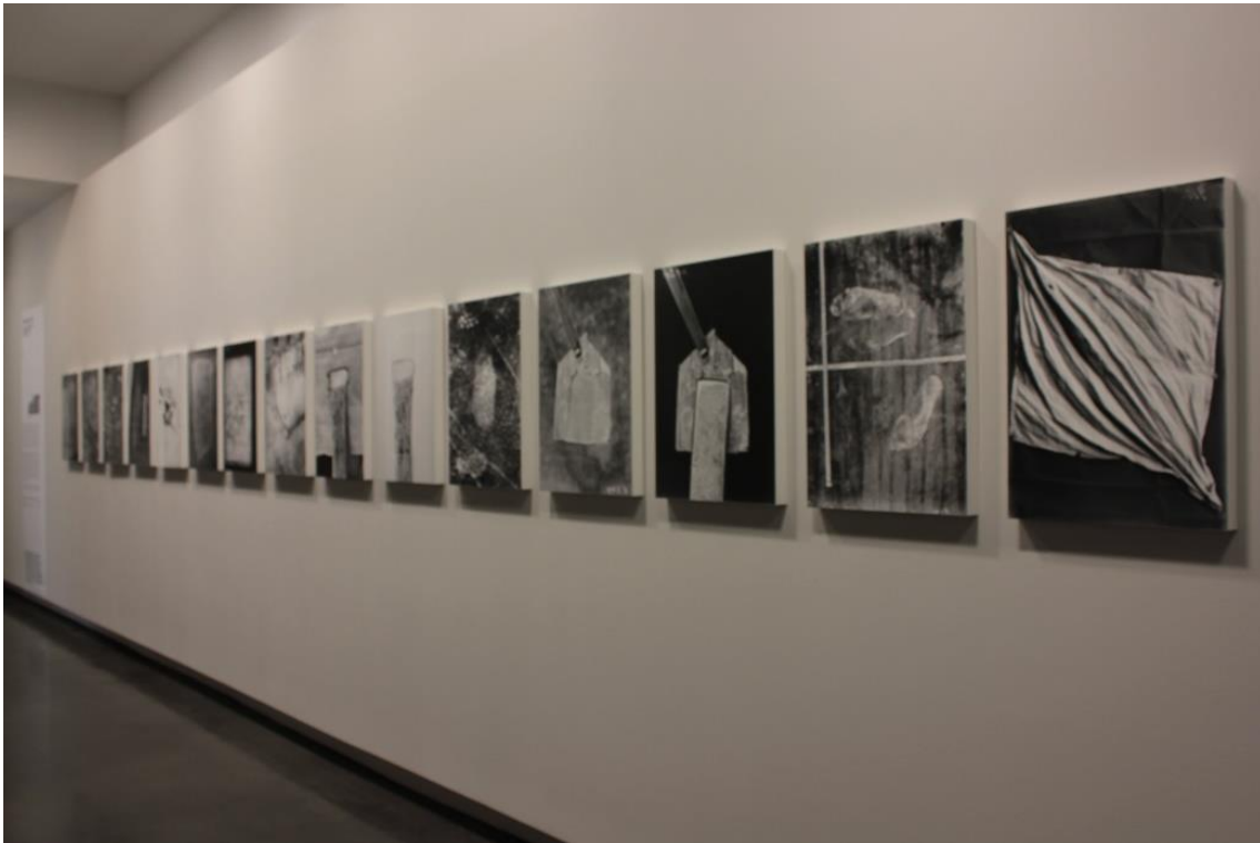
Fig.2. Photographie prise au Bal pendant l'exposition Images à charge. La construction de la preuve par l'image .

Des images qui avaient été déplacées de leur cadre de perception habituel pour être interrogées sur leur statut, et pour devenir le parfait exemple de la divergence des intentionnalités. « Nous avons tenté de comprendre comment, quand et par qui elles ont été produites, et de proposer une perspective critique sur leur statut- ni documents purs, ni images symboliques, ni preuves en soi 14 » -explique Diane Dufour. Si l'on ne peut considérer ces images ni comme documents purs, ni comme images symboliques, ni comme preuves en soi, c'est parce que, inévitablement, même si elles ont été conçues dans de domaines non-artistiques, elles dégagent, par leur valeur esthétique et surtout par leur valeur expressive, une certaine aura d'œuvre d'Art.