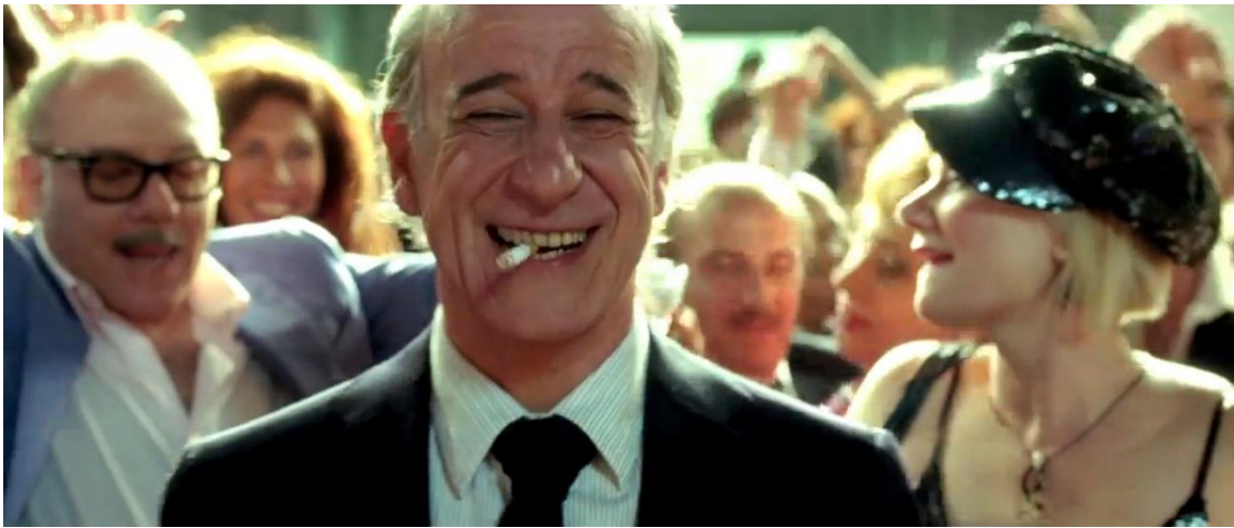
Fig.9 Sorrentino Paolo. La grande Bellezza . Roma : 2013. Photogramme