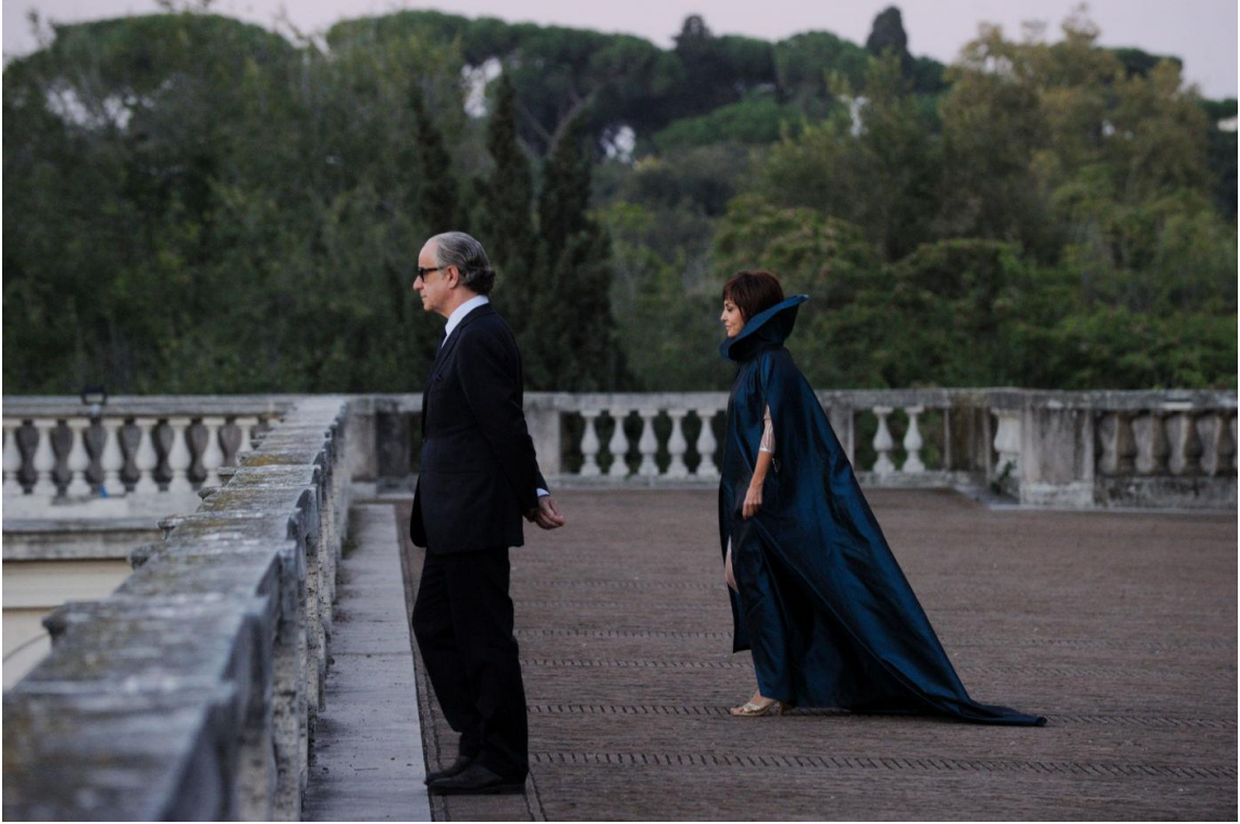
Fig.7 Sorrentino Paolo. La grande Bellezza . Roma : 2013. Photogramme.