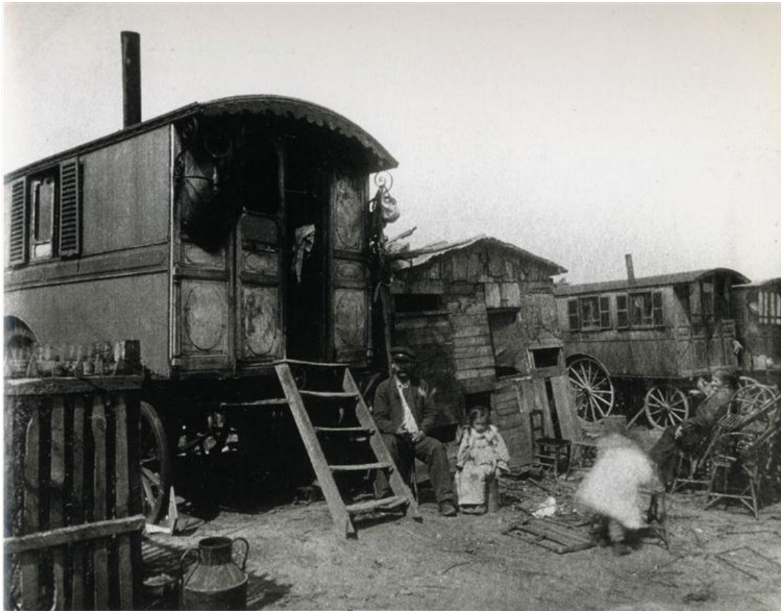
Fig.1 Porte d'Ivry, Eugene Atget.

Cela pourrait être le flou, qui la rend imparfaite. Cela pourrait être le fait d'appartenir à une autre époque, qui nous fait rêver, ou l'absence de couleur. Roland Barthes dit qu'il n'aime pas la couleur dans la photographie, qu'il la trouve artificielle, « un enduit apposé ultérieurement sur la vérité originelle du Noir-et-Blanc 11 ». La magie du noir et blanc réside, peut-être, dans l'écart qui s'établit entre la photographie et la réalité. La photographie en couleur est plus proche de ce que nos yeux perçoivent, et elle peut acquérir, parfois, un caractère presque documentaire. Le noir et blanc, par contre, nous éloigne de la réalité, et agit comme un filtre qui transforme ce que l'on voit et qui nous fait voyager dans le temps et dans l'espace. Atget ne se considérait pas comme un artiste, mais comme un documentariste, et il ne croyait pas ses photographies dignes d'être publiées. Pourtant, il est bien évident qu'il y a quelque chose dans ses images qui échappe à la réalité, qui échappe au documentaire et qui nous montre l'intérêt de l'invisible. Si l'aura qu'Atget sentait à Porte d'Ivry le jour où il a pris cette photographie a disparu lors de la reproduction mécanisée, une nouvelle aura s'est créée, l'aura de la