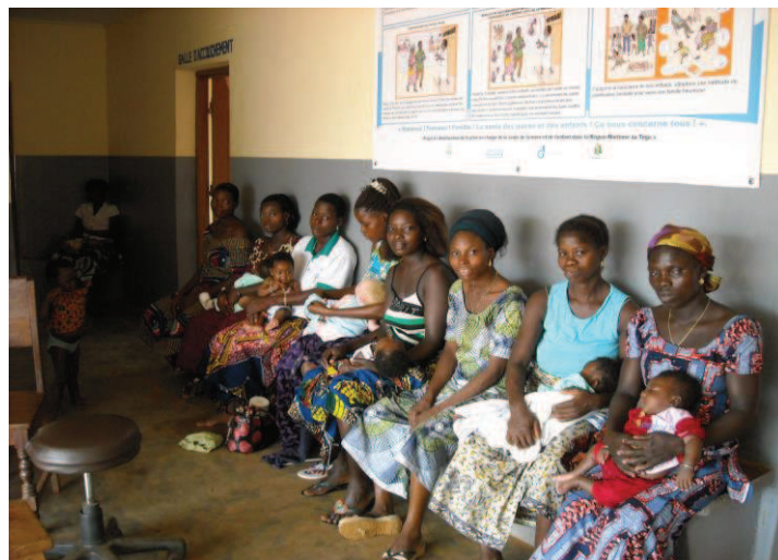
Séance de vaccination dans un centre de santé - Togo 2015