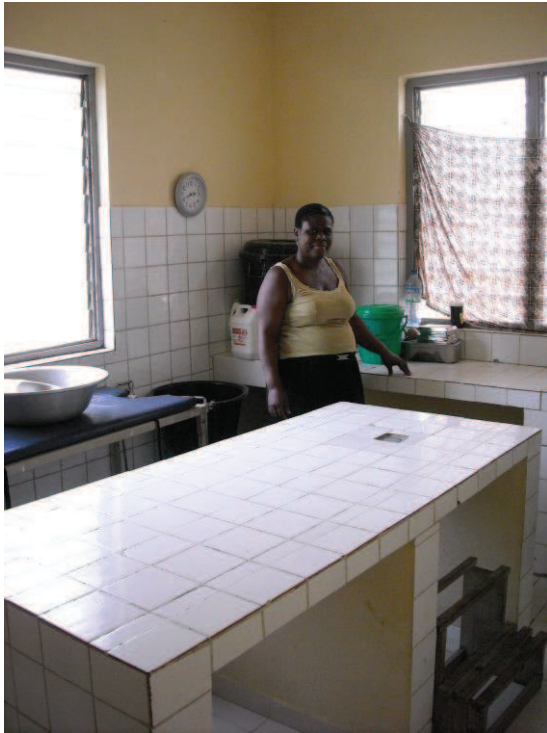
Table d'accouchement - Centre de santé réhabilité par HI - Togo 2015