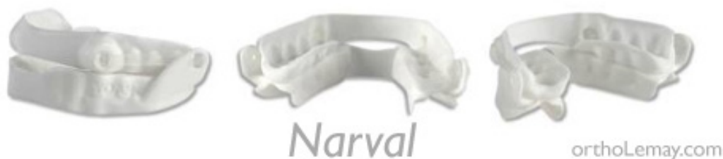
Figure 3 - ORM Narval avec bielle

Ces dispositifs peuvent être fabriqués sur mesure par le biais d'un praticien à partir de modèles d'étude ou thermoformés et à adapter directement par le patient. Le matériau utilisé peut être rigide ou souple.