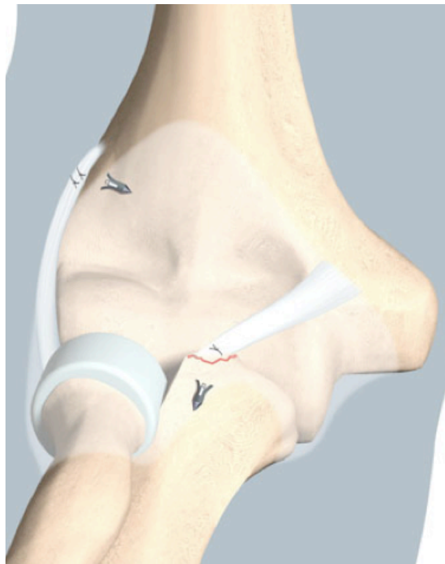
Figure 1 : Dessin représentant un coude droit de face après réinsertion du plan capsuloligamentaire antéromédial, mise en place de la prothèse de tête radiale et réinsertion du ligament collatéral latéral.(Dessin de Marc Donon)

Les suites post opératoires consistaient en une prescription d'anti-inflammatoires non stéroïdiens pendant cinq jours afin de limiter l'apparition d'ossifications secondaires ; l'ablation du drain à 48 heures et le début d'une rééducation passive dès le deuxième jour post opératoire sous couvert d'une orthèse articulée du coude. Cette orthèse était conservée six semaines au terme desquelles débutait une rééducation active.