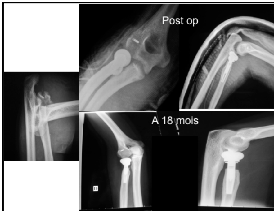
Figure 3: Résultats radiologiques après terrible triade en post opératoire et à 18 mois de recul