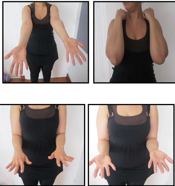
Figure 2: Résultats fonctionnels (extension / flexion / pronation / supination)