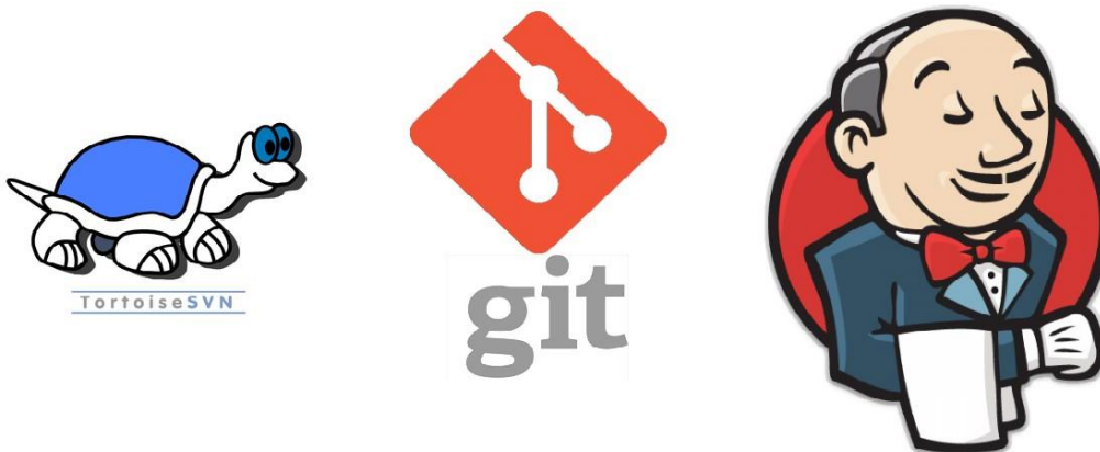
TortoiseSVN, Git, Jenkins

L'apprentissage de l'environnement technique et fonctionnel a requis beaucoup de temps. En effet l'industrialisation d'un projet informatique donne une toute autre dimension au travail de développeur. Par exemple, la notion de versionning d'un projet que je n'avais pas acquise pendant ma formation m'a confronté à utiliser des logiciels que je ne maîtrisais pas (git, svn, tortoiseSVN). Également, je n'avais pas la notion de contrôle et test du code grâce à des outils automatisés (Jenkins, Sonar).