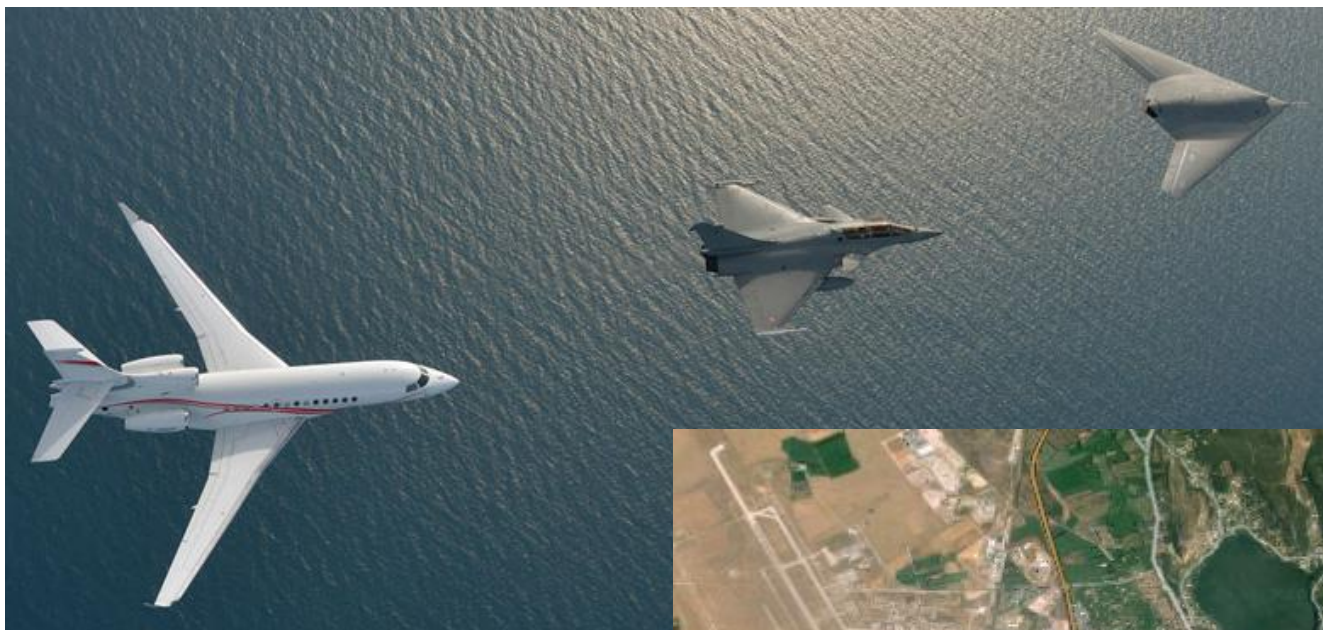
Avions de gauche à droite : Falcon 900LX ; Rafale ; Drone Neuron