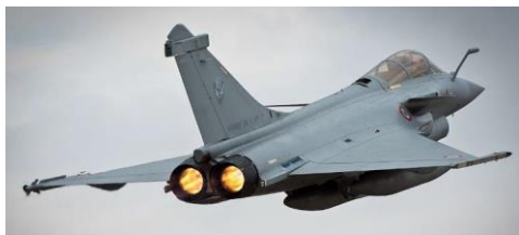
Rafale : Avion de chasse militaire (en service mai 2001)

Une fois que les pièces sont en conformité, les ingénieurs d'essais planifient un vol à l'aide de l'application BDE . Les détails du vol, le débriefing du pilote, le compte rendu du vol et les exigences satisfaites sont enregistrées. BDE permet donc la gestion de la partie essai en vol des pièces.