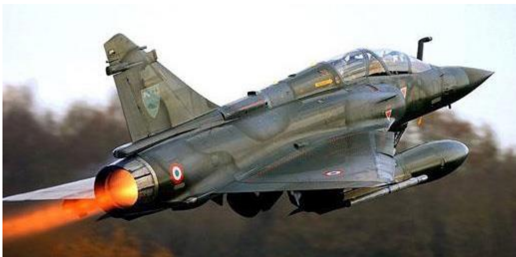
Mirage 2000 : Avion de chasse militaire (en service janvier 1984)

En effet, durant ce stage j'ai compris que l'essentiel du travail consiste à avoir la capacité de compréhension d'un domaine au niveau fonctionnel. Le développement proprement dit n'est qu'une petite part du métier d'une société de service. Un client est satisfait par le fonctionnement de l'application et non pas par la qualité du code écrit. Cependant, une bonne architecture initiale est primordiale pour obtenir une application efficace et évolutive.