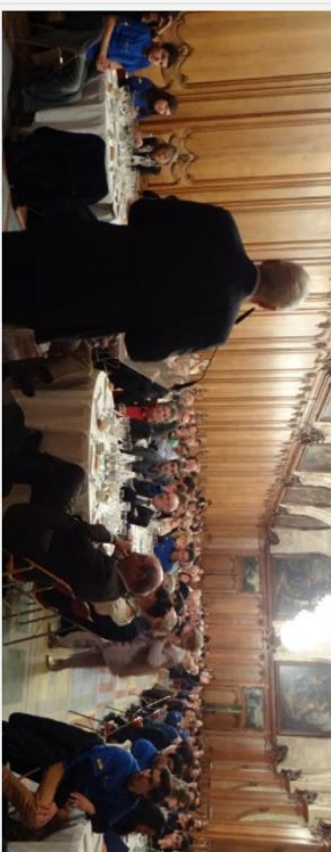
Dîner de clôture de l'université d'automne du M.E.F. 12.10.13, Caen

Le Mouvement Européen-France (M.E.F.) est une association qui regroupe – au-delà de leur appartenance politique – les hommes, les femmes et les associations qui souhaitent s'engager en faveur de la construction européenne dans une perspective fédérale . Sa vocation est de « développer dans le peuple français la prise de conscience de l'Europe et de la communauté de destin des peuples qui la composent » .