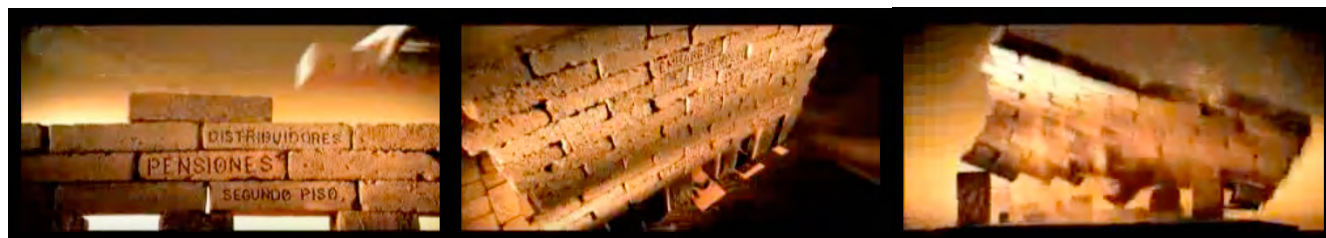
Ladrillos del 2 do piso ( https://www.youtube.com/watch?v=B4Lx_Rt6VNo )

Dès le lendemain, apparaît sur les écrans “Ladrillos, segundo piso, Obrador 54 ”, le premier spot negativo du PAN. “Segundo piso” fait référence aux travaux entrepris par AMLO en tant que chef du gouvernement de México en 2001 55 . Ce spot de vingt secondes est explicitement diffamatoire d'un point de vue visuel et auditif.