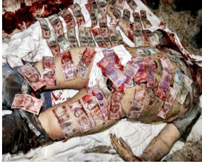
Fotografía del cadáver del narcotraficante Arturo Beltrán Leyva 2009 : México.

Les photos d'Arturo Beltrán Leyva ont logiquement fait réagir les médias mexicains, y compris ceux réputés pour être complaisants à l'égard du gouvernement comme El Universal . L'analyste politique Jorge Chabat analyse cette mise en scène cinq jours après les faits 240 :