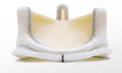
Bioprothèse Magna Ease®