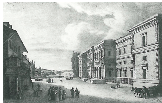
Vue du Muséum d'histoire naturelle de Neuchâtel, 1836, lithographie de Moritz

Au XIX ème siècle, des musées vont ouvrir dans toute l'Europe à un rythme très soutenu. Celui de Neuchâtel ouvre en 1835 ce qui va donner une grande dynamique scientifique à la ville. La création de tous ces musées permet un grand enrichissement des collections, parce que des personnes riches lèguent les collections aux villes et aux musées. Les musées eux-mêmes vont organiser des campagnes de collectes d'objets intéressants pour les collections. Cette période sera