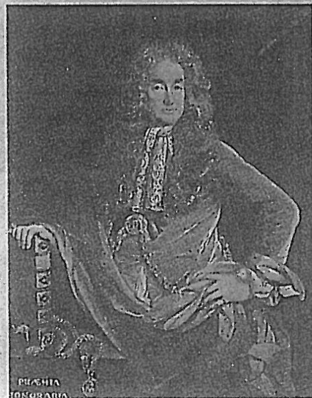
Portrait d'Elias Ashmole, fondateur de l'Ashmolean Museum d'Oxford, par Riley.

grand plaisir ; raison pour laquelle aussi, j'ai accumulé grande variété de Solides & de Corps naturels, & en ai fait don