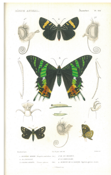
Planche n°144 tirée du livre de G.Cuvier, Le règne animal : insectes, seconde édition 1834

À partir du XVIII ème et XIX ème siècles, les grands voyages d'exploration scientifique se multiplient. Le but est de découvrir la géographie, la faune, la flore, l'astronomie et de conserver un maximum d'informations. Les équipages des bateaux étaient formés d'un capitaine, de naturalistes, de médecins, de cartographes, d'astronomes... et surtout de dessinateurs. Les explorateurs vont donc ramener des spécimens d'animaux, de végétaux et de minéraux mais aussi certaines créations humaines indigènes des pays visités. Toutes ces nouvelles découvertes vont s'ajouter aux collections de Beaux-Arts pour former les salles appelées cabinets de curiosités. La salle était généralement surchargée d'objets : sol, murs, plafond, tout était recouvert d'oiseaux, de crocodiles, d'œufs d'autruche, de pierres, de plantes exotiques et de