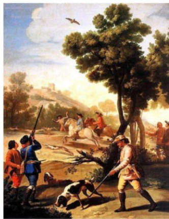
F. Goya, La partie de chasse