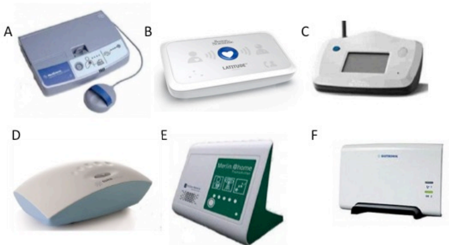
Figure 2 : Exemple de transmetteurs selon les marques :

L'ensemble de ces informations étaient rapporté par une attachée de recherche clinique, et analysées par un médecin rythmologue.