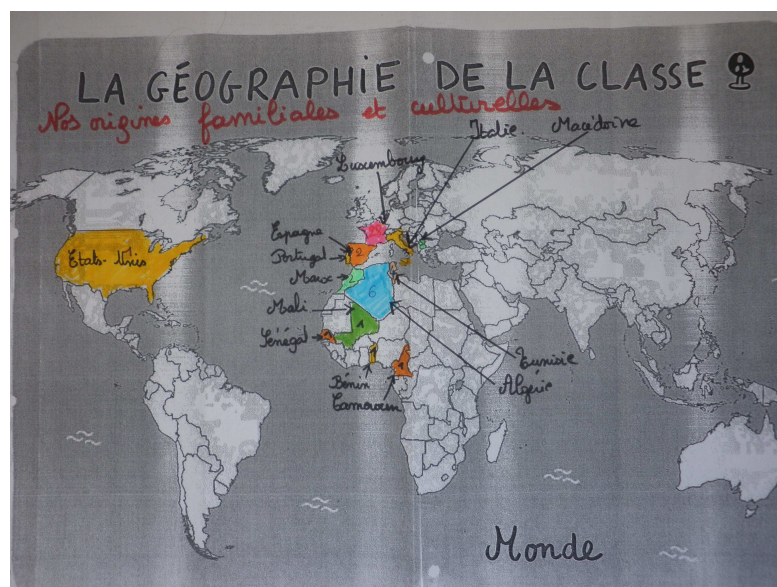
Carte des origines familiales et culturelles des enfants de la classe

Les élèves ont révélé qu'ils avaient aimé faire ce travail car ils avaient appris des choses sur leur famille. Ils ont aussi apprécié de montrer à leurs camarades d'où leur famille était originaire, même si leur origine n'était que française. Visuellement, la trace écrite finale était très parlante :