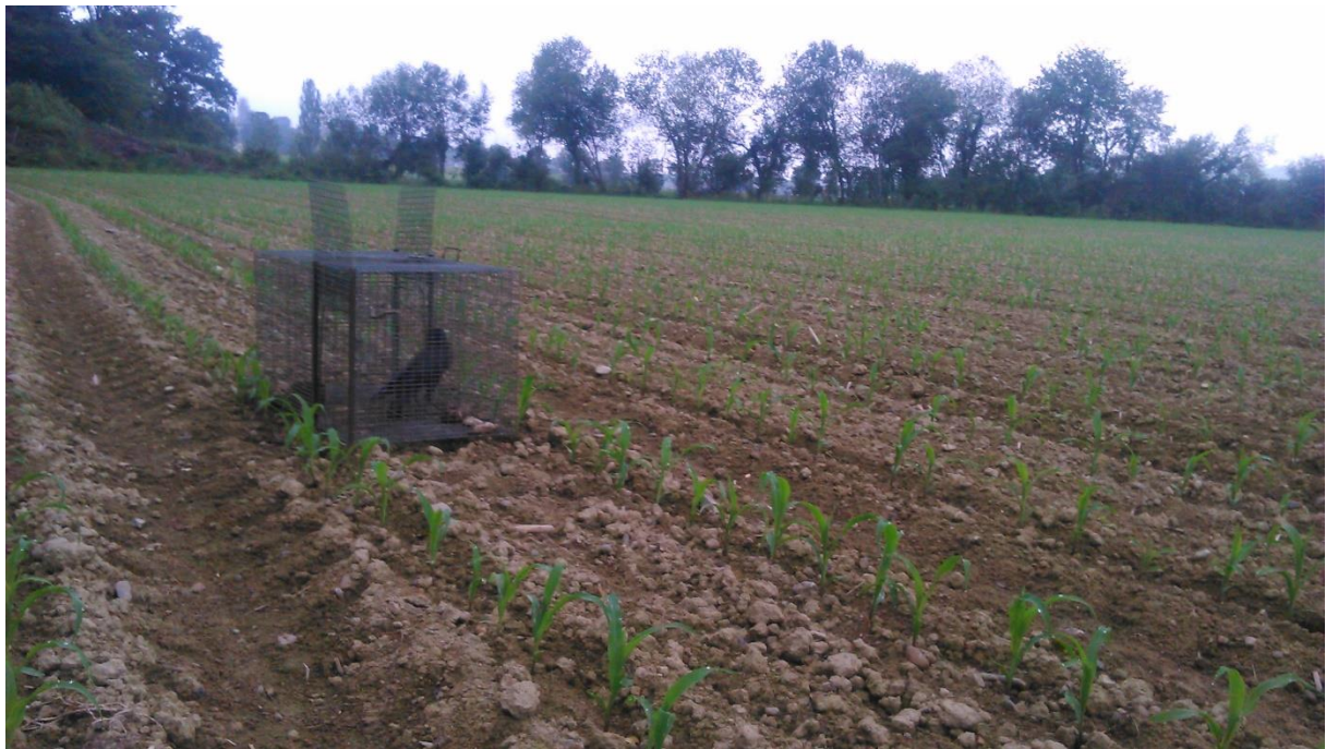
Figure 5 : Cage posée pour la capture de la corneille dans un champ de maïs, avec appelant (spécimen placé intentionnellement, destiné à en attirer d'autres dans le piège).