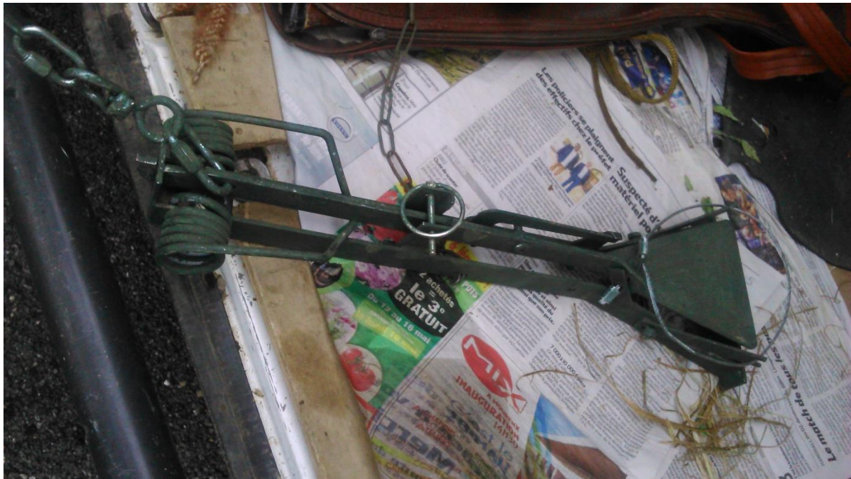
Figure 8 : Piège à lacet, modèle « Billard ». Le triangle à droite du piège correspond à une palette sur laquelle l'animal va faire pression en se déplaçant. Le lacet qui l'entoure va alors se libérer, par un système de détente, emprisonnant l'animal par la patte.