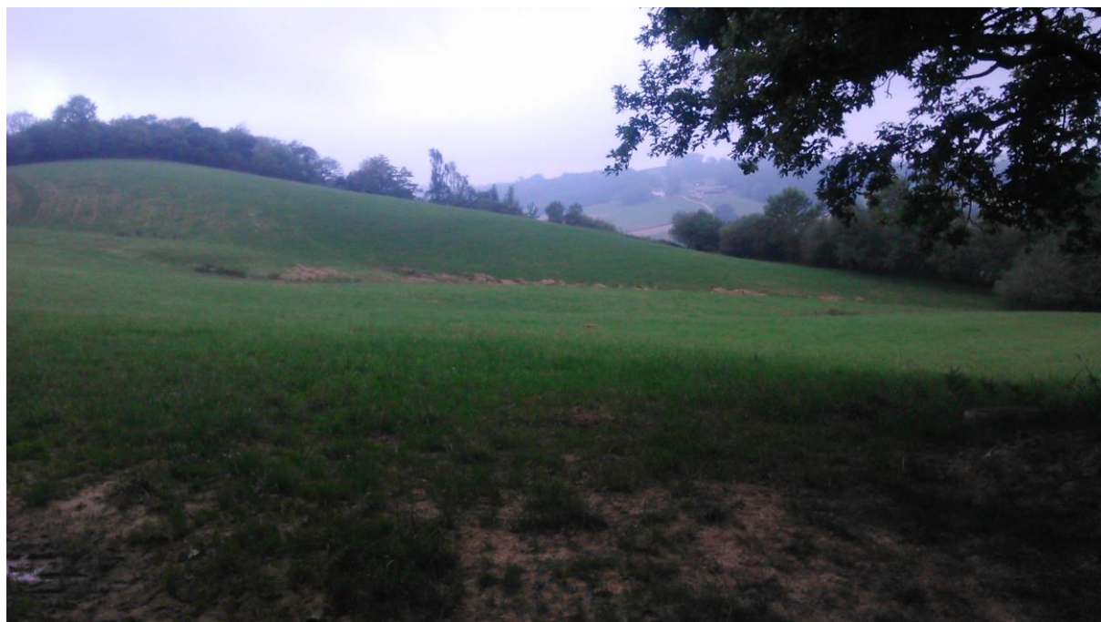
Figure 3: Un piégeur nous explique rester observer pendant 10 minutes tous les matins à cet endroit, lors de son circuit de levée de pièges. Il cherche des signes de présence de gibier.

Ainsi, la levée des pièges matinale est l'occasion pour certains d'anticiper, voire de préparer l'activité cynégétique, par l'observation des éventuels passages d'animaux gibiers, via les empruntes laissées, les déjections ou la présence visible d'individus.