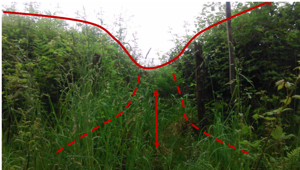
Figure 10: Coulée sous une haie en bordure de champ. La double flèche symbolise le cheminement probable des animaux, dont le passage est délimité par les pointillés.

public. Ces mêmes pièges ne peuvent pas non plus être utilisés en coulée (passage pour les animaux dû à une végétation moins dense).