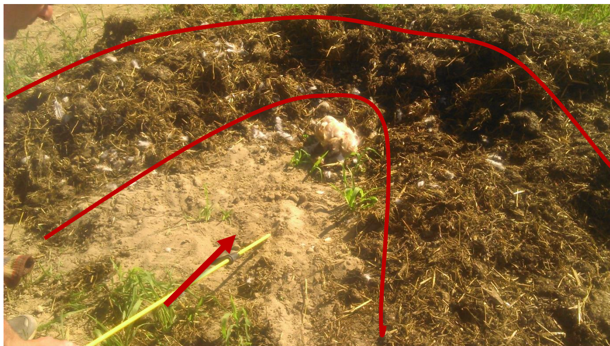
Figure 9 : Tas de fumier « en fer à cheval » délimité par la courbe rouge, dans lequel est placé un cadavre de poule, destiné à appâter le renard. Le monticule de fumier en forme de fer à cheval, formant une petite muraille, est censé inciter le renard à passer plutôt par l'entonnoir, symbolisé par la flèche rouge, où le chemin pour accéder à la poule est le plus praticable. Dans cet entonnoir est placé un ou plusieurs pièges, cachés sous le sable. (Crédit photographique : Antoine LABÉ, 2016).

son activité à la mairie de la commune concernée. Il détaille également les heures auxquelles relever les pièges : tous les matins avant midi. Pour les pièges de catégorie 3 et 4, c'est-à-dire où l'animal est maintenu vivant au piège, il convient de relever le piège dans les deux heures après le lever du soleil, ce pour éviter la souffrance et le stress inutiles de l'animal, immobilisé sur le piège. Couplés à certaines techniques spécifiques, comme un dispositif de tas de fumier en « fer à cheval », les pièges de catégories 4 peuvent être particulièrement intéressants.