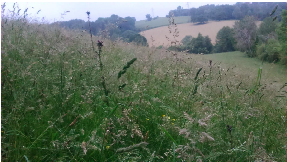
Figure 11: Prairie d'herbes hautes. Un piégeur ayant posé un piège pour le renard à proximité, constate que son piège n'a rien attrapé ce matin, comme les derniers jours. Il l'explique par la hauteur des herbes, qui doit inciter le renard à ne pas s'y engouffrer, par méfiance.

Concernant les pièges en X, qui évoluent dans la 2 e catégorie de pièges, un certain nombre de restrictions existent également. Il est notamment interdit de les tendre à moins de 200 m des cours d'eau, des étangs ou des marais uniquement avec appât végétal, en cas d'utilisation d'un appât. Ils sont utilisables, nous dit l'article, « à plus de 200 m des cours d'eau - en gueule de terrier et dans les bottes de paille et de foin ; au bois, dans une enceinte ménageant une ou des ouvertures d'une largeur inférieure ou égale à 15 cm ». Cette réglementation, loin d'être déconnectée de toute réflexion pratique (des pièges tuants posés des cours d'eau seraient susceptibles de tuer un animal protégé comme le vison d'Europe ou la loutre, également présentes aux abords des cours d'eau), pose effectivement un problème d'ordre géographique :