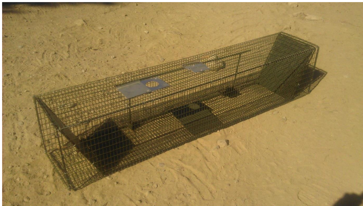
Figure 12: Cage, dite « chatière » entrant dans la 1ère catégorie de pièges. L'appât au milieu de la cage est posé sur une palette qui fermera les issues de part et d'autre de la cage en cas de pression.

comprend que les piègeurs appliqués et volontaires réussissent encore à capturer de nombreux nuisibles tout en restant dans les limites de la légalité.