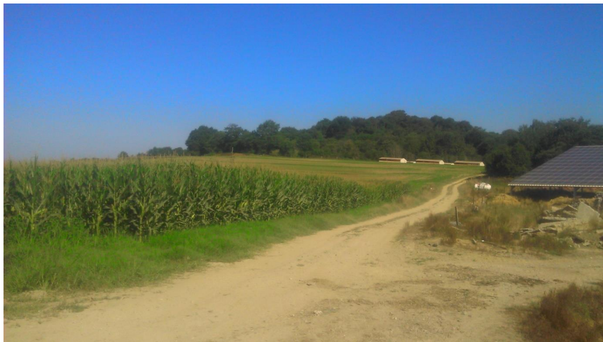
Figure 2 : Exploitation agricole à proximité d'Orthez. Au premier plan des champs de maïs et au loin, un élevage de poulets « label rouge ». Sur les trois bandes de 17 000 volailles produites par année, le propriétaire et exploitant estime à environ 900 les pertes annuelles dues aux attaques d'animaux sauvages.

pas deux nuits consécutives, en plusieurs fois, mais là j'ai commencé à racheter de la volaille, je suis sûr que le préjudice j'en ai pour 200 euros. » (Entretien 4).