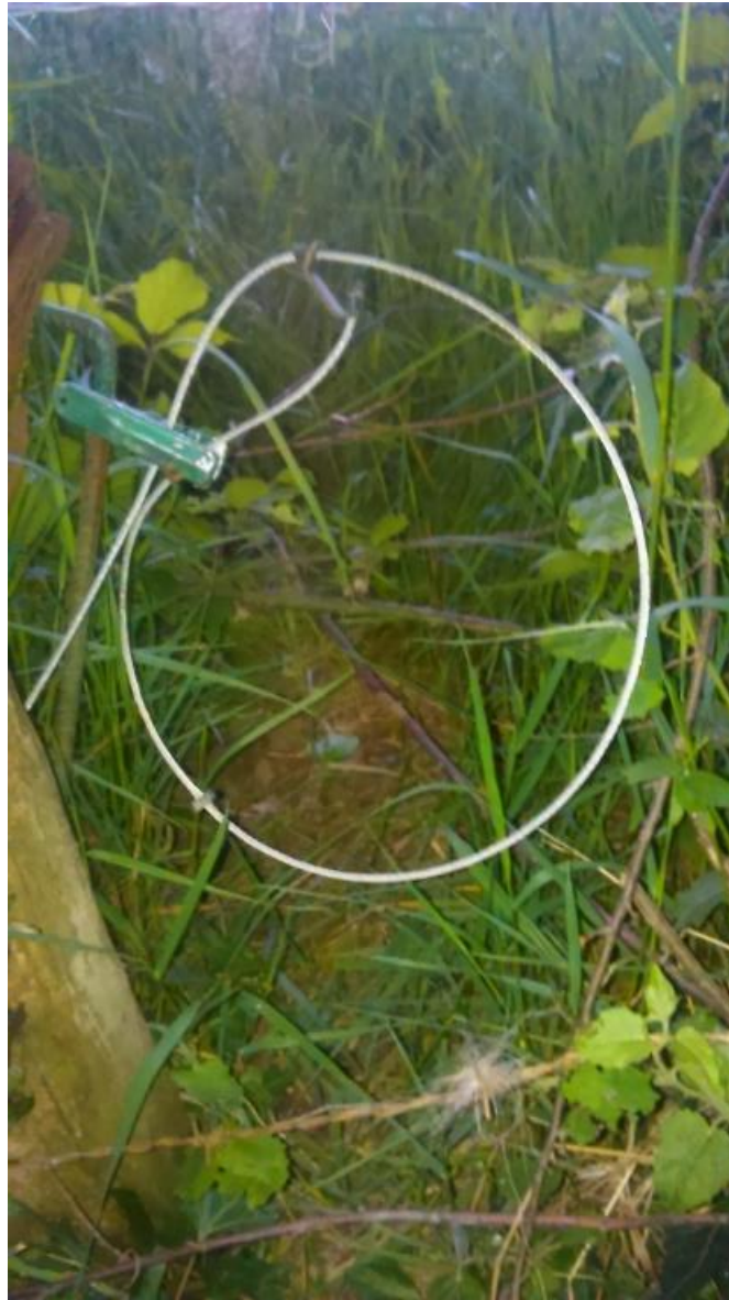
Figure 7 : Un collet à arrêtoir posé dans une coulée, destiné à attraper vivant l'animal qui passerait là.