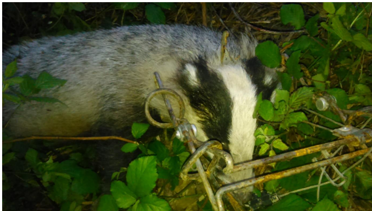
Figure 4 : Blaireau, classé gibier, abattu par un piège en X.

Le piégeage, par la compilation des données de dégâts et de captures, est donc susceptible, au-delà de lutter contre les dégâts des nuisibles, d'être utilisé comme outil de connaissance de la petite faune sauvage et d'aide à la décision en matière de gestion de la faune sauvage. Ainsi, le respect de cette procédure administrative constitue un enjeu de taille, dont certains piégeurs tentent à tout prix de communiquer l'importance : « Moi, le mec il m'a appelé pour piéger pour le blé, il voulait pas signer l'attestation de dégâts. Je lui ai dit « Ben moi je piège pas si tu signes pas l'attestation de dégâts. » » (Entretien 5).