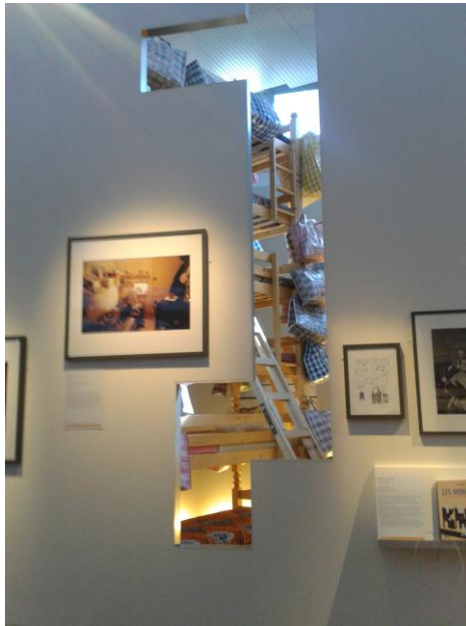
Barthélémy Togo, Climbing Down, 2004

Au travers de ces deux exemples, nous pouvons donc voir que l'art contemporain ne s'appréhende pas de la même manière. Hors d'un contexte artistique, dans une exposition de société, il peut soit se fondre dans les dispositifs déjà présents, soit créer de nouveaux codes de lecture.