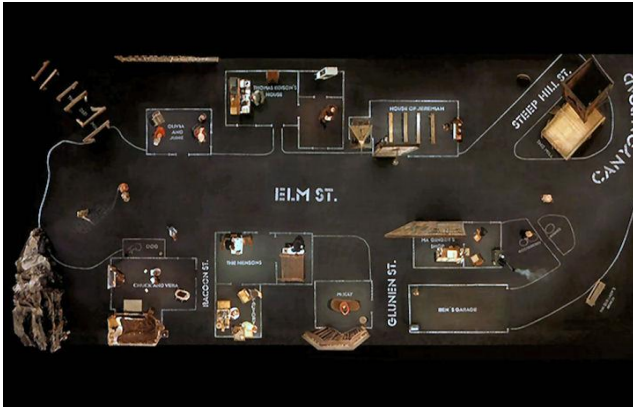
Dogville, Lars Von Trier

l'économie se réfère au film Dogville de Lars Von Trier. Cette idée explicitait bien les problématiques de l'économie, qui malgré un terme englobant, renferme une multitude d'enjeux sous-jacents, comme des connexions souterraines, qu'il faudrait déceler.