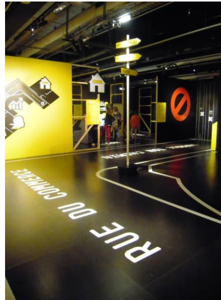
Economie, Krach, Boom, Mue

Et en effet, ce dont les visiteurs se rappellent sont les objets scénographiques qui les ont marqués, créant un univers familier, facilement compréhensible. Pour Sophie Bougé, « il fallait laisser une trace sensuelle des choses que l'on voit, que l'on peut nommer ». Cela permet de se repérer dans un contenu qui n'est pas toujours maîtrisé, d'autant plus que cette importance du visuel permet à la mémoire de fonctionner. Elle contribue donc scénographie à la création d'éléments phares formant le souvenir commun, en focalisant l'attention collective sur quelques éléments marquants.