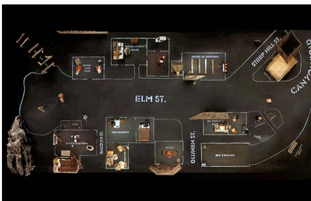
Dogville, Lars Von Trier

l'économie se réfère au film Dogville de Lars Von Trier. Cette idée explicitait bien les problématiques de l'économie, qui malgré un terme englobant, renferme une multitude d'enjeux sous-jacents, comme des connexions souterraines, qu'il faudrait déceler.