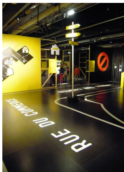
Economie, Krach, Boom, Mue

Et en effet, ce dont les visiteurs se rappellent sont les objets scénographiques qui les ont marqués, créant un univers familier, facilement compréhensible. Pour Sophie Bougé, « il fallait laisser une trace sensuelle des choses que l'on voit, que l'on peut nommer ». Cela permet de se repérer dans un contenu qui n'est pas toujours maîtrisé, d'autant plus que cette importance du visuel permet à la mémoire de fonctionner. Elle contribue donc scénographie à la création d'éléments phares formant le souvenir commun, en focalisant l'attention collective sur quelques éléments marquants.