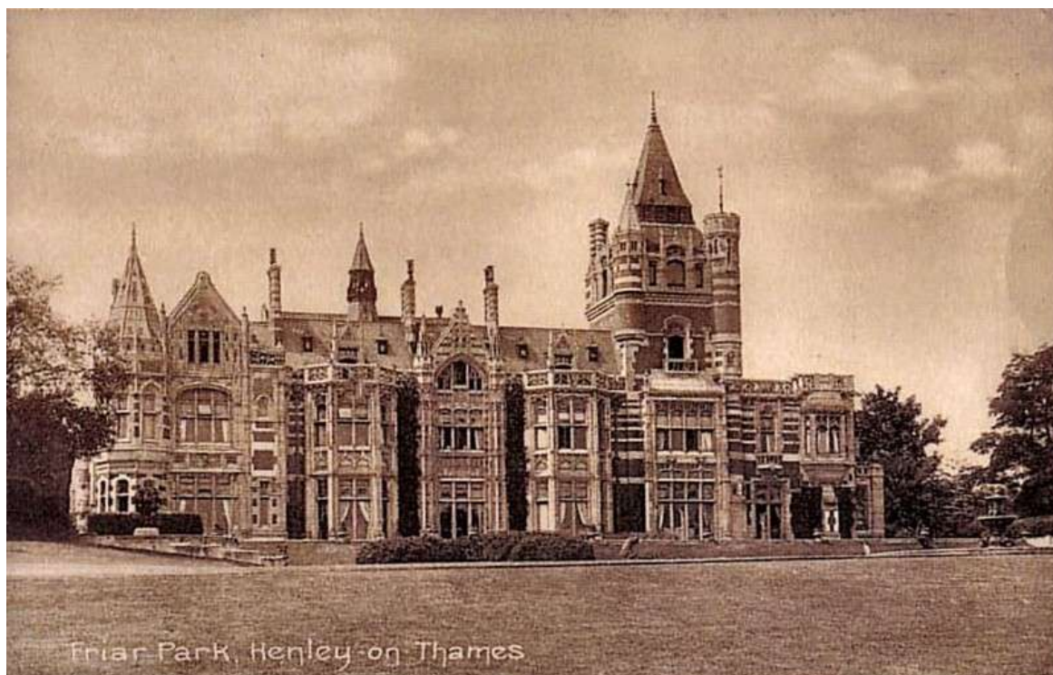
Vue ancienne du château