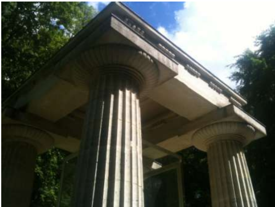
Détail des chapiteaux et de l'entablement