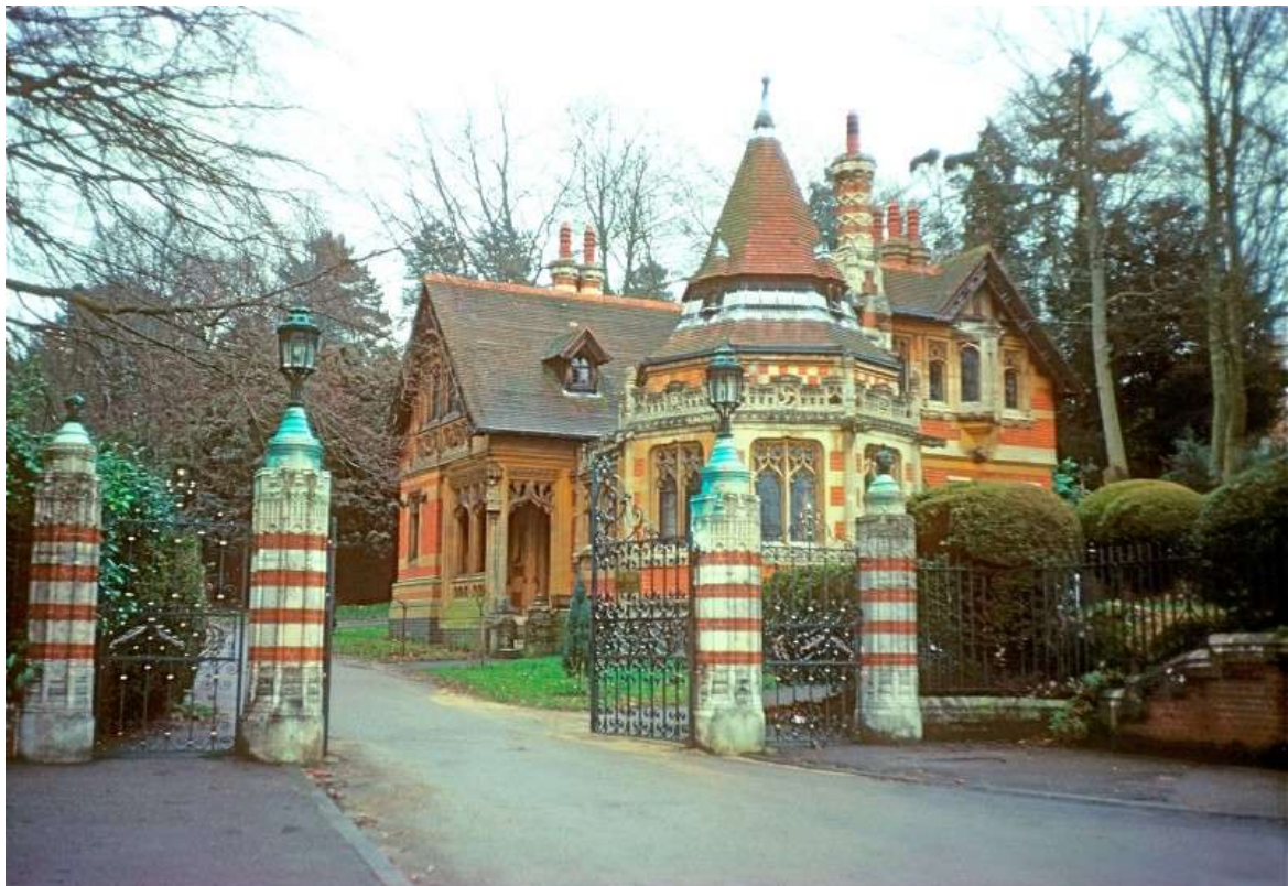
Vue moderne de l'entrée du domaine