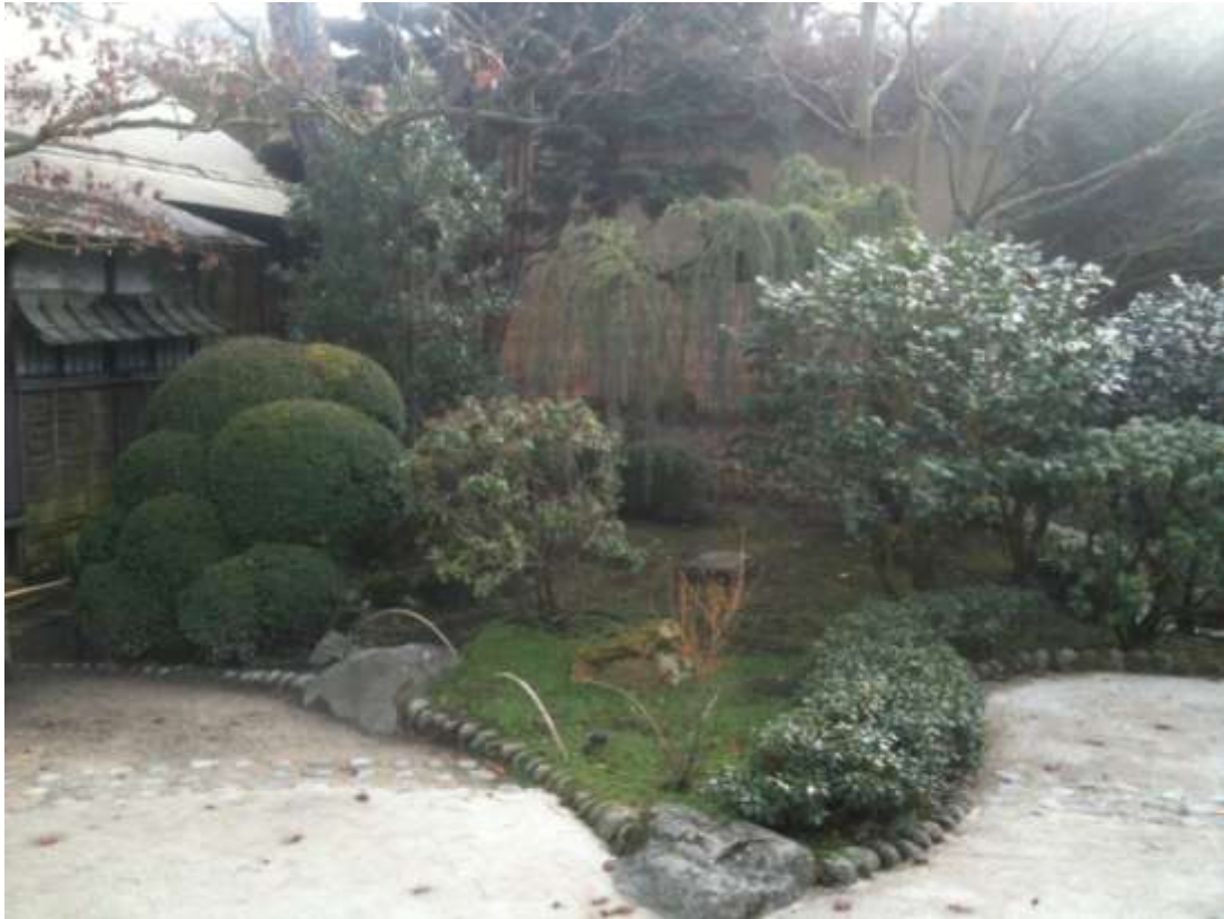
Vues du jardin japonais