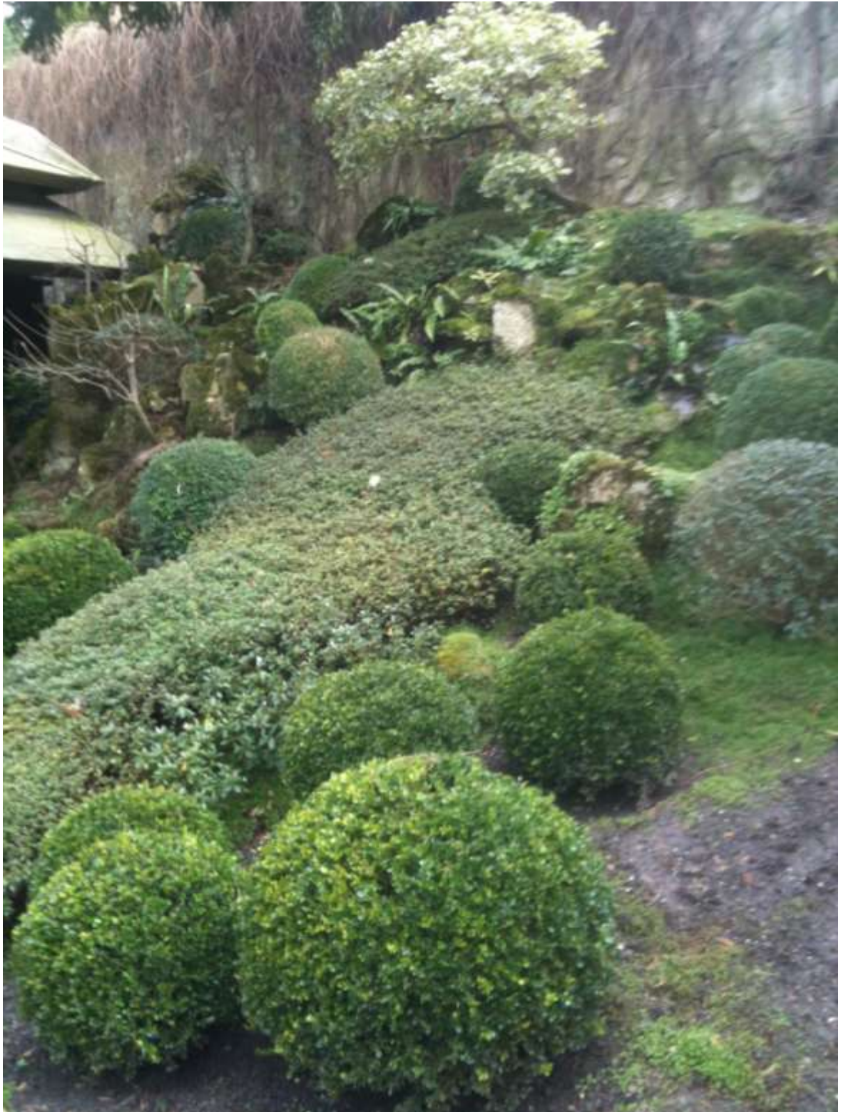
Vue du jardin japonais