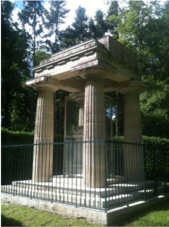
Vue du Cénotaphe de Cook