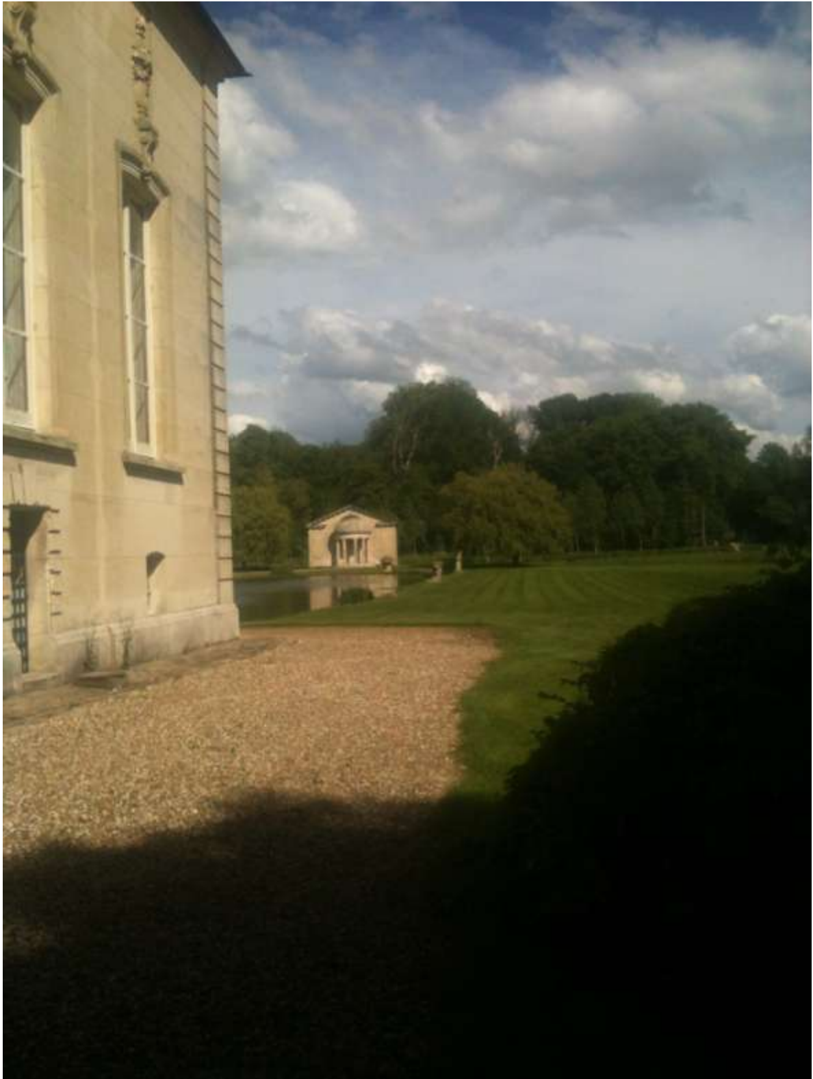
Remontage de la façade de la laiterie en fond de scène pour la pièce d'eau à l'arrière du château