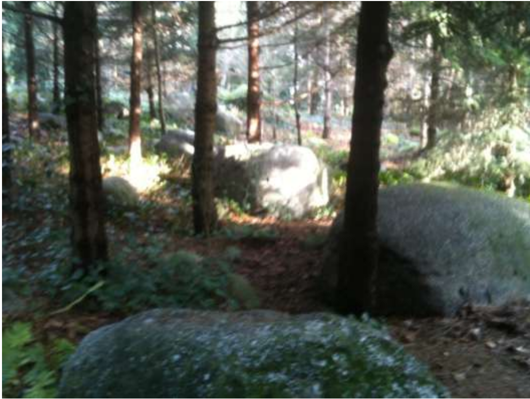
Vue de la forêt vosgienne