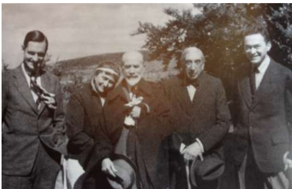
Bernard Berenson, son épouse et trois amis à la Villa I Tatti