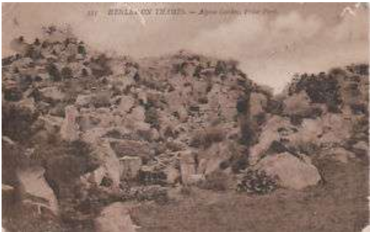
Vue ancienne des enrochements artificiels