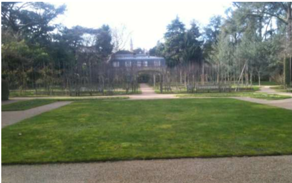
Vue actuelle du jardin « français » et du verger