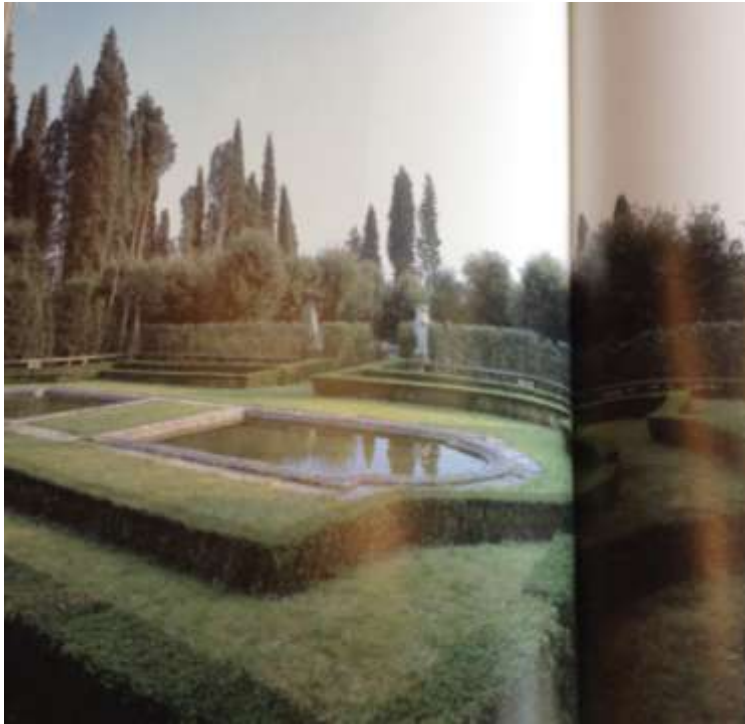
Vues du jardin