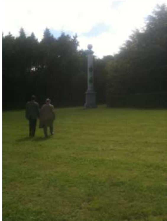
La Colonne rostrale, sur la grande pelouse face au château