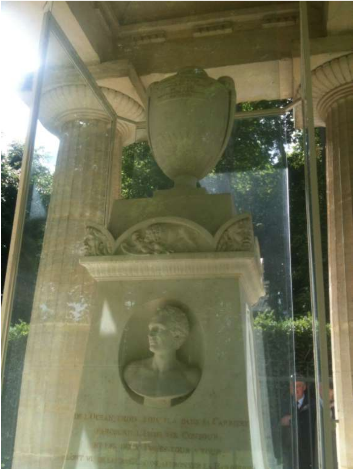
Urne funéraire et buste sur socle, par Augustin Pajou