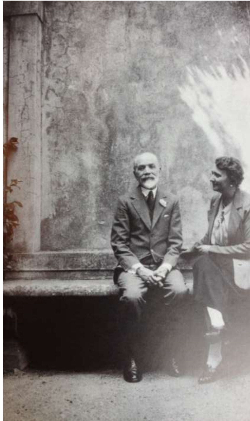
Bernard Berenson et son épouse à la villa I Tatti