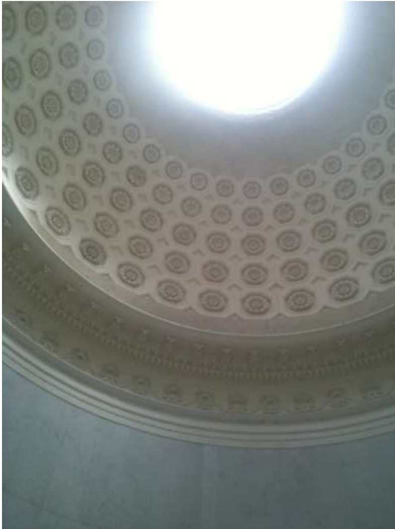
Vue intérieure de la coupole du temple