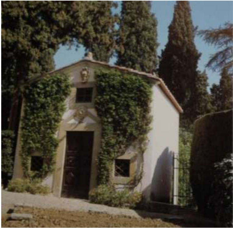
Vue de la chapelle