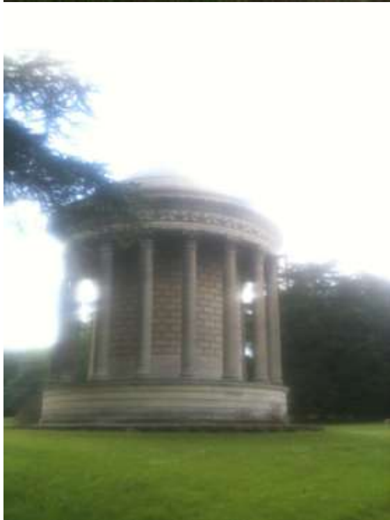
Vues extérieur du Temple de la Piété filiale