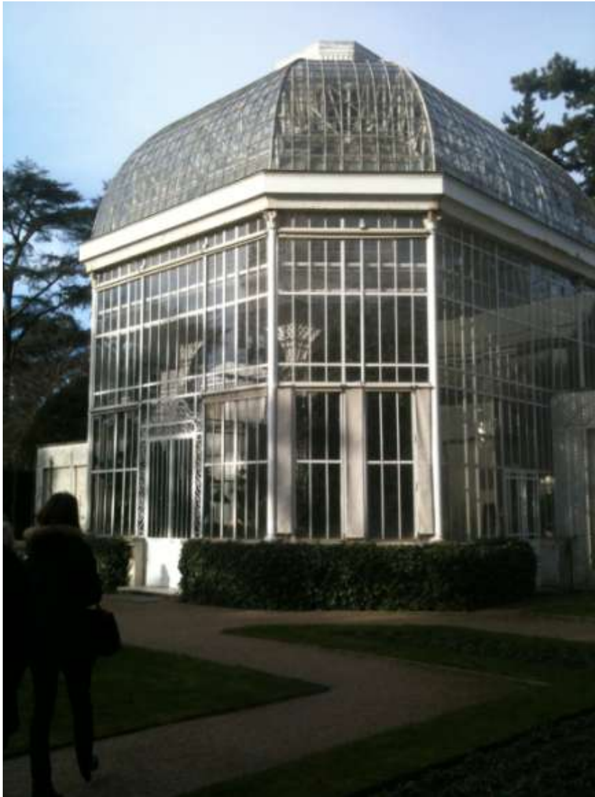
Vue actuelle de la serre