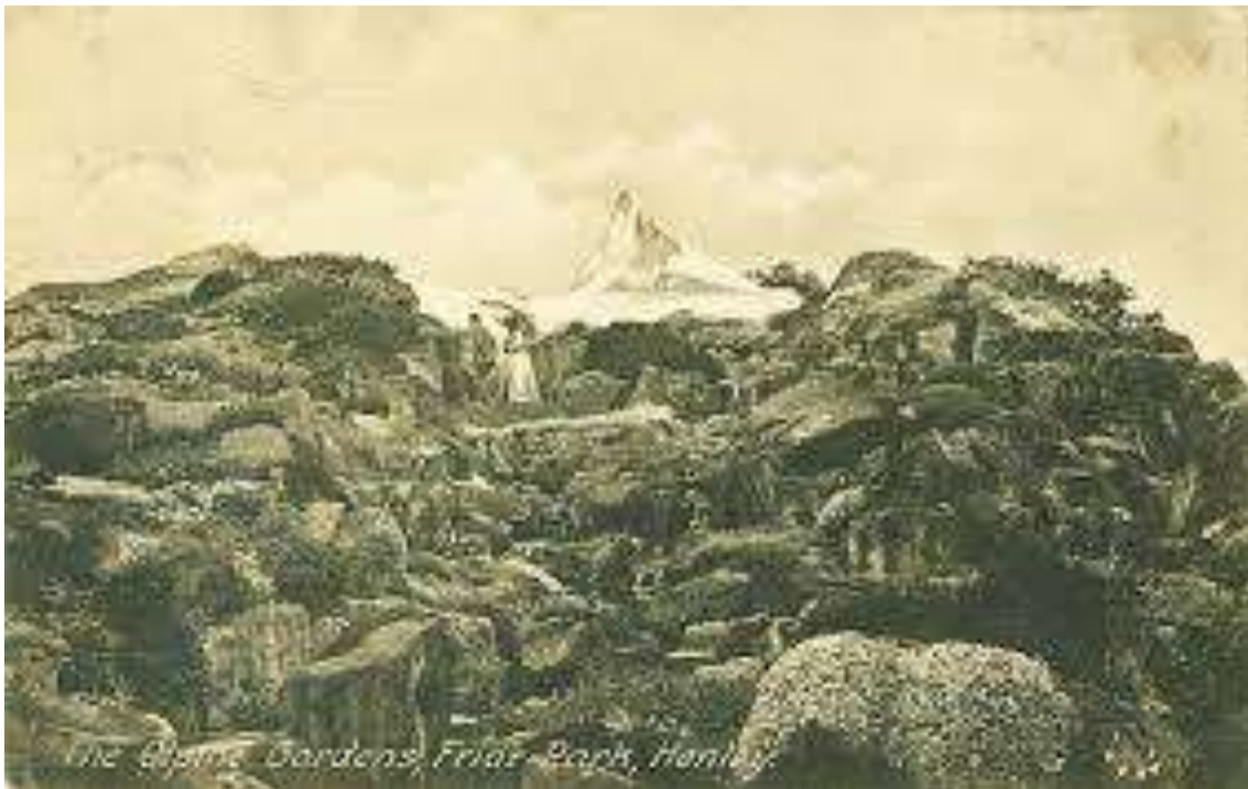
Vue ancienne du « Glacier »