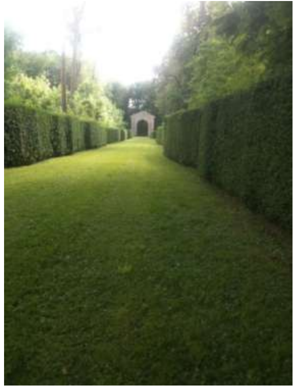
Vue des allées du parc