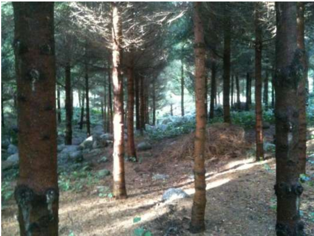
Vue de la forêt vosgienne