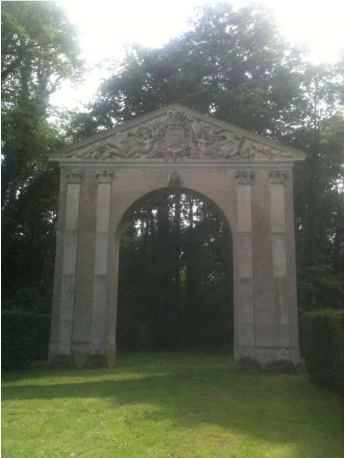
Remontage du fronton provenant du palais de Saint-Cloud