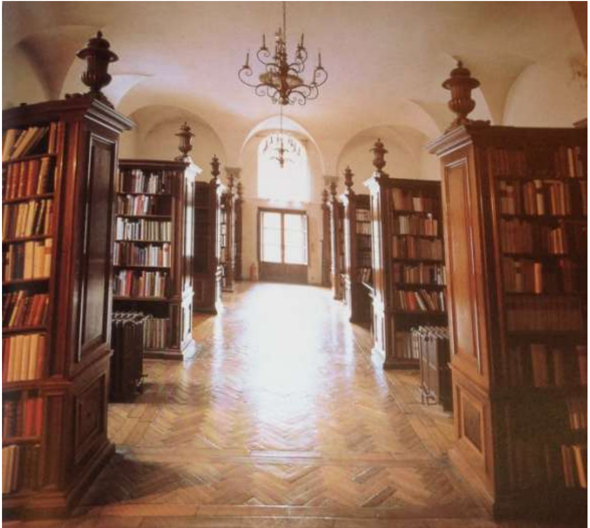
Vue de la bibliothèque