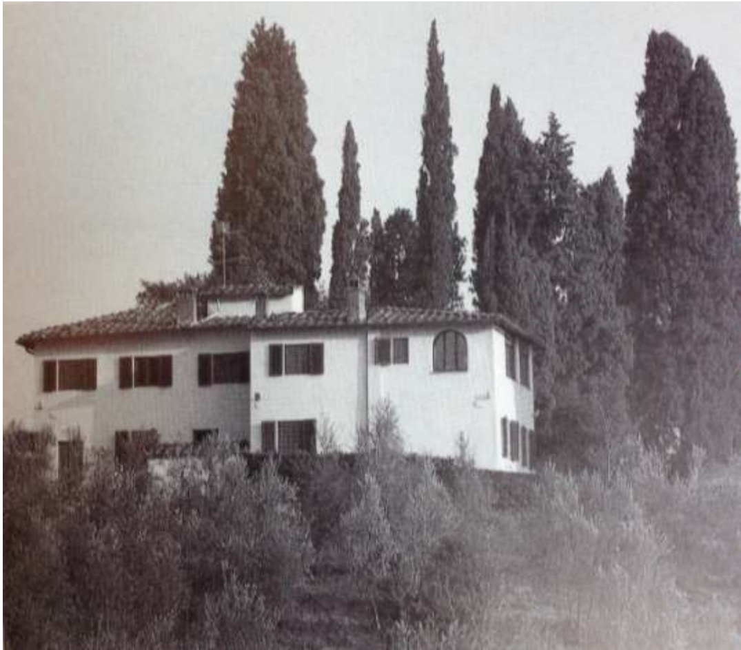
Vue de la villa