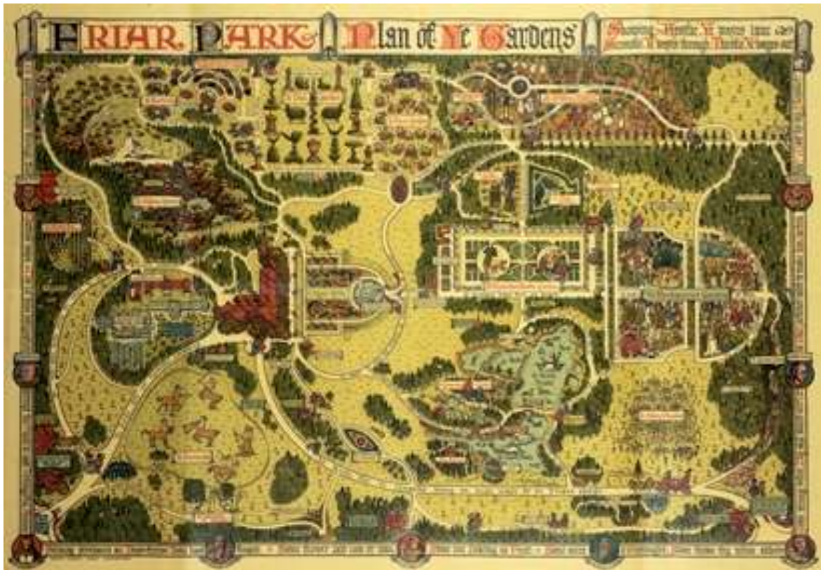
Plan colorisé publié par Sir Frank Crips