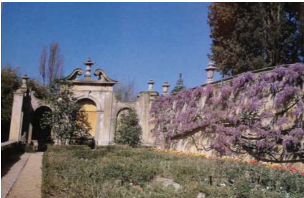
Vue d'une terrasse du jardin