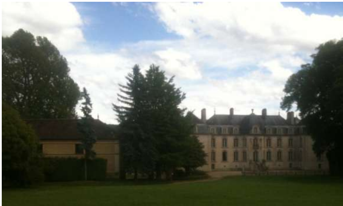
Façade d'entrée du Château de Jeurre.