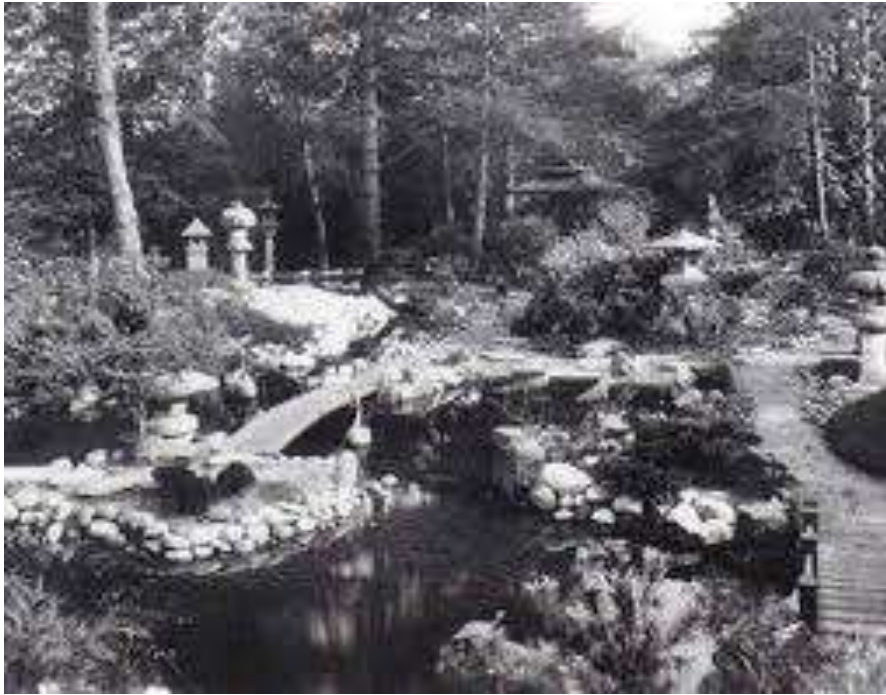
Vue ancienne du jardin « japonais »