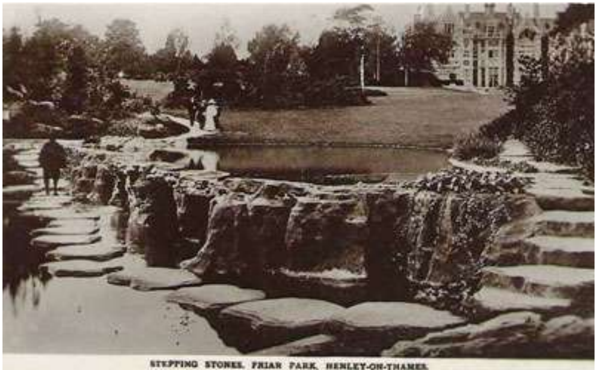
Vue ancienne des promenades