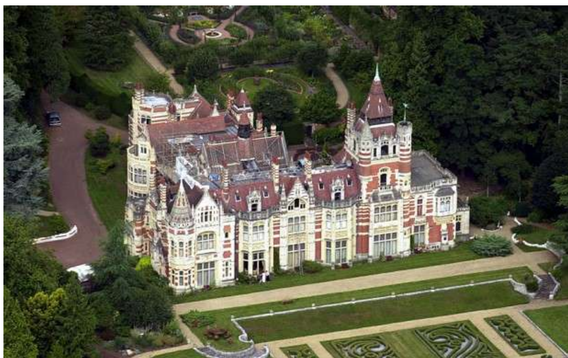
Vue moderne du château