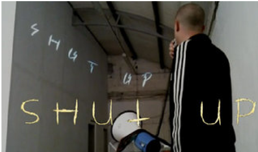
Illustration 17 - TAG E.U.L.E.