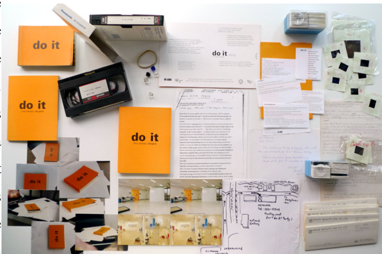
Illustration 5 - Présentation du projet « Do it ».

L'œuvre peut ne pas être achevée, celle-ci n'existe que si elle est affichée, exposée du moins visible d'un public. Grâce aux outils numériques, le partage et la diffusion des œuvres est grandement simplifié. Plus besoin d'être un artiste reconnu et de dépendre d'un musée, de présenter des