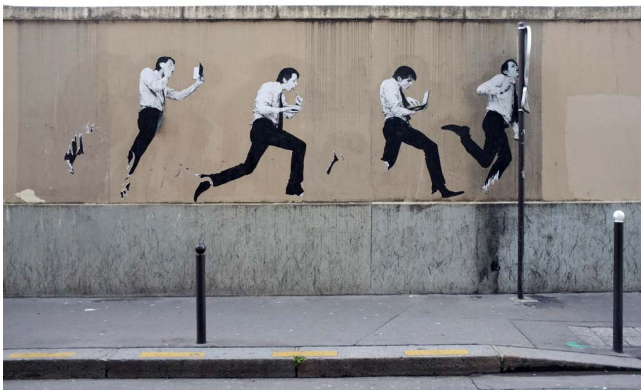
Illustration 24 - Oeuvre de Levalet.

dans l'usage que nous en faisons dans notre quotidien que de sa place dans l'art. Une partie de l'ouvrage de Yvan Tessier intitulée « Le règne des écrans » 126 revient sur ces artistes qui critiquent « la place démesurée qu'occupent le virtuel et les écrans – ordinateurs, télévisions, portables – dans nos vies » 127 . Il appuie son propos en s'appuyant sur les œuvres de plusieurs artistes mais surtout à travers le travail du français Levalet 128 qui met souvent en scène dans ses affichages des hommes obsédés par des écrans ou sur-connectés.