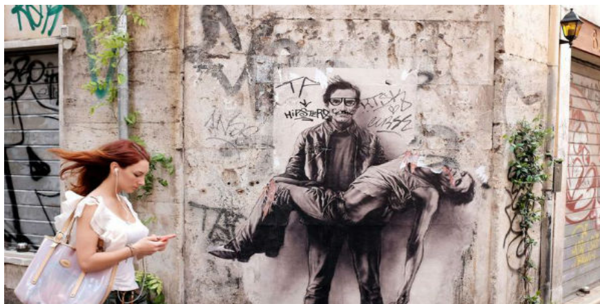
Illustration 9 - Pasolini par Ernest Pignon-Ernest.

D'autres artistes vont par ailleurs utiliser la photographie pour créer. Alors que des pionniers comme Ernest Pignon-Ernest vont utiliser des images peintes ou dessinées, sérigraphiées qu'ils vont venir coller sur les murs des villes, d'autres artistes vont créer leurs œuvres à partir de photographies. L'artiste n'a plus besoin de savoir représenter pour pouvoir s'exprimer, il peut laisser l'appareil capturer ce qu'il souhaite montrer pour ensuite le retravailler et l'offrir au regard de tous. La machine remplace l'homme et effectue le travail de représentation de l'artiste. La pratique ne s'en retrouve que simplifiée pour des personnes n'ayant pas eu de formation artistique. Le développement d'outils technologiques et numériques permet donc de conserver, documenter mais aussi de créer différemment et de diffuser plus largement. En effet l'arrivée du street art dans les musées notamment grâce aux photographies permet d'ouvrir la pratique à tout un pan de la population qui ne se sentait peut-être pas attiré, pas concerné ou qui ne voulait même pas s'intéresser au street art. Le fait qu'il s'agisse d'un art underground et illégal peut rebuter mais le découvrir en galerie dans un contexte légal peut créer un lien avec des amateurs d'arts qui se cantonnent à un mode de découverte classique. D'ailleurs lorsqu'on le questionne sur la place, l'aspect de l' underground de nos jours, l'artiste répond :