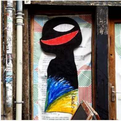
12, rue au Pont Foulon. 35000 RENNES.