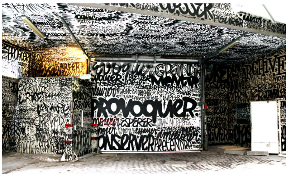
Illustration 15 - Extrait du travail de Denis Meyer.

utilisateurs de l'application. Elle permet donc d'exposer des œuvres aux yeux du monde entier. L'utilisation de la géolocalisation permet d'enregistrer une œuvre à son emplacement précis, mais également aux utilisateurs de découvrir les œuvres présentes autour d'eux. Le système est totalement participatif, chacun poste ce qu'il le souhaite, chacun peut identifier un artiste lorsque son œuvre est postée etc. Cependant, le site ne semble pas avoir réellement de filtre. Cela peut poser problème lorsqu'un artiste est identifié, comment être sûr qu'il s'agit bien de son travail ? De même, certaines œuvres postées ne semblent pas être réellement des œuvres prenant place dans l'espace urbain ou découlant du mouvement street art. Évidemment, les contributions étant ouvertes, cela dépend tout d'abord de la définition que l'on a du street art et de ce qu'est le street art. La naissance plus ou moins récente d'un site comme celui-ci qui compte aujourd'hui plusieurs milliers d'utilisateurs est révélateur de l'importance qu'a pris Internet pour le street art et de toutes les possibilités qui en découlent.