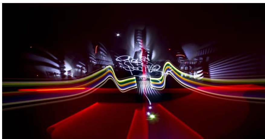
Illustration 22 - Light Painting par Rézine.

par de nombreux artistes tels que Picasso ou Man Ray. Le lightpainting consiste donc simplement à utiliser un appareil photographique avec un temps d'exposition long et dans le noir en dessinant devant l'objectif des formes et dessins à l'aide d'une source lumineuse, une lampe de poche, des leds, des néons, etc. Ainsi les traces lumineuses se fixent sur la photographie, l'appareil retiens alors le mouvement et le tracé effectué par les artistes. Bien que cette technique photographique ne soit pas récente, elle est réapparu plus récemment notamment grâce à l'utilisation facilitée des appareils photographiques mais également grâce à quelques artistes urbains qui vont utiliser cette technique pour créer en jouant avec la lumière.