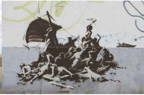
Illustration 3 - Le radeau.