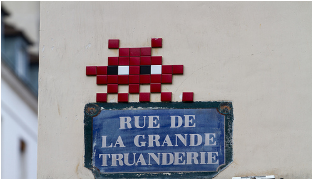
Illustration 12 - Mosaïque d'Invader.