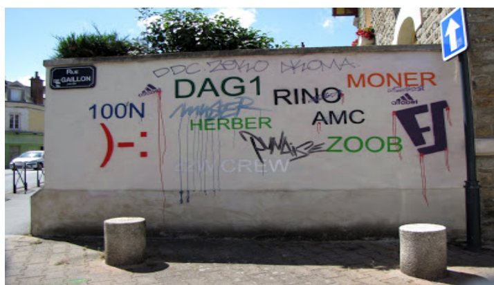
Illustration 16 - Tag Clouds.

L'objet d'un geste artistique dans la ville n'est pas de délivrer de manière explicite un message – ça c'est celui de la publicité, de la signalétique ou de la propagande – mais plutôt de questionner une situation et de mettre à jour des rapports de force entre des usages et des gouvernances. [...] Avec 'Tag Clouds' est questionnée la prédominance d'un langage technocratique et de la propriété privée dans nos expériences et imaginaires de ville. 80