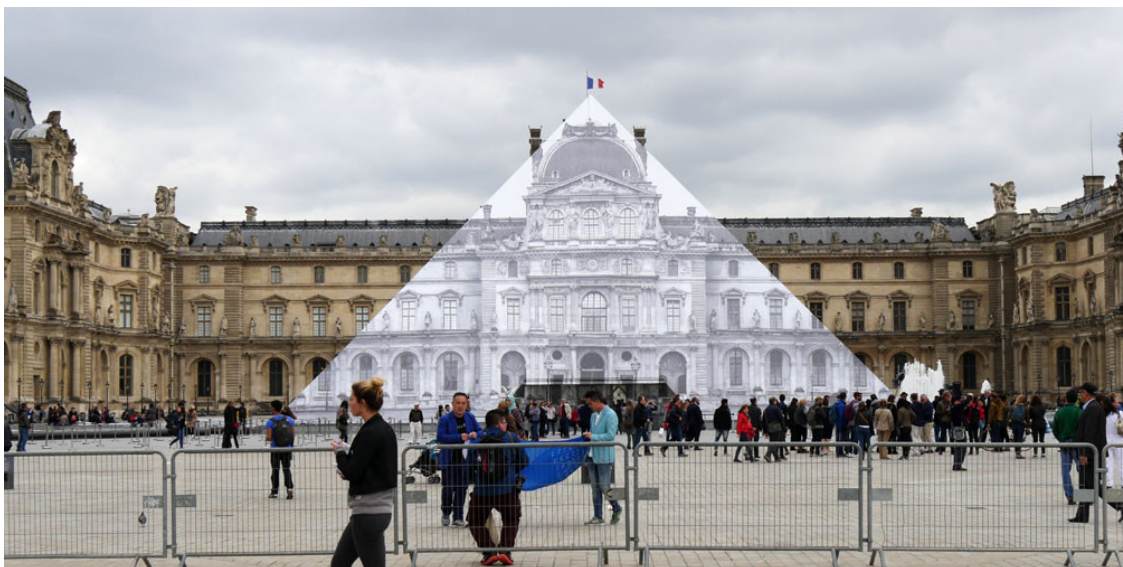
Illustration 7 - Anamorphose de JR au musée du Louvre.

sur la grande pyramide du Louvre 49 en la faisant disparaître grâce à une anamorphose 50 collée sur la façade la plus photographiée de l'édifice. Grâce à la photographie et au numérique, notamment Photoshop, l'artiste offre une impressionnante illusion d'optique.