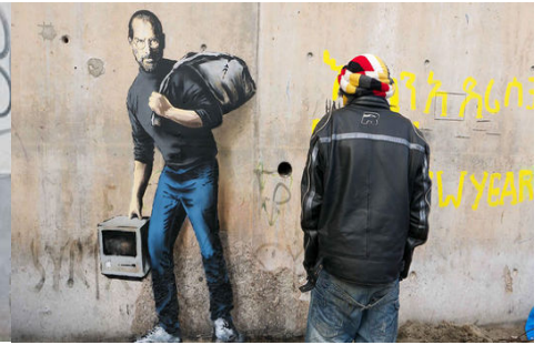
Illustration 4 - Steve Jobs.