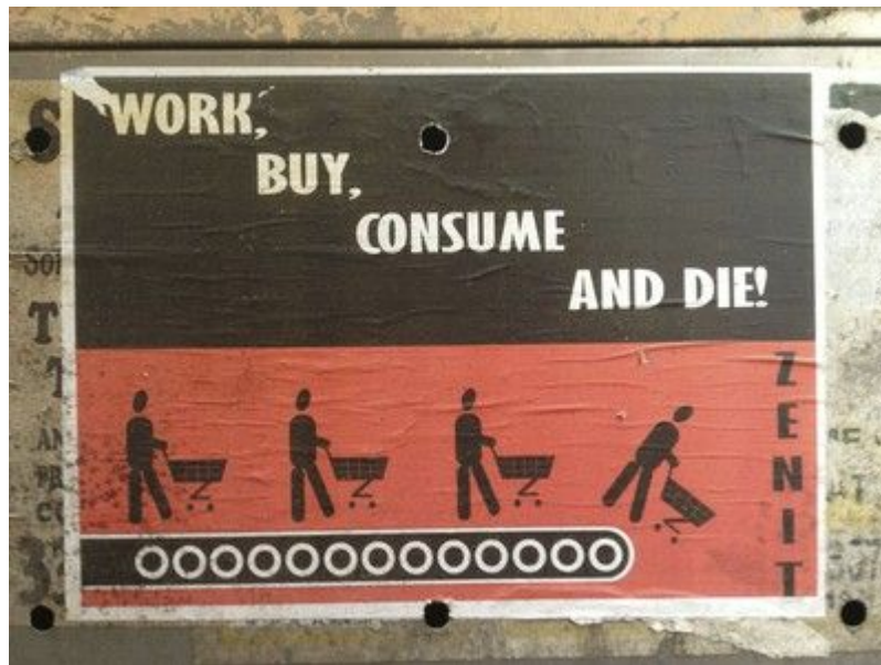
Illustration 6 - Travail de Zenit, extrait de Les murs révoltés

Cette image d'un art révolté, d'un art « manifeste », semble d'abord tenir pour bonne part au contexte où se déploie ce mode d'expression : la ville est en effet le lieu où siège le pouvoir [...] la rue est un espace politique (c'est le siège des institutions, mais aussi de l'émeute et des barricades, or l'art urbain naît dans la rue, donc il est un art politique. 45