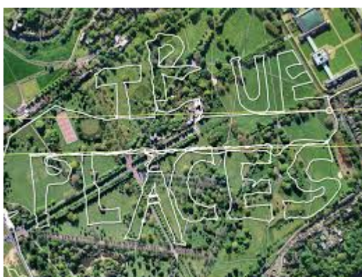
Illustration 19 - Meridians.

En effet des artistes vont s'amuser à user et détourner l'outil GPS et les récepteurs prévus habituellement à un usage pratique pour proposer des œuvres. Nous parlions d'artistes détournant le réel, certains d'entre-eux vont également détourner les outils du réel. On peut même trouver de nombreux exemples, notamment en musique, d'artistes utilisant des objets du quotidien, des objets purement pratiques et utiles à l'origine pour en faire de la musique. Des artistes