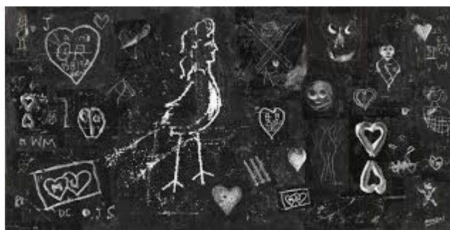
Illustration 8 - Photographie de Brassai.

les rues, la nuit, sans but mais avec un objectif : traduire avec des images ce qui fait la ville, ce qui fait son charme, ce qui l'interpelle. Et avec ce travail de découverte de la ville, il va être l'un des premiers à photographier et collecter les traces laissés par des artistes au cœur de la ville. Il permet ainsi à ces œuvres de vivre un peu plus longtemps à travers ses clichés. Il s'agit pour l'époque de dessins, de gravures et gribouillages qui sont bien loin des graffitis, tags et autres œuvres que nous pouvons voir aujourd'hui.