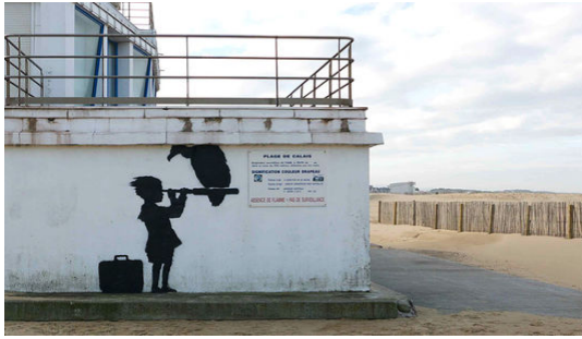
Illustration 2 - L'enfant et le rapace.