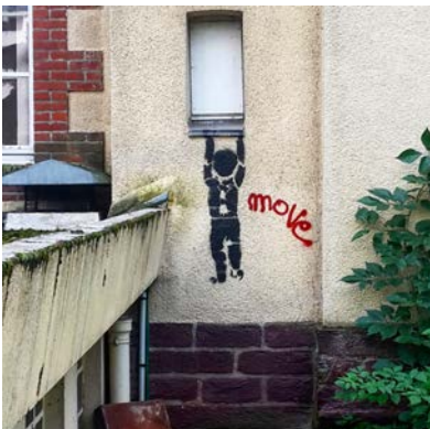
Promenade du lavoir. 35000 RENNES