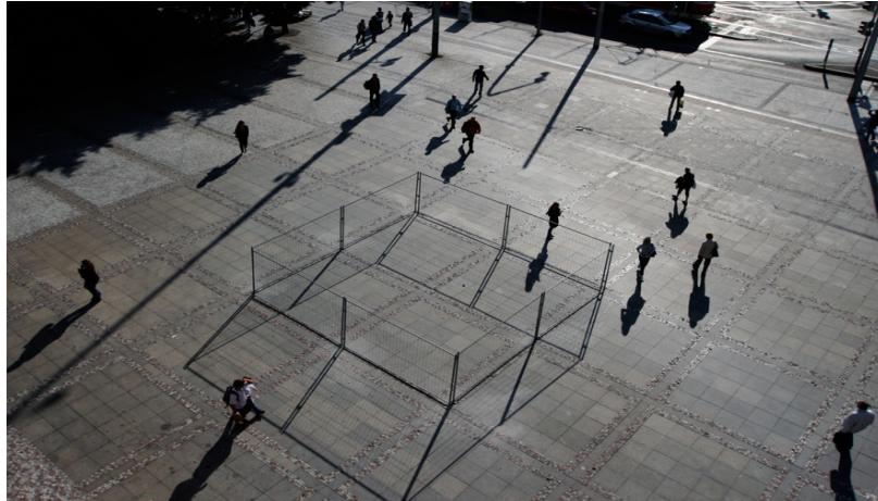
Illustration 14 - 50 square meters of public space.

Dans la société actuelle, notre espace de vie est défini par les normes légales et réglementaires, de la même manière que les clôtures déterminent le choix de notre libre circulation. En tentant de franchir ces limites, nous apprenons de quelle manière notre espace est limité. On peut alors comprendre comment l'individualité de chacun est soumise à une existence de restrictions. 70