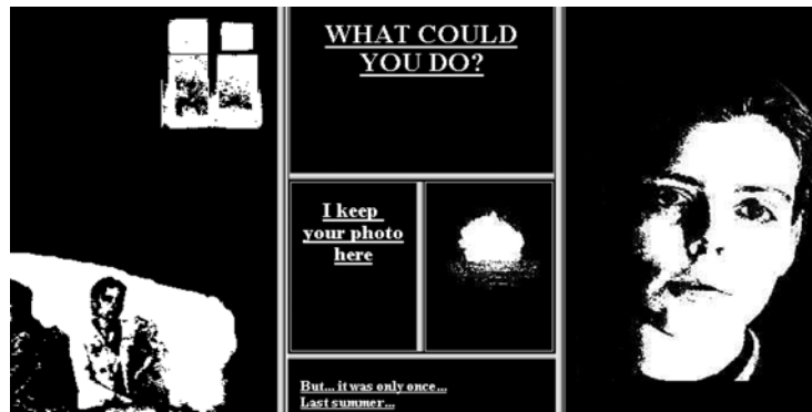
Illustration 1 - Net.art par Olia Lialina

En effet, à côté de cette pratique artistique, c'est tout une culture qui voit le jour, porté par une génération élevée au numérique et baignant dans internet. Le World Wide Web permet de diffuser tout ce que l'on souhaite à qui l'on souhaite. C'est justement grâce à internet que s'est créé une culture du numérique. Dans cet espace virtuel, des codes sont définis sur les moyens de communiquer, de partager, de rechercher, et des incontournables vont se détacher. Que ce soit du Gif, 25 à l'origine simple format de partage d'image, c'est devenu un véritable moyen de communiquer, de partager sur la toile grâce à ses images animées. Il est devenu le format phare de la toile. De même pour les montages créés grâce au logiciel Photoshop 26 qu'il est courant de voir défiler sur de nombreux réseaux sociaux, tout comme les mèmes 27 ou autres images, qui restent des créations numériques le plus souvent amateurs.