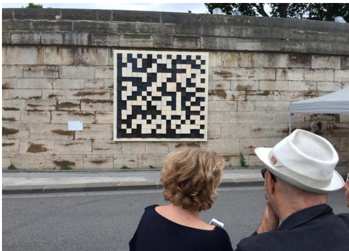
Illustration 21 - Urban Datascape.