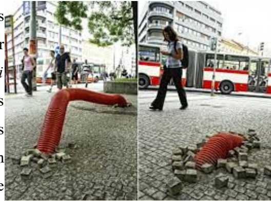
Illustration 13 - Orghoi Khorkhoi .

Les artistes jouent ainsi à conquérir les rues comme sur la toile. Cependant jouer des espaces ne se limite pas au récréatif, certains vont jouer de l'espace public pour interpeller le spectateur, afin que celui-ci ne soit pas passif et se questionne sur l'utilisation qu'est faite de l'espace qui l'entoure. C'est notamment ce que s'amuse à faire Epos 257. L'artiste Epos 257 est originaire de République Tchèque et intervient le plus souvent dans la ville de Prague en jouant avec les éléments urbains pour proposer des installations, des peintures murales ou des performances. Il va par exemple pour son œuvre Orghoi Khorkhoi être inspiré par les travaux ayant lieu dans Prague et modifiant la ville. Il va alors s'approprier des éléments de chantier, un grand tuyaux rouge, qu'il va installer comme si ce dernier sortait du sous-sol de la ville en