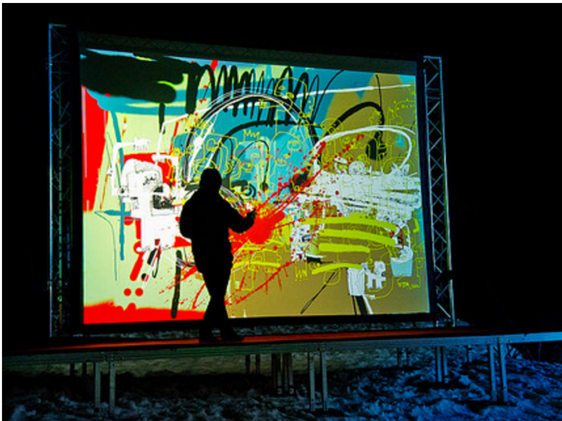
Illustration 23 - projet Picturae.

Water Light Graffiti n'est pas sans rappeler une autre œuvre proposant de créer des tags virtuels : Picturae . L'installation repose sur le même principe, c'est à dire un écran interactif sur lequel le spectateur vient taguer, graffer ou simplement dessiner virtuellement. Le dispositif fonctionne grâce à une fausse bombe de peinture. Cette dernière diffuse une lumière infrarouge qui est capté et qui répond à un récepteur disposé à l'arrière de l'écran. Chaque mouvement de l'utilisateur est interprété et projeté sur l'écran en temps réel. Sur le côté droit de l'écran on retrouve plusieurs fonctions disposés sous la forme d'onglets. Il permet ainsi de sélectionner plusieurs couleurs pour le tracé, de choisir le type de peinture, d'outil ou encore la largeur du tracé. Comme pour l'application pour mobile TouchTag , Picturae semble être une nouvelle version de Paint pensée pour le graffiti, améliorée et perfectionnée pour cette pratique. Développé grâce au logiciel Openframeworks , Picturae propose d'expérimenter « les sensations du réel avec les possibilités infinies du numérique » 119 . Des acteurs de la scène du street art français ont d'ailleurs été invités à venir tester l'installation comme notamment lors d'une présentation au Wip, maison d'artiste et espace d'exposition au sein de La Villette à Paris, durant laquelle