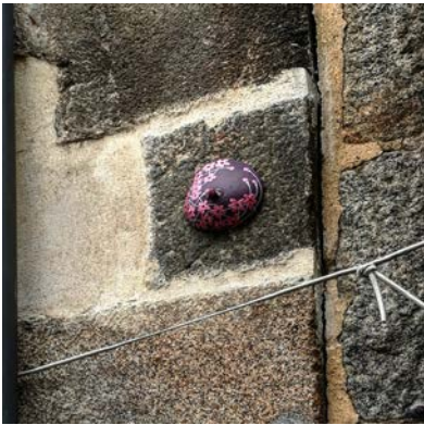
1, rue de la Visitation. 35000 RENNES.