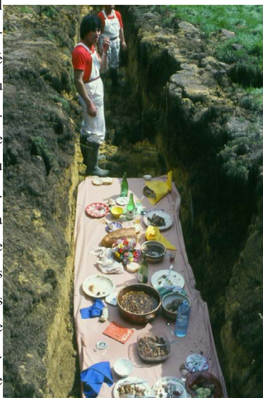
Illustration 27 - L'enterrement du tableau-piège

une œuvre d'art. C'est ce que va faire Daniel Spoerri 156 avec L'enterrement du tableau-piège en 1983, également surnommé « déjeuner sous l'herbe » référence direct au Déjeuner sur l'herbe de Édouard Manet 157 . Pour cette performance il réunit une centaine de ses amis lors d'un dîner dans le parc du Montcel à Jouy-en-Josas, près de Versailles. A la fin de ce repas, les conviés sont invités à disposer les tables, chaises, couverts et même les restes dans une tranchée de 40 mètres. Les artistes ou simples amis présents commencent alors à recouvrir ce qu'il reste de ce moment, travail qui sera fini au bulldozer. Ce n'est qu'en 2010, sous l'impulsion de l'anthropologue Bernard Müller que des fouilles sont entreprises pour mettre à jour