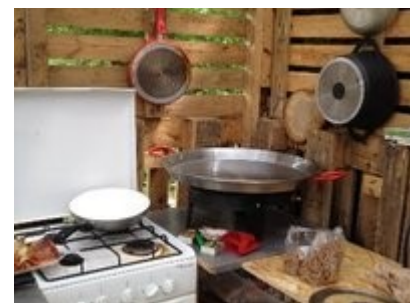
(cf photo ci-contre 32 )