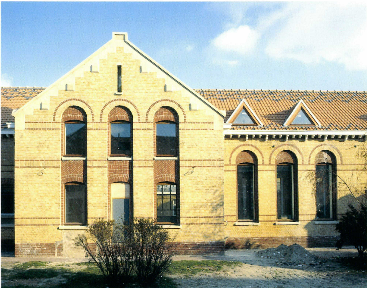
Le FRAC Nord-Pas de Calais à Dunkerque

Du 21 mai au 13 juillet, mon travail a donc consisté à l'étude de ce fonds documentaire et à la rencontre de diverses personnes qui pouvaient apporter leurs conseils, leur expérience, leur professionnalisme à la rédaction de cette étude.