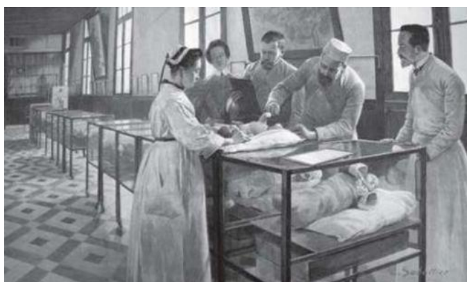
La salle des couveuses pour enfants nouveau-nés (Dessin de L. Sabattier), 2 janvier 1897

Ces débuts de la pédiatrie sont plus ou moins satisfaisants. En effet, «cette forte concentration d'enfants séparés de leur famille entraîne des hospitalismes infectieux et psychologiques» 8 . Comme nous pouvons le voir sur ce dessin, les enfants hospitalisés se retrouvent seuls sans leur parent. Les couveuses fermées des quatre côtés isolent l'enfant de son environnement.