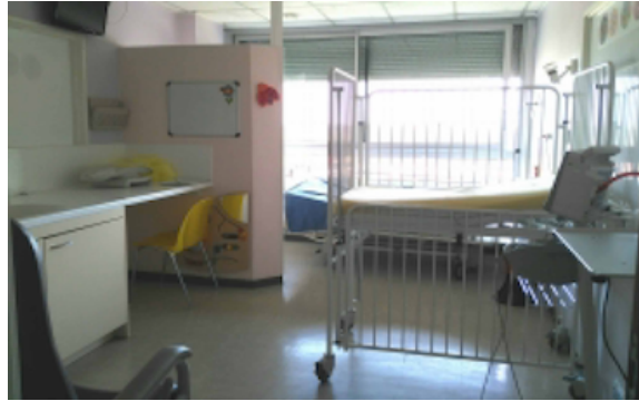
Chambre mère-enfant de notre service

avec sa mère et le monde extérieur. L'objet transitionnel qui peut être symbolisé par le doudou, va permettre de rassurer l'enfant hospitalisé quand le figure d'attachement n'est pas là dans cette situation où il en aurait particulièrement besoin (du fait du stress, de la douleur...).