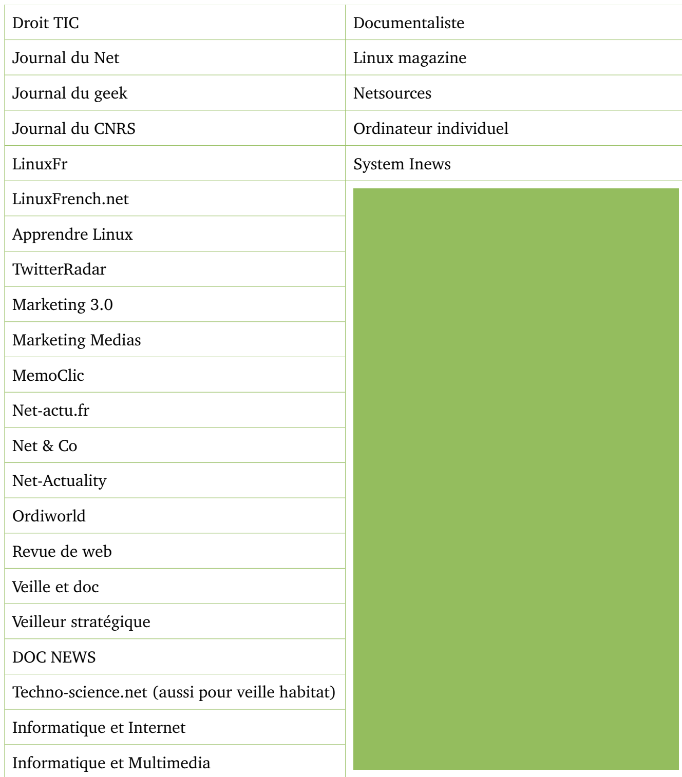
Tableau 1: Sources axe de veille : Nouvelles technologies