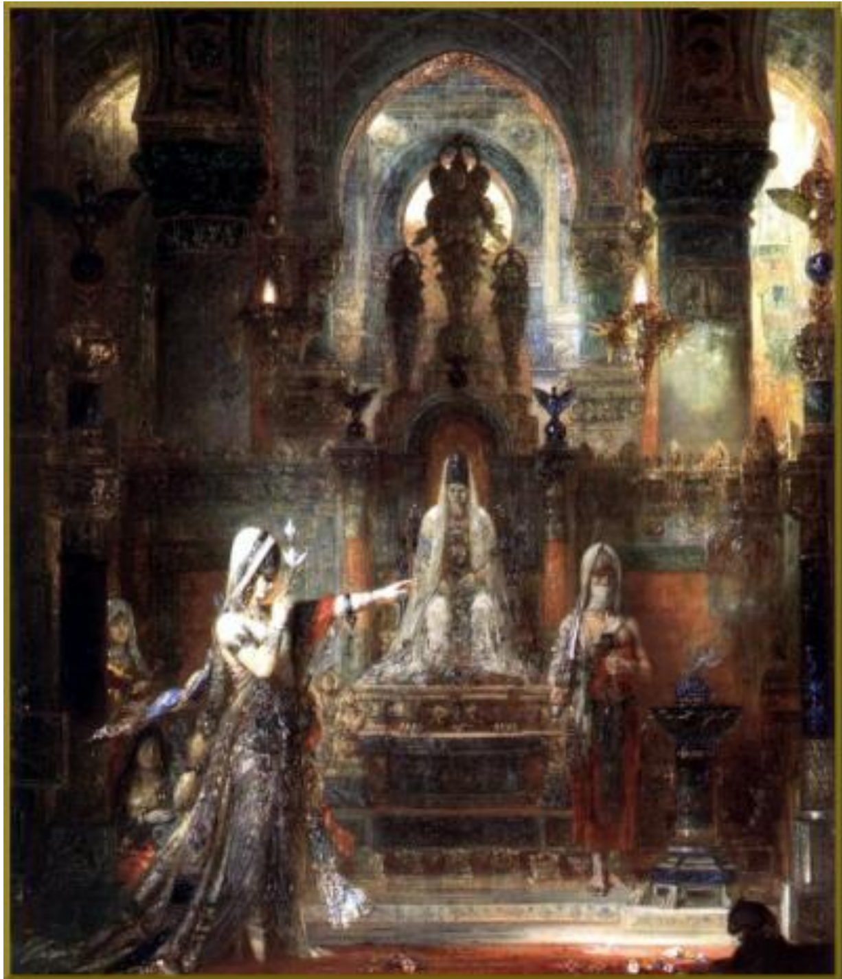
Annexe 1. Gustave Moreau, Salomé , dite Salomé dansant devant Hérode ( Salome Dancing Before Herod ), 1876, Armand Hammer Collection (anciennement Huntington Harford Collection)