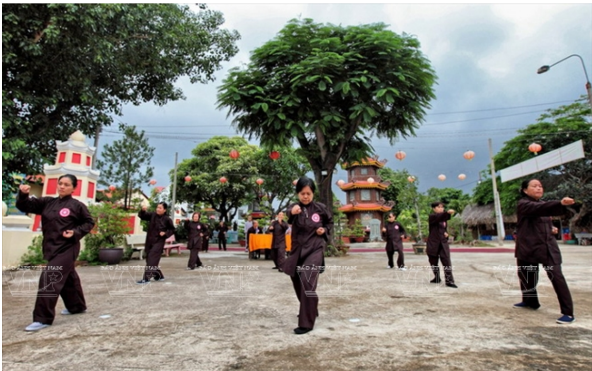
Un cours d'arts martiaux pour personnes âgées au Vietnam.

Un art martial comme médiation en psychomotricité auprès des patients psychotiques vieillissants en résidence médicalisée