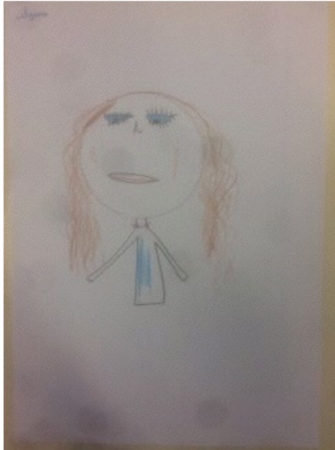
Production de I., 9 ans, classe de CM1, séance sur le portrait.

Productions réalisées lors de la séance sur le « portrait libre » :