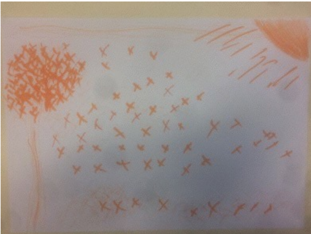
Production de B., 9 ans, classe de CM1, séance sur le paysage monochrome.