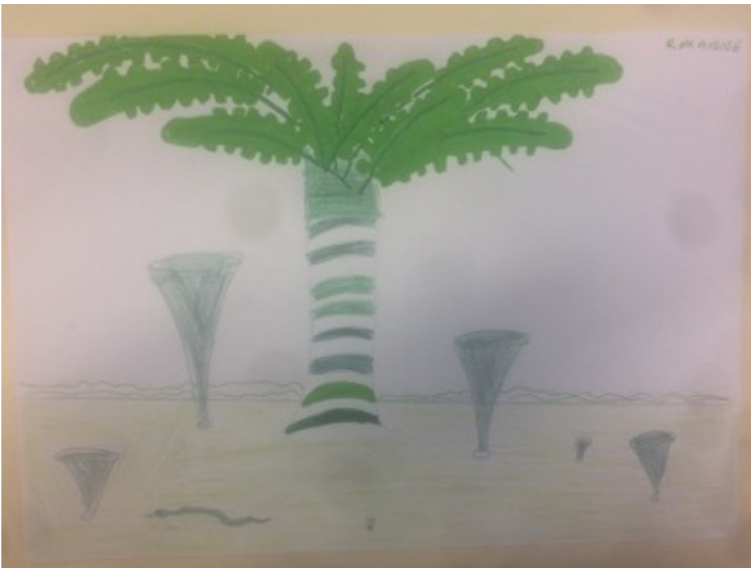
Production de R., 9 ans, classe de CM1, séance sur le paysage monochrome.