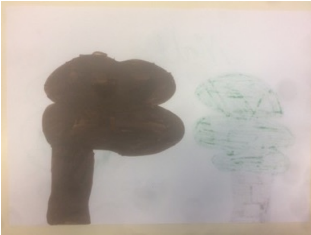
Production de M., 9 ans, classe de CM1, séance sur le paysage monochrome (peu convaincu par sa production.)