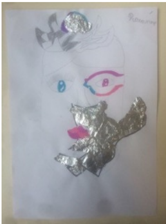
Production de R., 9 ans, classe de CM1, séance sur le portrait après la découverte d'œuvres « anti-réalistes ».

Productions réalisées lors de la deuxième séance sur le portrait (après avoir découvert des œuvres « anti-réalistes ») :