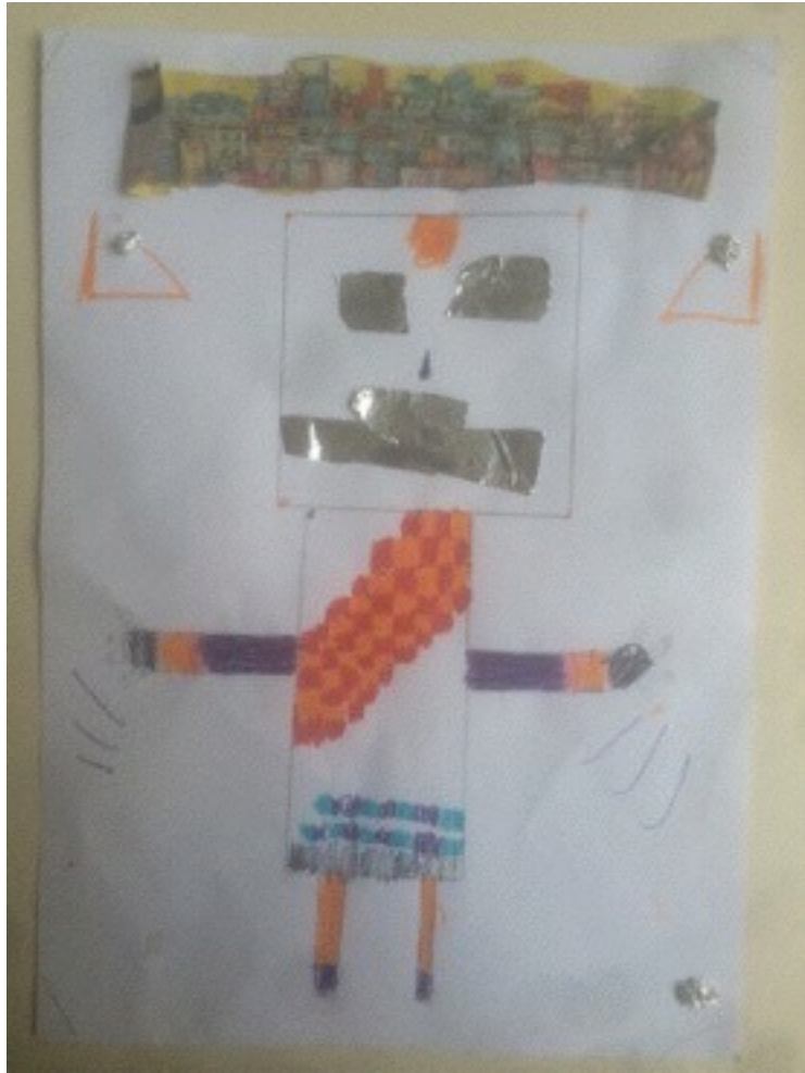
Production de M., 9 ans, classe de CM1, séance sur le portrait après la découverte d'œuvres « anti-réalistes ».