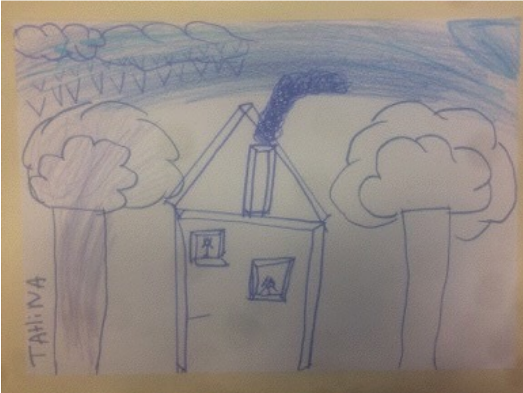
Production de T., 9 ans, classe de CM1, séance sur le paysage monochrome.

Productions réalisées lors de la séance sur les paysages monochromes :