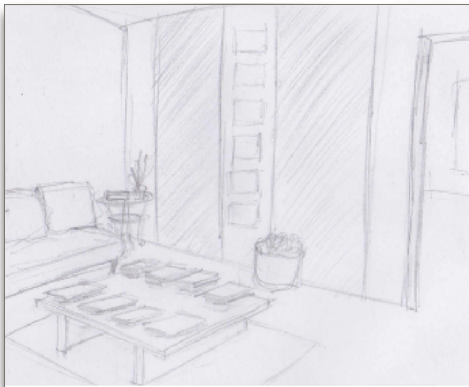
Dessin de la cloison entre la salle d'attente et la salle de psychomotricité (par T. Muia)