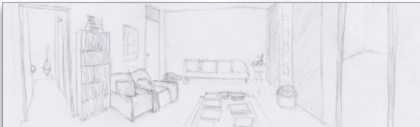
Dessin panoramique dans la salle d'attente (Par T. Muia)