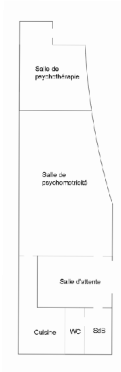
Plan du cabinet libéral après travaux