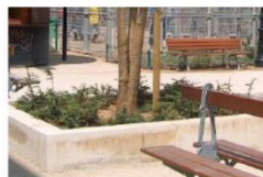
Les pieds des arbres végétalisés

En cas de piétinement, une protection devra être mise en place : grillette de 0.40m de haut.