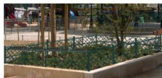
Simulation d'une protection par grillette