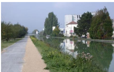
Figure 5 : Bande de stabilisé simple le long du Canal en 2011

Problématique du Stabilisé : On constate un enherbement rapide ( fig. 5 et 6 ) et un fort effet du gel/dégel. On retrouve également une contrainte de confort et d'accessibilité du matériau.