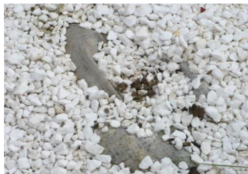
Figure 8 : Double paillage mis en œuvre

Ces deux exemples d'adaptation des techniques de conception mettent tout de même en évidence le souci du bureau d'études de prendre en compte les difficultés de l'entretien. Ce type de démarches laisse présager des perspectives d'évolutions positives entre les services et montrent la capacité du bureau d'études à s'adapter, à savoir remettre en question ses pratiques pour un but commun.