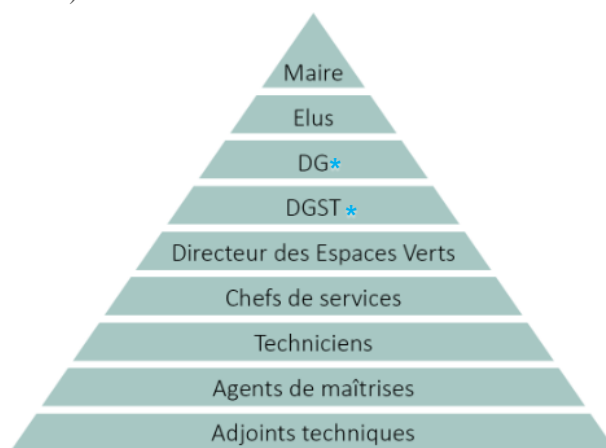
Figure 1 : Schéma simplifié des intervenants décisionnaires dans le cas d'un service espaces verts

Le système d'organisation complexe de la fonction publique implique une prise de décision lente où le poids des élus dans les décisions est très fort. Les orientations sont guidées par des prises de positions politiques. La technique n'est malheureusement pas toujours au centre des débats. Ceci peut être à l'origine d'un sentiment d'impuissance de la part des agents, face à la machine des pouvoirs publics.