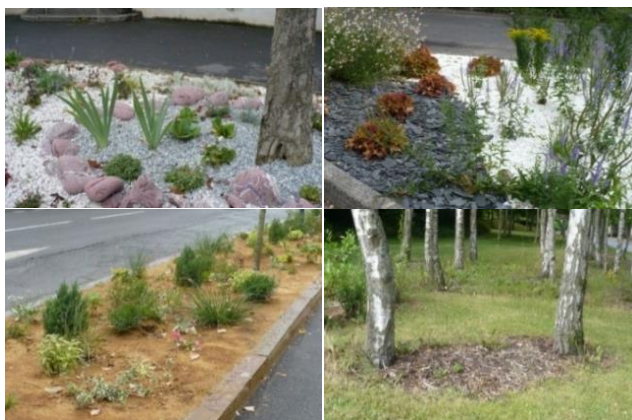
Figure 7 : Type de mulching utilisé en pieds de massifs ou pieds d'arbres

Le bureau d'études a donc proposé la technique du double paillage aujourd'hui appliquée ( fig.8 ) : toile tissée (ou toile biodégradable selon les sites) + paillage (mise en œuvre aujourd'hui de doublage de l'épaisseur de paillage pour augmenter encore l'efficacité du procédé).