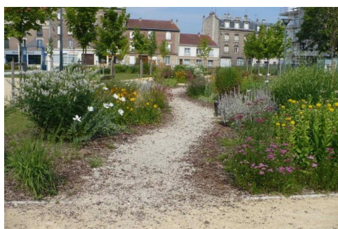
Figure 2 : Photo d'un cheminement à l'inauguration 2009

Ce parc à la structure très recherchée est un bon exemple des limites rencontrées entre la conception et l'entretien. En effet, lorsque l'on compare le site entre l'inauguration et aujourd'hui, on observe une forte évolution entre le plan projet initial et l'état actuel du parc (fig. 2 et 3).