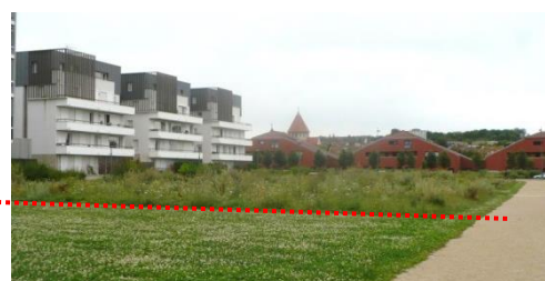
Figure 4 : Rupture de tonte au sein du parc

Ici la problématique soulevée est toujours basée sur un souci de communication. Il s'agit là de perte d'information entre services. On constate une rupture de tonte sur la moitié du parc (fig. 4) ce qui a alors été à l'origine de réclamations. Ceci était effectivement mis en place dans le cadre d'un futur aménagement encore en étude dans cette partie du parc, laissée alors pour le moment en