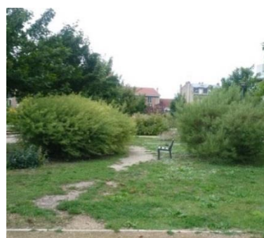
Figure 3 : Photo du cheminement prise en 2017

Dix ans plus tard, en tenant compte de l'intention de projet initial, l'espace donne malheureusement une impression de délaissé malgré le fait qu'il soit entretenu par la Gestion du Patrimoine. Le cheminement en stabilisé n'est pas maintenu et la strate vivace basse d'accompagnement a quasiment disparu. La qualité paysagère souhaitée pour ce parc devient critiquable. Ce genre de situation est typiquement à l'origine de frustration et d'incompréhension de part et d'autre. Chaque service a finalement le sentiment partagé de ne pas voir son travail respecté et ceci contribue de surcroît à renvoyer l'image d'un travail mal fait : pour le bureau d'études, le « non-respect de l'intention de projet » et « un entretien toujours au plus facile quitte à en perdre en qualité ». Du côté de l'entretien « des projets démesurés réalisés par un bureau d'études totalement déconnecté de la réalité de terrain et de ces contraintes ». Ceci soulève la question de la pertinence de la démarche paysagère et la nécessité de communication entre les services pour éviter de créer des situations conflictuelles.