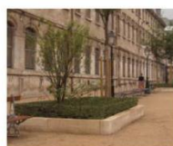
Simulation du plateau taillé de Lonicera