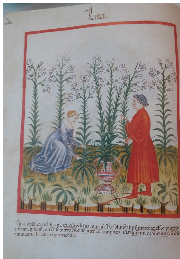
Fig. 1 Illustration du lis dans un Tacuinum sanitatis , fin du XIV e siècle, codex Vindobonensis series nova 2644, fol. 38v

La première illustration (Fig.1) est issue d'un manuscrit daté de la fin du XIV e siècle, reprenant des propos du Tacuinum Sanitatis , qui a été reproduit par Daniel Poirion et Claude Thomasset dans L'Art de vivre au Moyen Âge 113 , ouvrage dans lequel Daniel Poirion compose une introduction extrêmement claire et instructive. Il précise que cet ouvrage reflète les intérêts de la bourgeoisie italienne en quête d'informations médicales, pour être beau et en bonne santé, et à la recherche d'objets précieux dont l'art suscite l'émerveillement. En effet,