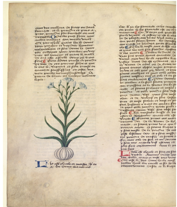
Fig.2 Livre des simples médecines , 1401-1500, Bibliothèque nationale de France, Département des manuscrits, Français 623, fol.108v

L'illustration suivante (Fig.2) est empruntée à un manuscrit du Livre des simples médecines datant du XV e siècle. L'image est située avant le texte, le séparant du chapitre précédent, et facilitant le repérage du chapitre qui traite du lis. En plus de sa fonction démarcative, l'image propose une représentation de la description dans le texte au sujet du lis blanc, ou domestique . Nous retrouvons les fleurs blanches, les bourgeons et la grande tige de la (Fig.1), mais les feuilles sont plus proéminentes et le bulbe est bien visible. Ce dernier n'est pas enterré. Il n'y a aucun décor, aucune scène qui pourrait distraire et annoncer un contexte culturel. L'image renvoie uniquement aux informations botaniques, ce qui laisse penser que le manuscrit a été commandé dans un seul intérêt