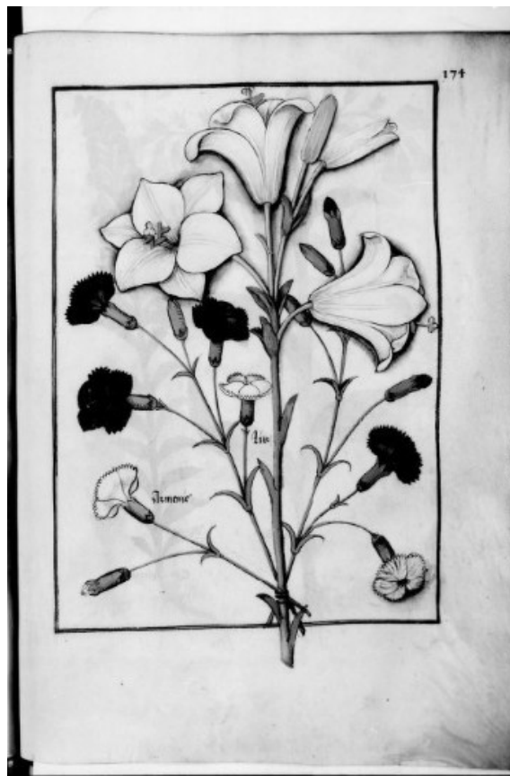
Fig.3 Livre des simples médecines, ou Herboriste , 1501-1600, Bibliothèque nationale de France, Département des manuscrits, Français 12322 , fol. 174

Un siècle plus tard, dans un autre manuscrit du Livre des simples médecines , un lis (Fig.3) est illustré en fin d'ouvrage avec une autre plante qui semble être un œillet. Les fleurs du lis sont mises en valeur au centre d'un bouquet très ample. Nous retrouvons quelques détails botaniques, notamment au niveau du haut de la fleur dessinée sous différents angles, ce qui indique une étude visuelle de la véritable plante qui paraît de façon un peu plus réaliste que dans les représentations précédentes. Cette image expose les multiples formes des pétales au cours du développement de la fleur, du bourgeon jusqu'à l'aspect le plus épanoui, avec encore plus de précision que dans la (Fig.1). Il se serait possible d'imaginer l'éclosion de la fleur. Grâce aux ombrages et à la finesse de certains traits, il est possible de deviner la texture des pétales et la rigidité de la tige. La partie inférieure de la plante est absente, comme si elle était de peu d'intérêt artistique et informatif alors que des