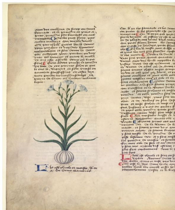
Fig.2 Livre des simples médecines , 1401-1500, Bibliothèque nationale de France, Département des manuscrits, Français 623, fol.108v

L'illustration suivante (Fig.2) est empruntée à un manuscrit du Livre des simples médecines datant du XV e siècle. L'image est située avant le texte, le séparant du chapitre précédent, et facilitant le repérage du chapitre qui traite du lis. En plus de sa fonction démarcative, l'image propose une représentation de la description dans le texte au sujet du lis blanc, ou domestique . Nous retrouvons les fleurs blanches, les bourgeons et la grande tige de la (Fig.1), mais les feuilles sont plus proéminentes et le bulbe est bien visible. Ce dernier n'est pas enterré. Il n'y a aucun décor, aucune scène qui pourrait distraire et annoncer un contexte culturel. L'image renvoie uniquement aux informations botaniques, ce qui laisse penser que le manuscrit a été commandé dans un seul intérêt