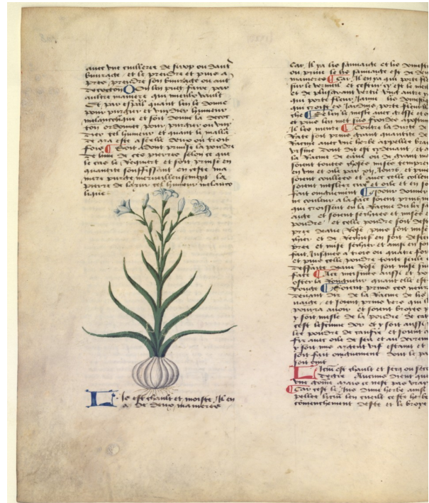
Fig.2 Livre des simples médecines , 1401-1500, Bibliothèque nationale de France, Département des manuscrits, Français 623, fol.108v

L'illustration suivante (Fig.2) est empruntée à un manuscrit du Livre des simples médecines datant du XV e siècle. L'image est située avant le texte, le séparant du chapitre précédent, et facilitant le repérage du chapitre qui traite du lis. En plus de sa fonction démarcative, l'image propose une représentation de la description dans le texte au sujet du lis blanc, ou domestique . Nous retrouvons les fleurs blanches, les bourgeons et la grande tige de la (Fig.1), mais les feuilles sont plus proéminentes et le bulbe est bien visible. Ce dernier n'est pas enterré. Il n'y a aucun décor, aucune scène qui pourrait distraire et annoncer un contexte culturel. L'image renvoie uniquement aux informations botaniques, ce qui laisse penser que le manuscrit a été commandé dans un seul intérêt