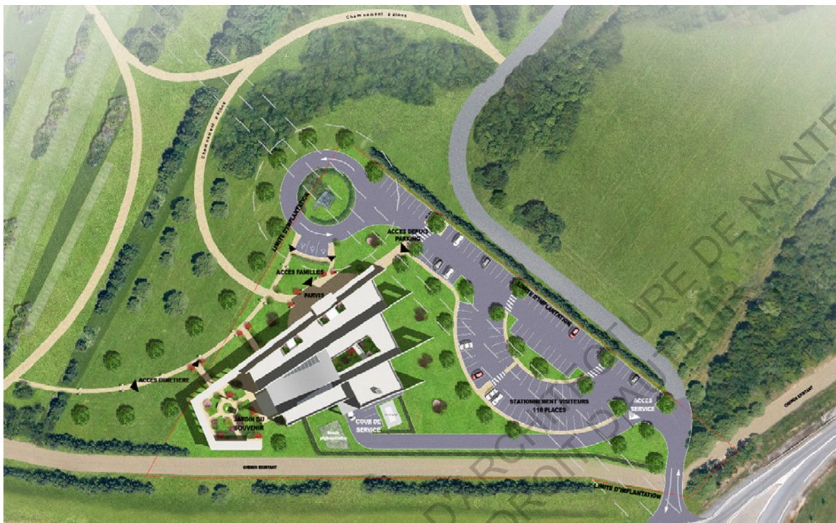
Plan masse du futur crématorium à Saint-Jean-de-Boiseau