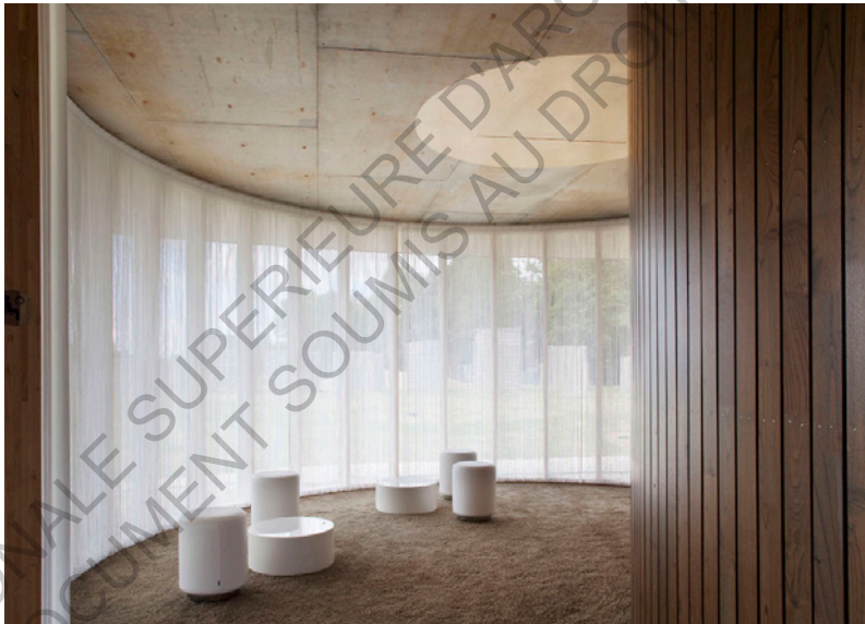
L'espace d'attente des familles