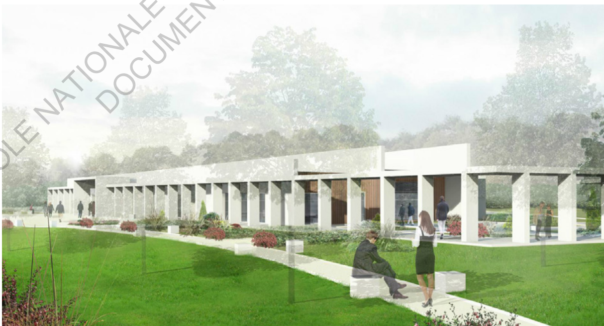
Perspective du futur crématorium de Saint-Jean-de-Boiseau depuis le cimetière

Le projet est apprécié par la maîtrise d'ouvrage pour ses « gestes architecturaux forts (coursives, galerie) [...] avec des matériaux caractérisant des équipements publics (béton blanc, bois, ...) ».