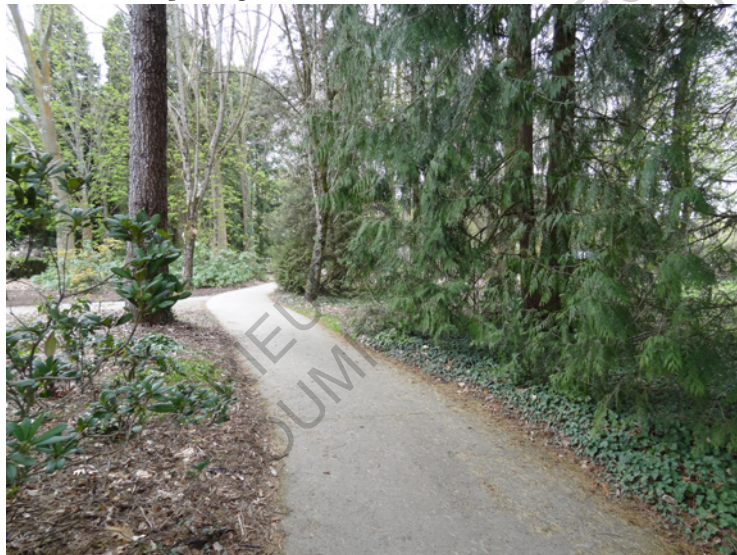
Le chemin piéton d'accès au crématorium