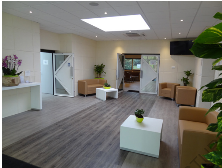
Vue intérieure du nouveau hall d'accueil du crématorium