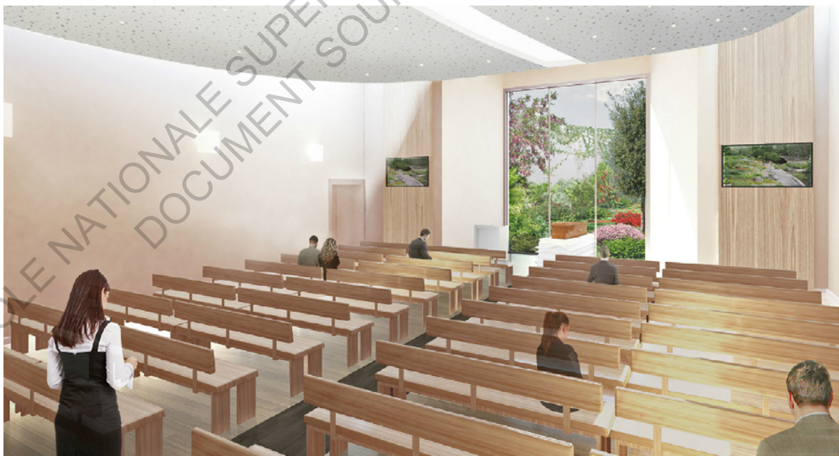
Salle de cérémonie du futur crématorium à Saint-Jean-de-Boiseau