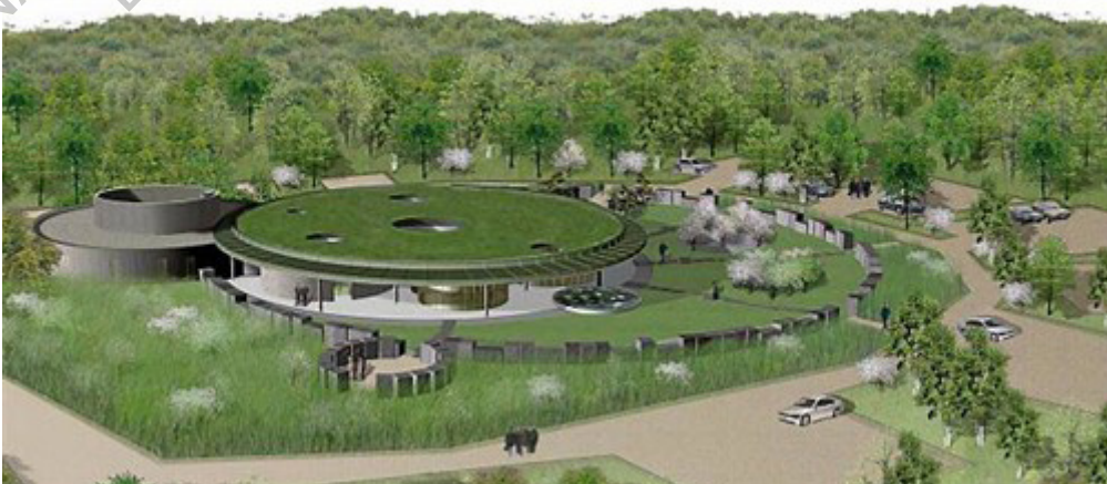
Extérieur du crématorium de Rennes Métropole