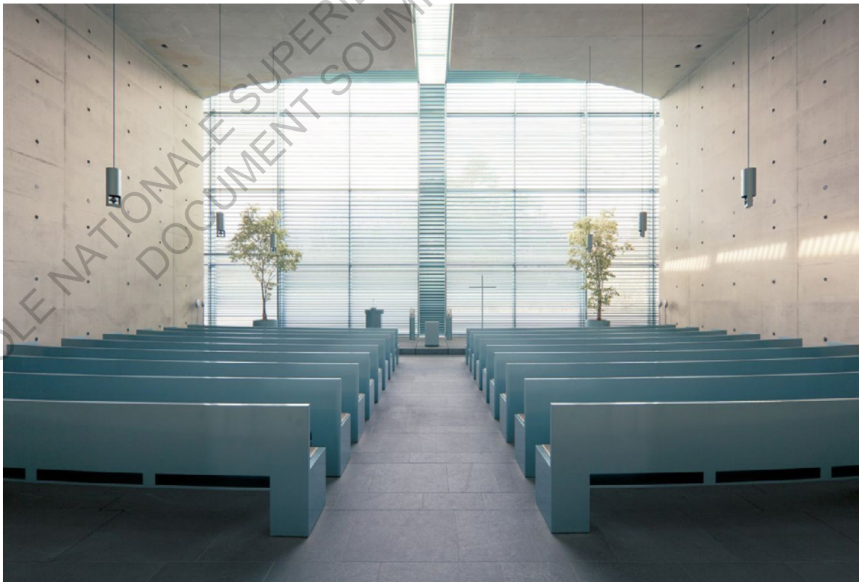
L'intérieur d'une des salles de cérémonie du Treptow crematorium de Berlin

Le Treptow crematorium de Berlin a, entre autres, été également publié sur ArchDaily en 2013 où il était décrit comme une architecture qui « glorifies the quintessence of architecture, celebrates space, the silence of walls in light » (glorifie la quintessence de l'architecture, célèbre l'espace et le silence des murs sous la lumière).