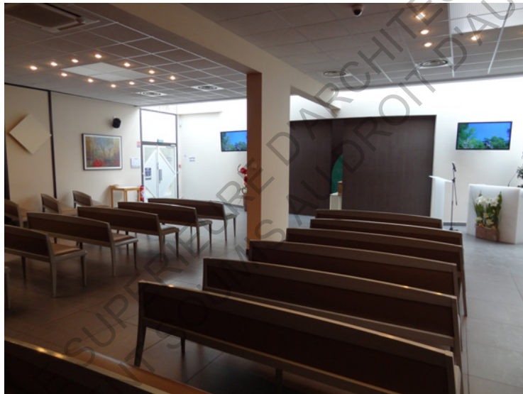
La salle de cérémonie du crématorium