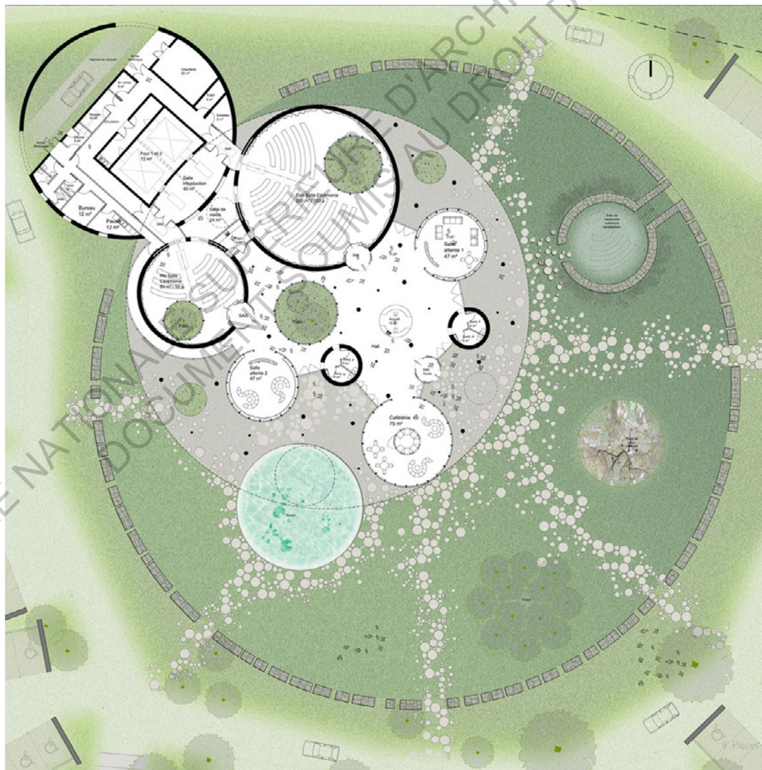
Plan masse du crématorium de Rennes Métropole

La périphérie est largement plantée de grands arbres créant un filtre visuel entre le bâtiment et son environnement urbain qui assure l'intimité des familles et fonde l'équipement dans la masse végétale du bois existant.