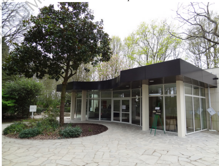
Vue extérieure du nouveau hall d'accueil du crématorium