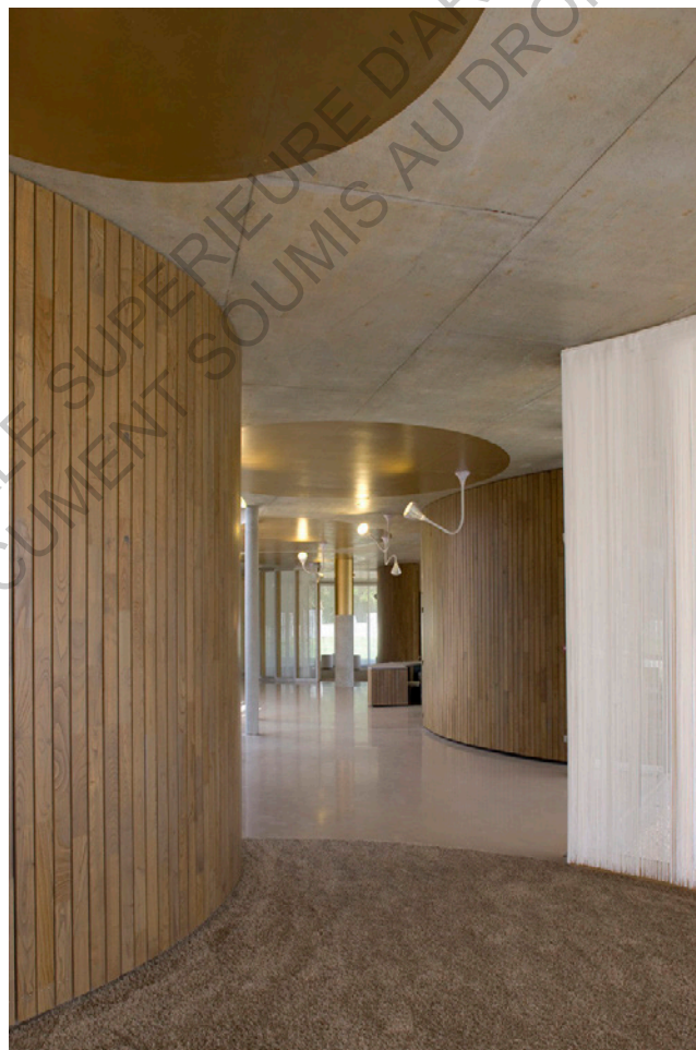
Le hall de déambulation

Enfin, le projet a été récompensé en devenant lauréat du Prix Spécial d'Architecture de Bretagne en 2010 et en étant nommé au Prix Mies van der Rohe de 2011.