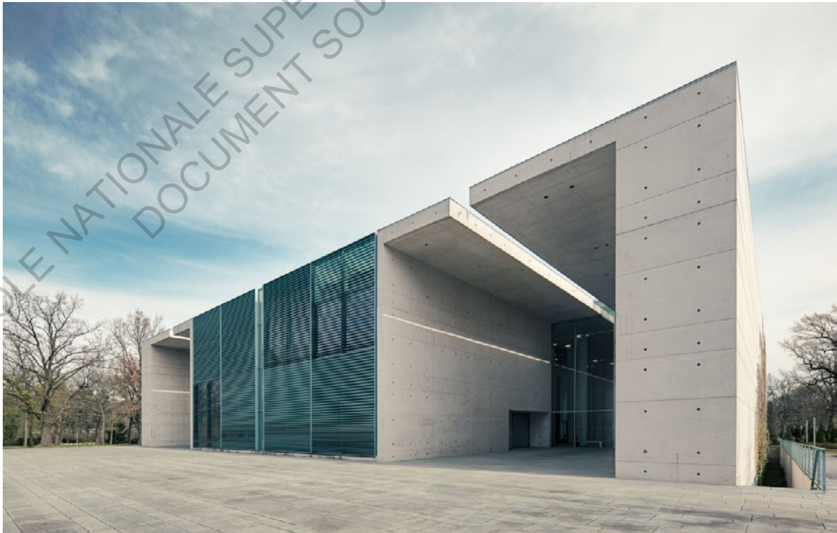
L'extérieur du Treptow crematorium de Berlin

Cette construction funéraire s'intègre dans le tissu urbain de la ville, sur une parcelle de 9339m 2 , et vient remplacer l'ancien crématorium de la ville qui datait de 1912. Il est donc connecté au bouillonnement constant d'une ville moderne et doit s'affirmer en tant que bâtiment public, utilisable par tous.