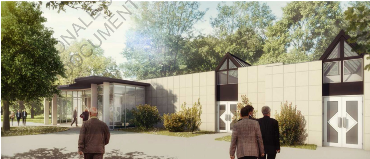
Perspective des transformations du crématorium de Nantes