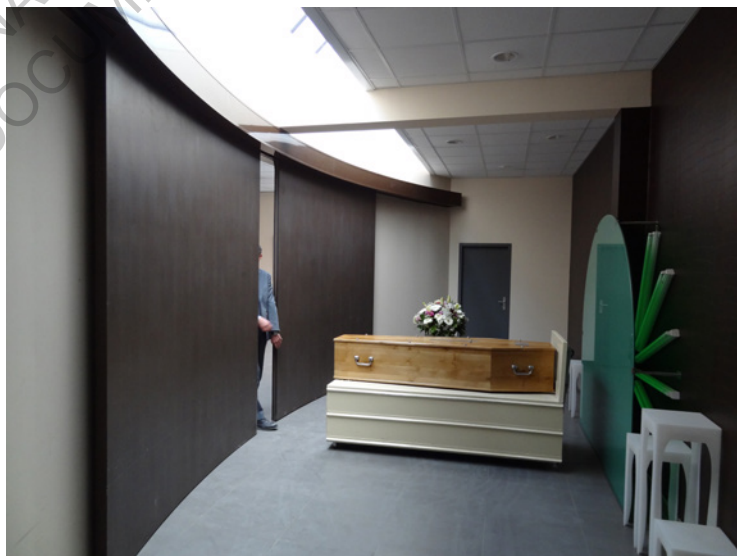
L'alcôve présentant le cercueil aux familles pendant la cérémonie