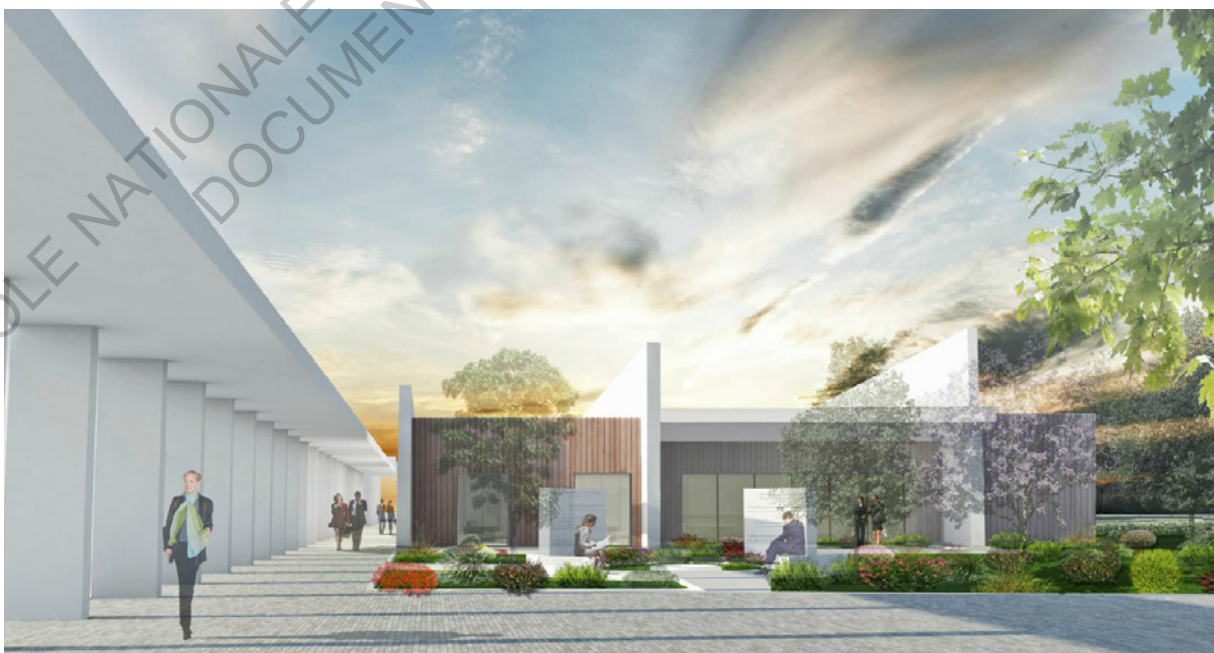
Perspective du futur crématorium de Saint-Jean-de-Boiseau depuis le jardin du souvenir

A partir de là, le développement du projet peut être analysé.