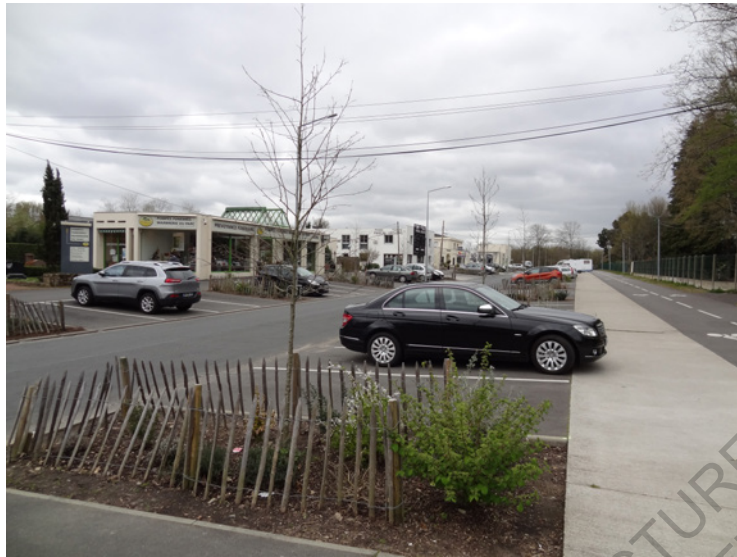
Le parking du crématorium et du cimetière Parc de Nantes