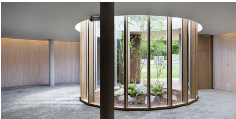
Un des patios