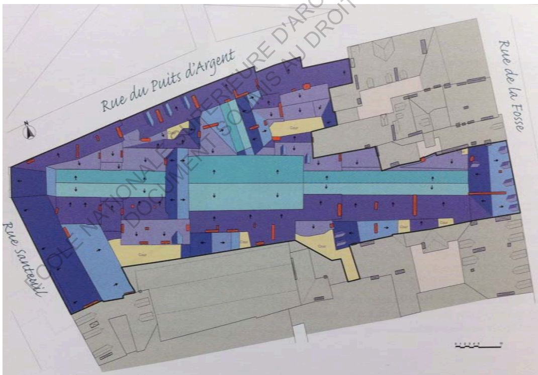
Plan de toiture de la copropriété