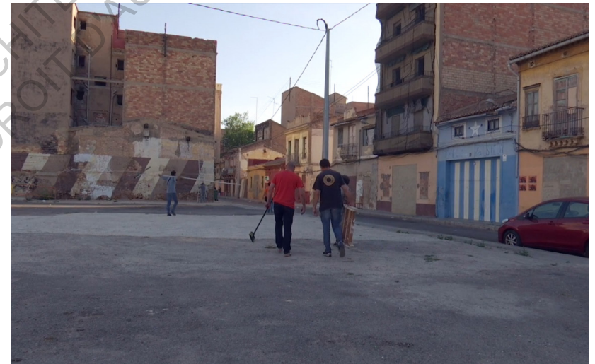
Placette sauvage, jonction informelle entre l'Avigunda Blasco Ibañez et la Carrer de les Pescadores. Capture d'écran du reportage «Stop. We are here» de Frédérique Pressmann, 2015

La placette de goudron, terrain de foot improvisé, évite les détours pour aller à la plage. Entre deux pignons recouverts de polyuréthane orange, l'espace est le fantôme de trois habitations. Elle représente bien cette partie du quartier, où les espaces vides sont nombreux, détonnants parmi la promiscuité générale. Sur les murs de clôture, sur les fonds de parcelle des dents creuses, un motif revient. De grandes