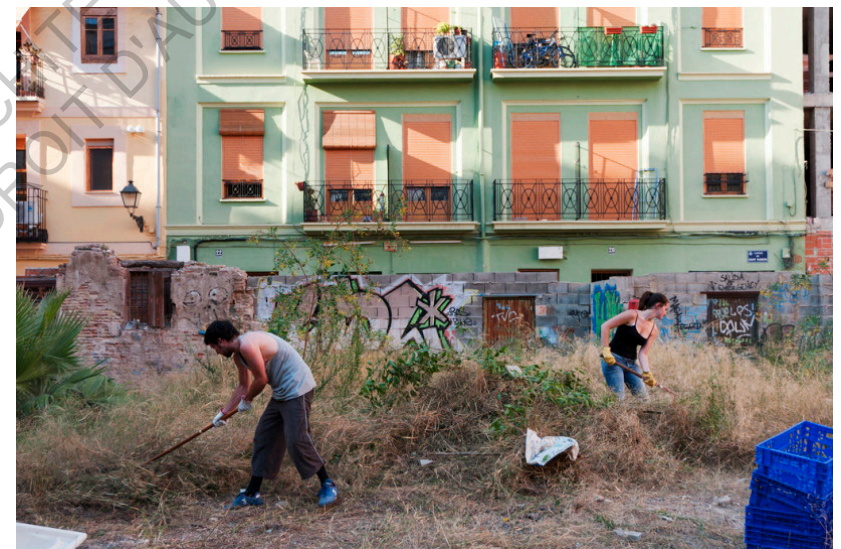
Solar Corona : Aménagement du site par les bénévoles. Collectif EspaiMGR, 2011

Okupa trouve de l'ampleur après les manifestations du 15-M (15 mai 2011). Le mouvement contestataire, organisé par los Indignados, critique les mesures d'austérité du gouvernement Zapatero (PSOE) ainsi que le système capitaliste responsable de la crise sociale. L'événement crée une dynamique, dont naîtra en 2014 Podemos, un parti politique social et citoyen, moteur du renouveau politique espagnol.