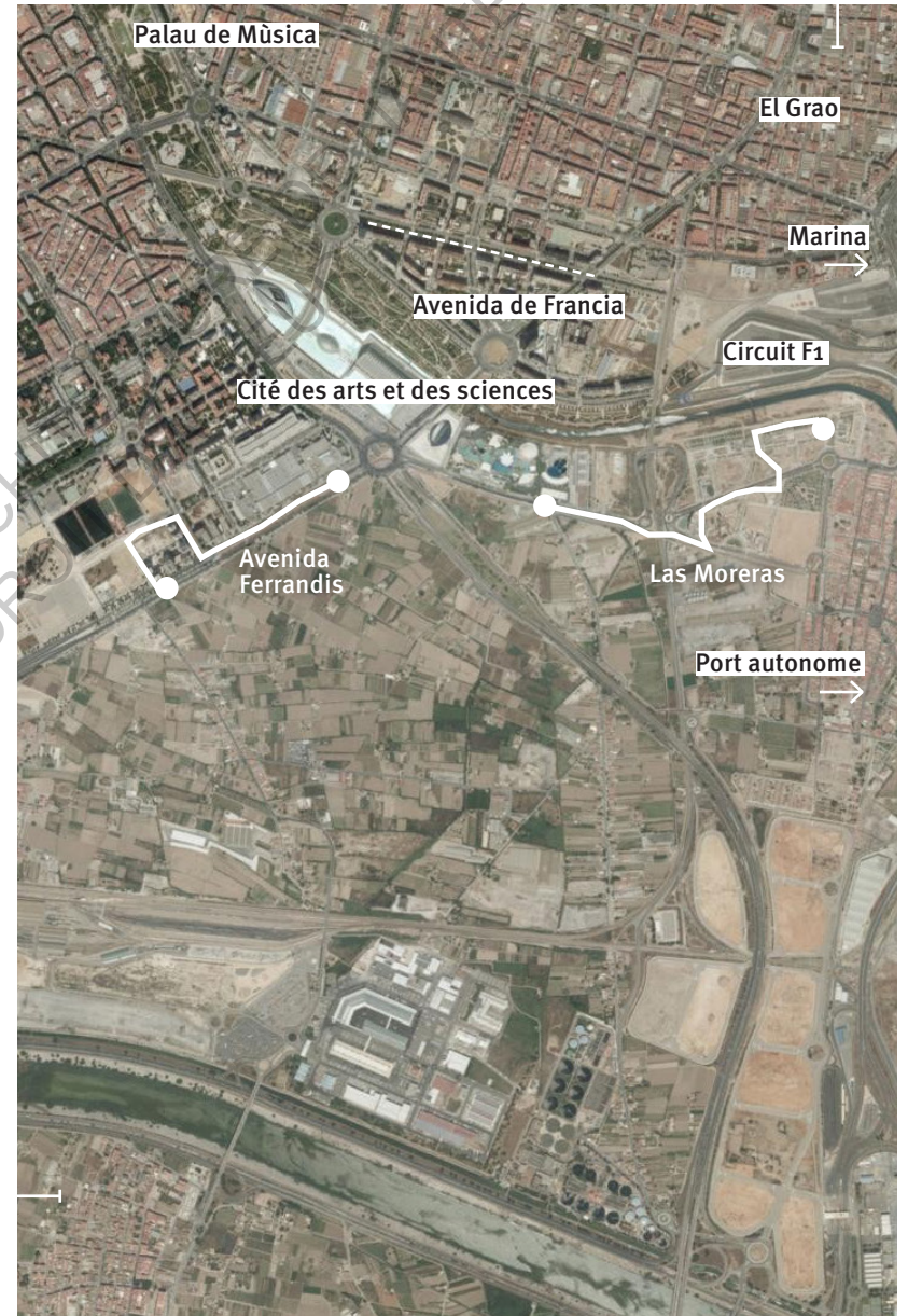
Photographie aérienne de l'agglomération de Valence - Institut Cartogràfic Valencià, 2012