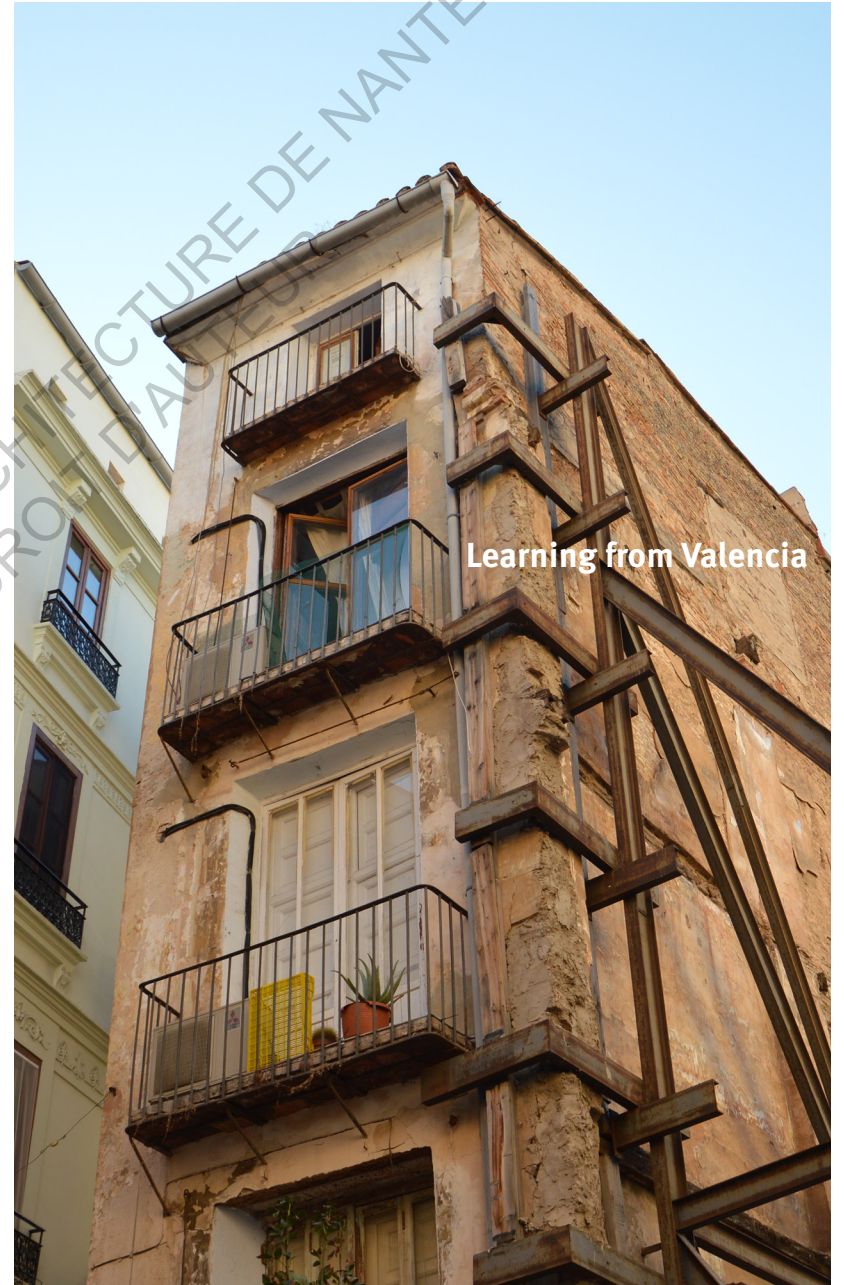
Learning from Valencia

ECOLE NATIONALE SUPERIEURE D'ARCHITECTURE DE NANTES DOCUMENT SOUMIS AU DROIT D'ACCES