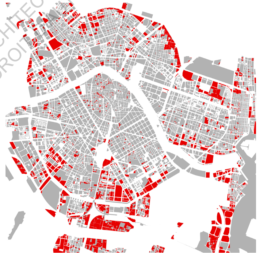
Terrains vagues de Valence, relevé non exhaustif - Pau Ginés, architecte, 2011

La dimension multiple du pays est à la fois source et conséquence d'un système politique qui favorise l'échelle régionale, celles des Comunidades autonaumas (Communautés Autonomes), vestiges territoriaux d'anciens royaumes. Chaque communauté autonome, que nous pourrions comparer en terme d'échelle aux régions françaises, dispose d'un parlement, d'un pouvoir législatif et de compétences propres.