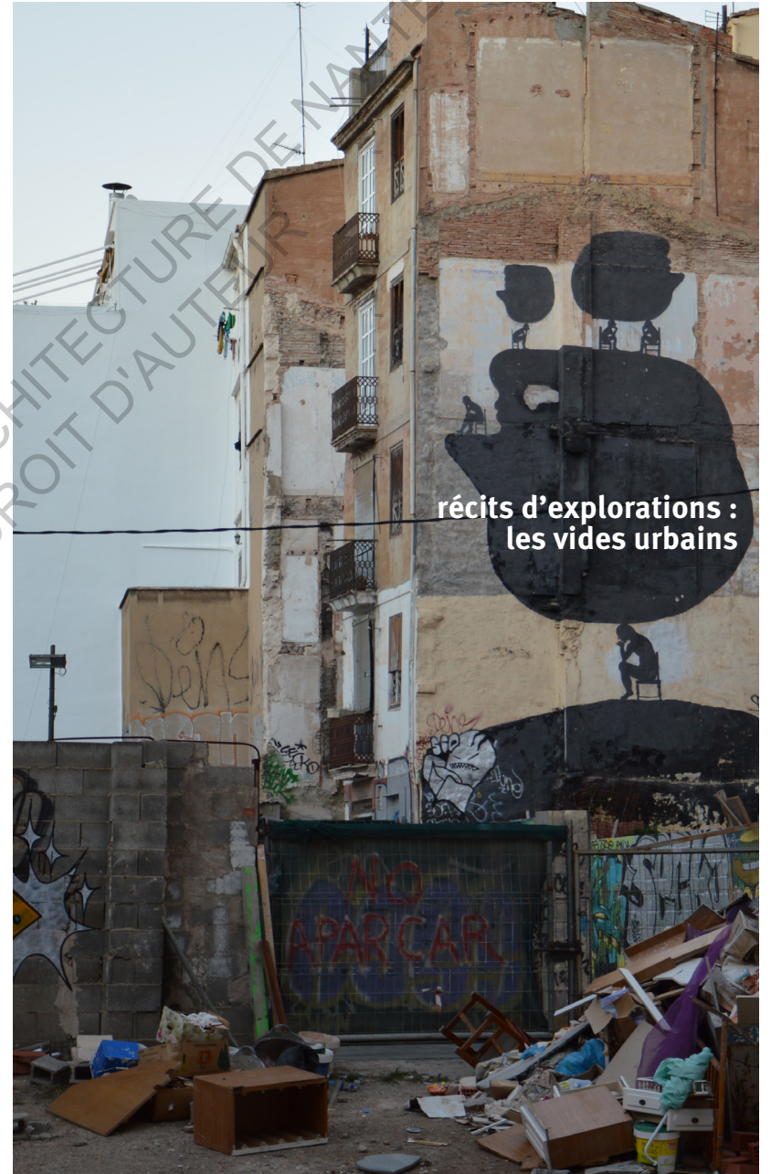
récits d'explorations : les vides urbains

ECOLE NATIONALE SUPERIEURE D'ARCHITECTURE DE NANTES DOCUMENT SOUMIS AU DROIT D'AUTEUR