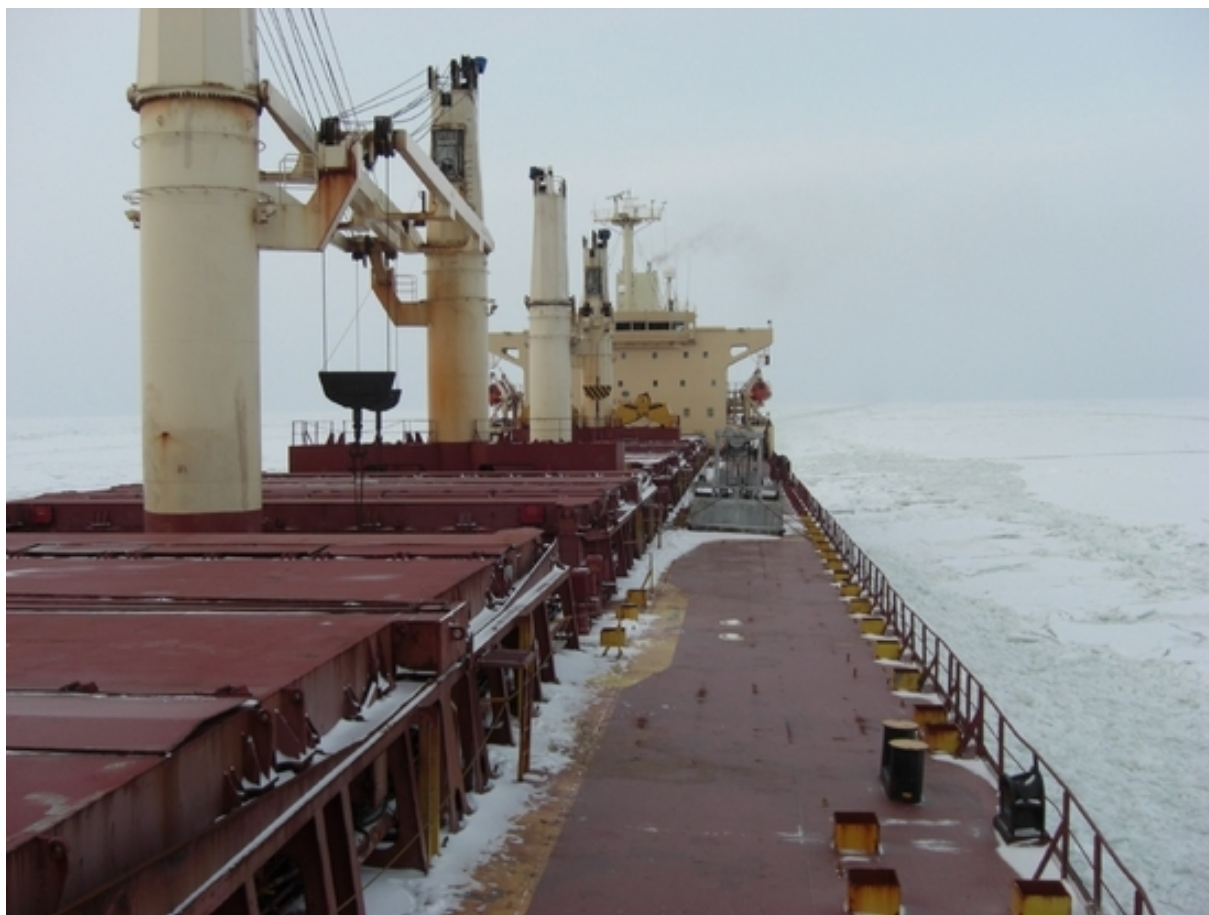
Mv Nordic Barents