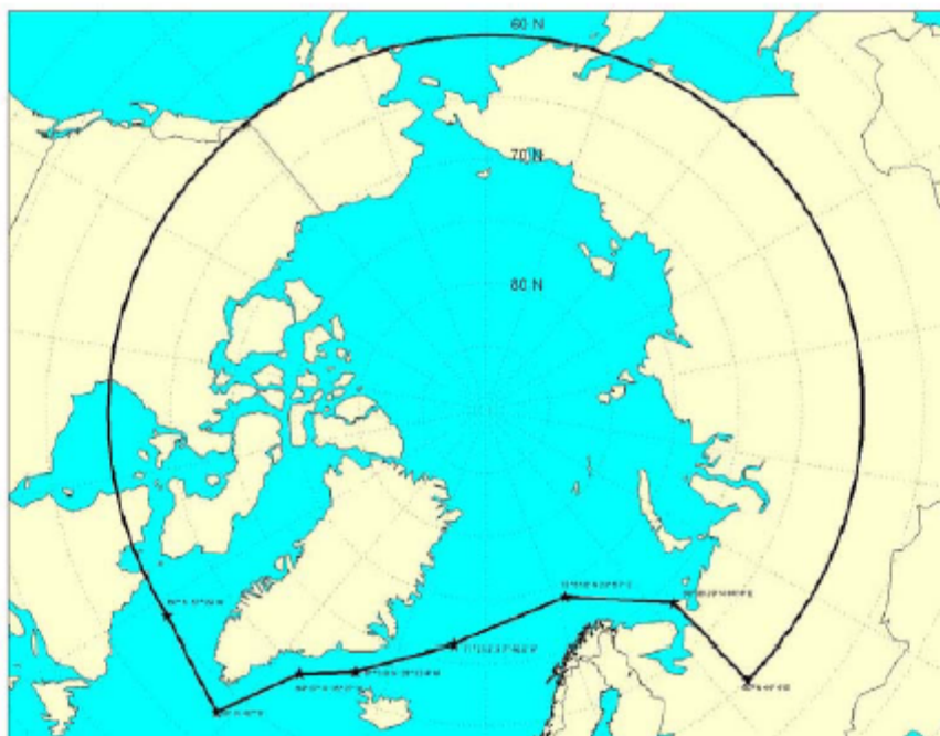
Figure 1 - Limite maximale d'application - eaux arctiques (voir le paragraphe G-3.3) 2