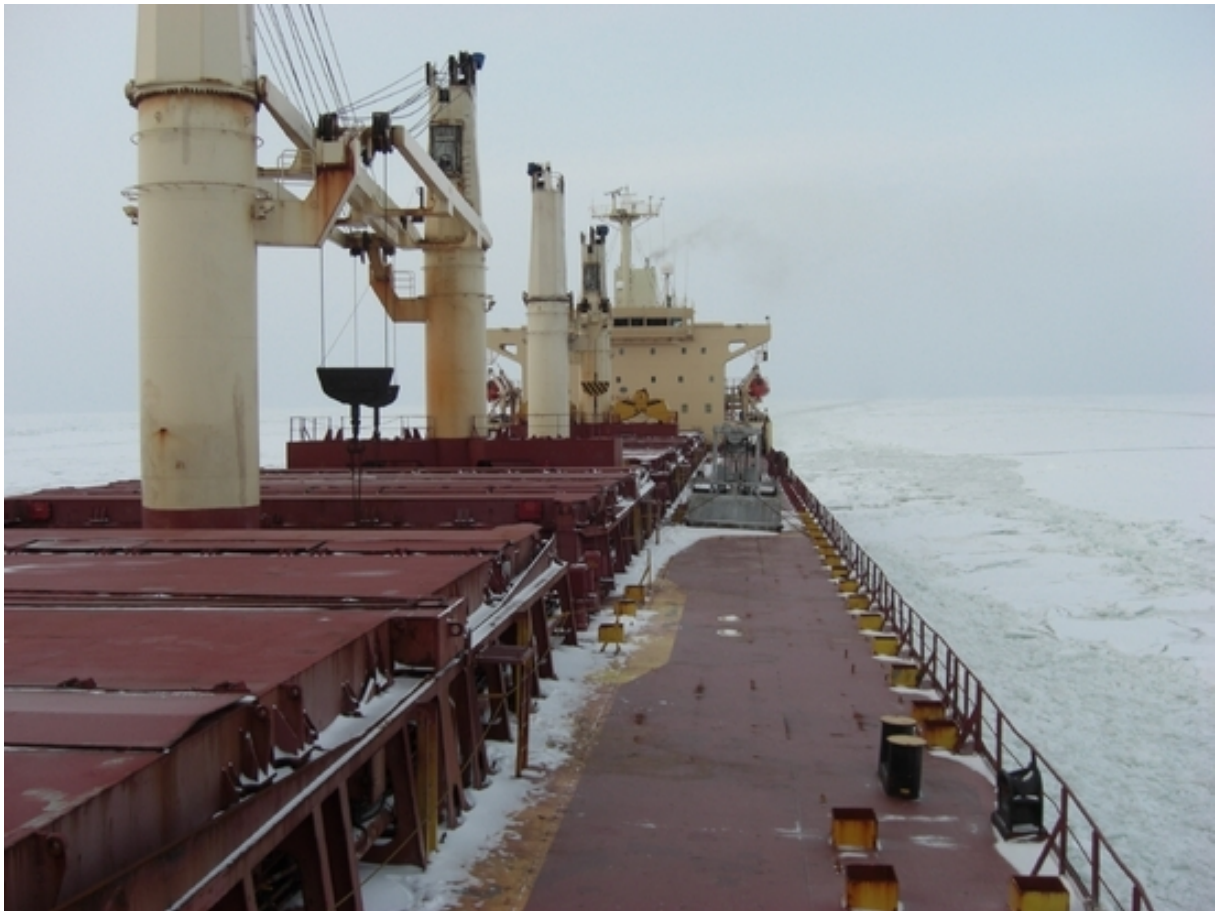
Mv Nordic Barents