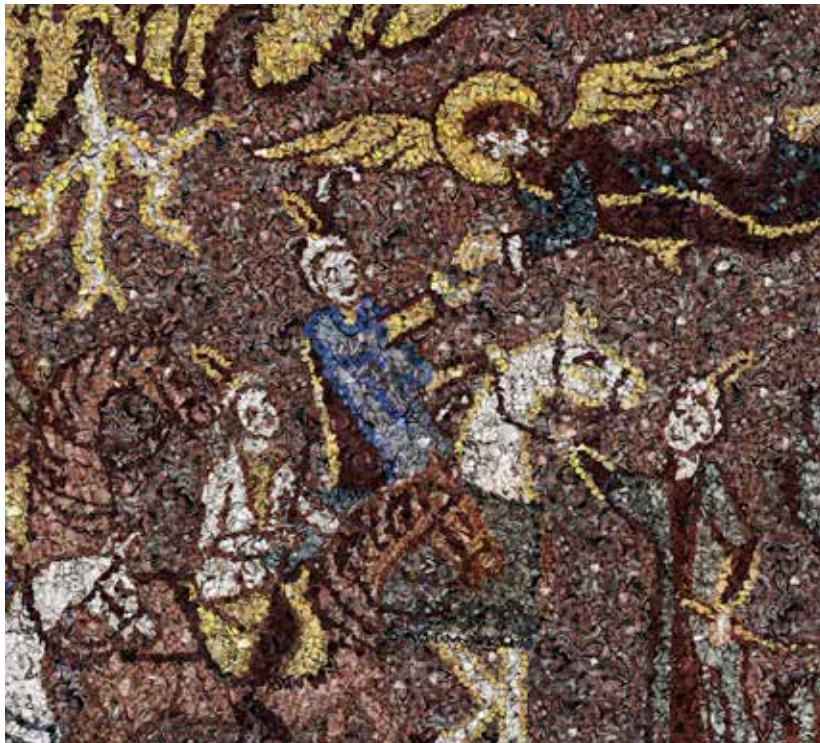
Gros plan du Tapis-Papillons Jean-François Rauzier

Mon modèle, le patron du tapis, se trouvait sous un calque gris à moitié transparent, ce qui me permettait de le deviner sans qu'il me gêne pour le recouvrement papillonnaire. Il ne me restait plus qu'à les positionner. Je devais donc d'abord « tracer » les lignes, en ajustant la taille des papillons, et ensuite remplir les différents aplats. Pour cette dernière étape, je m'étais fait en plus des papillons individuels, des blocs uniformes dans lesquels je pouvais venir découper les formes des aplats.