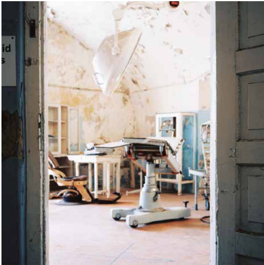
Intérieur d'une prison au Kazakhstan Claire Grumellon