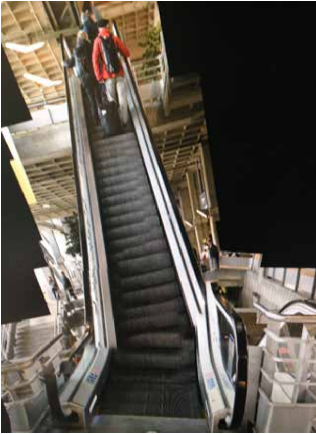
Escalator avant et après détournage