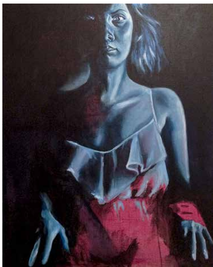
Séjours Romains #1 et 5 Acrylique sur toile 61 x 50 cm 2016-17