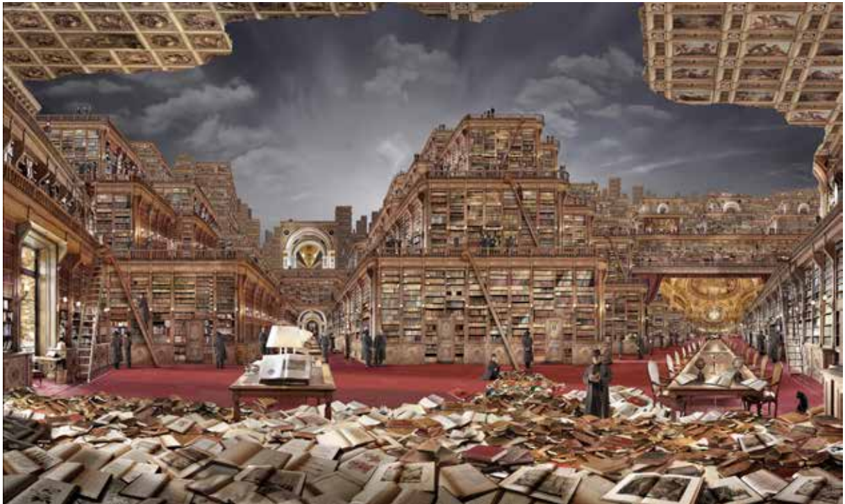
Bibliothèque Idéale, le Sénat Jean-François Rauzier