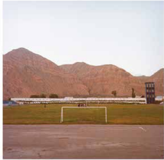
Vue du Kazakhstan Claire Grumellon