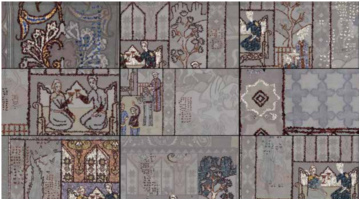
Capture d'écran de la vidéo Jean-François Rauzier

Il a fallu trouver les astuces pour que le logiciel accepte deux vidéos de formats complètement différents. Pour les rushes du mac la chose était facile : l'enregistrement a été fait en qualité 4k soit 32000 x 18000 pixels, en le découpant en 9 écrans on obtient ainsi 9 écrans au format 16/9, ce qui était parfait pour le transposer sur des écrans de télévision. Pour les rushes réalisés sur le PC, il a fallu tous les re-découper et les exporter en vidéos autonomes pour ensuite les réintégrer dans un nouveau dossier de montage.