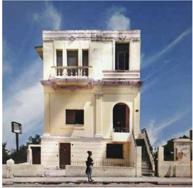
Maison cubaine avant détourage Image finale d'une maison cubaine