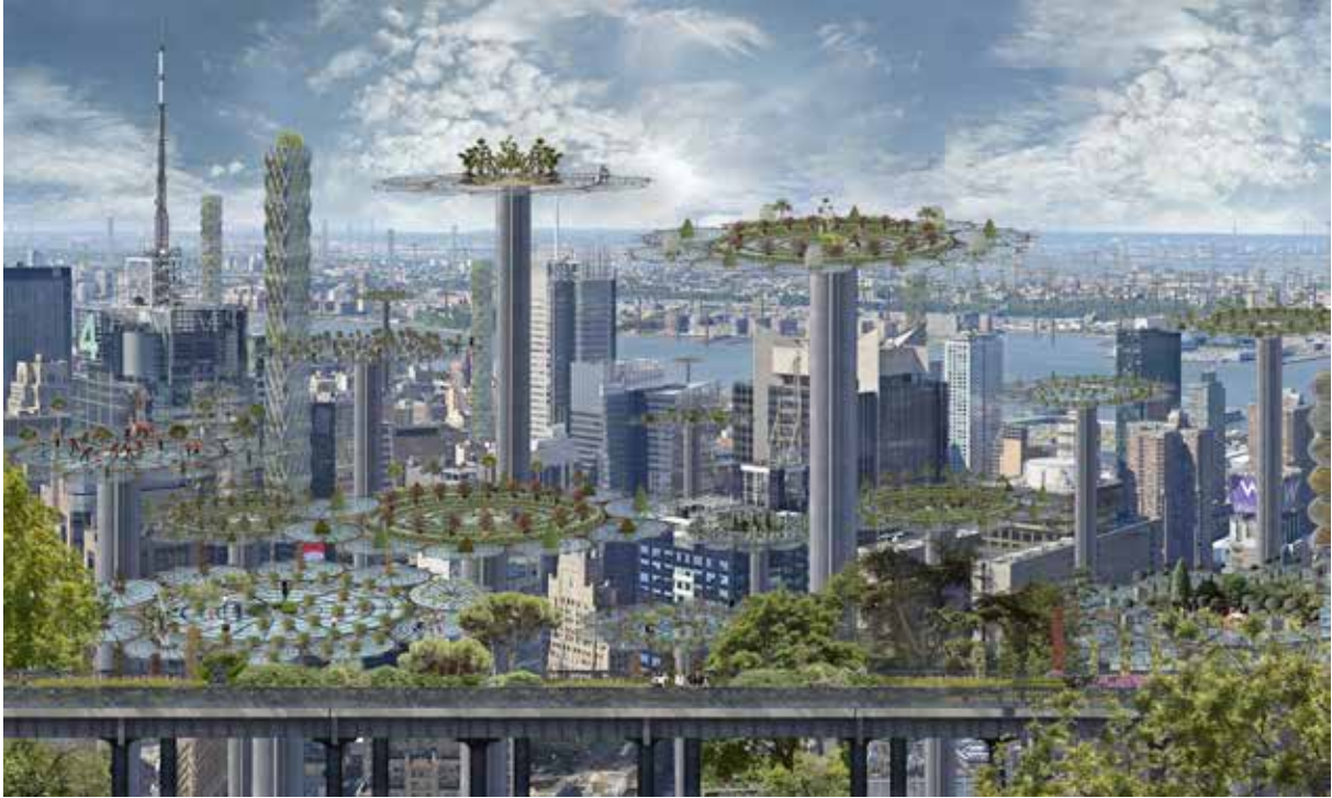
Ci dessus : Manhattan Farms , Dessous : La tour de Babel d'après Joos de Momper Jean-François Rauzier