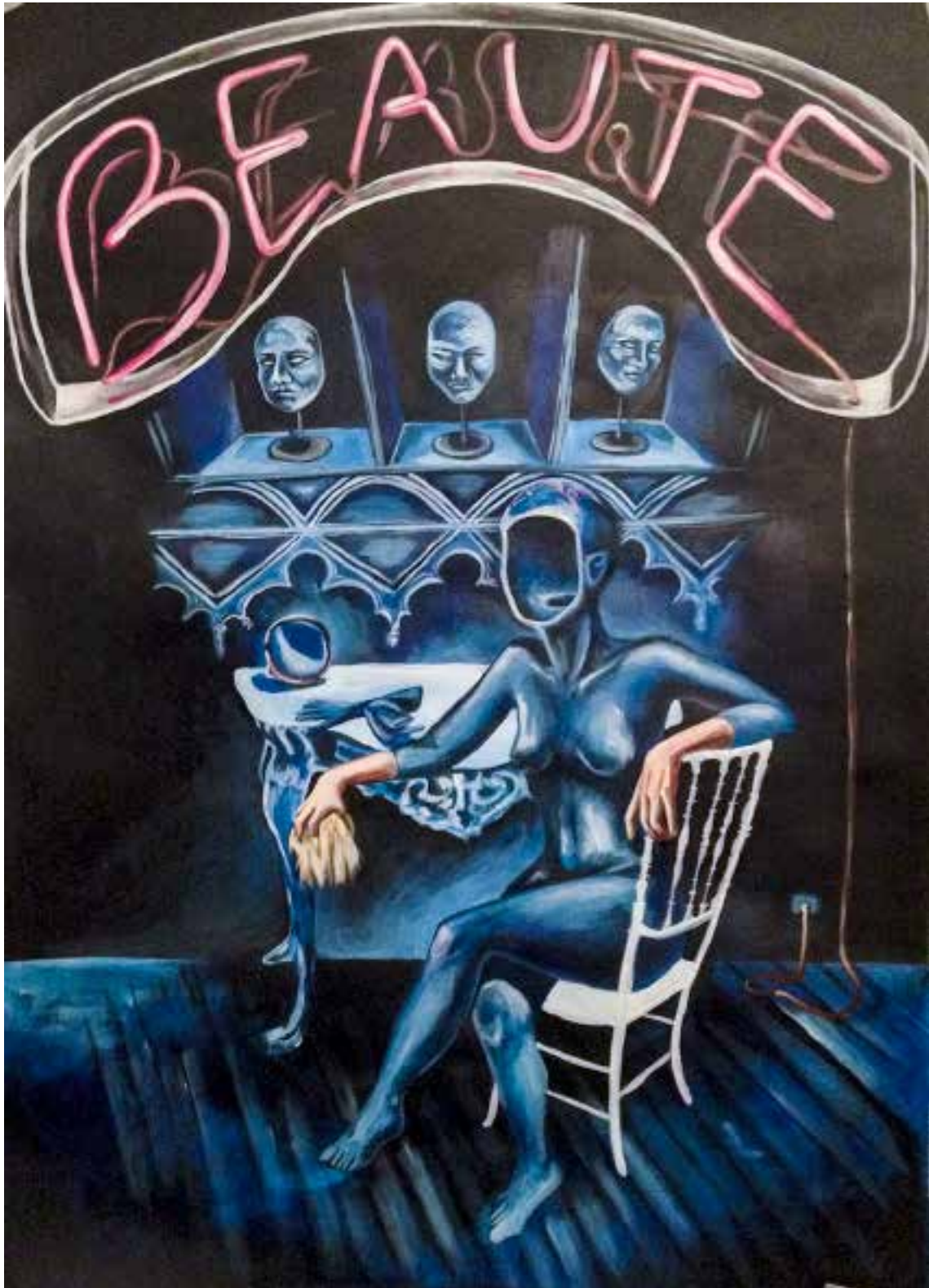
Beauté Acrylique sur papier 84 x 60 cm 2017