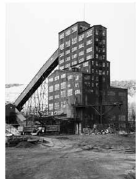
Extrait de la série des Bechers Typologies photographiques