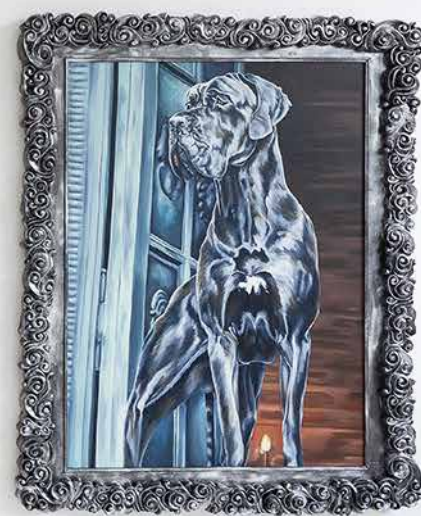
Sans titre, avec fusil huile sur toile, matériaux divers pour les cadres dimensions du triptyque : 270 x 450 cm 2014