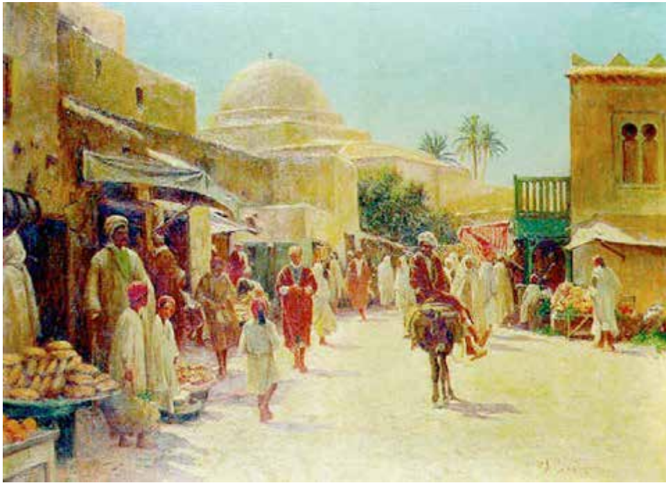
Promeneurs et marcheurs dans une ville tunisienne Alexis de la Hogue