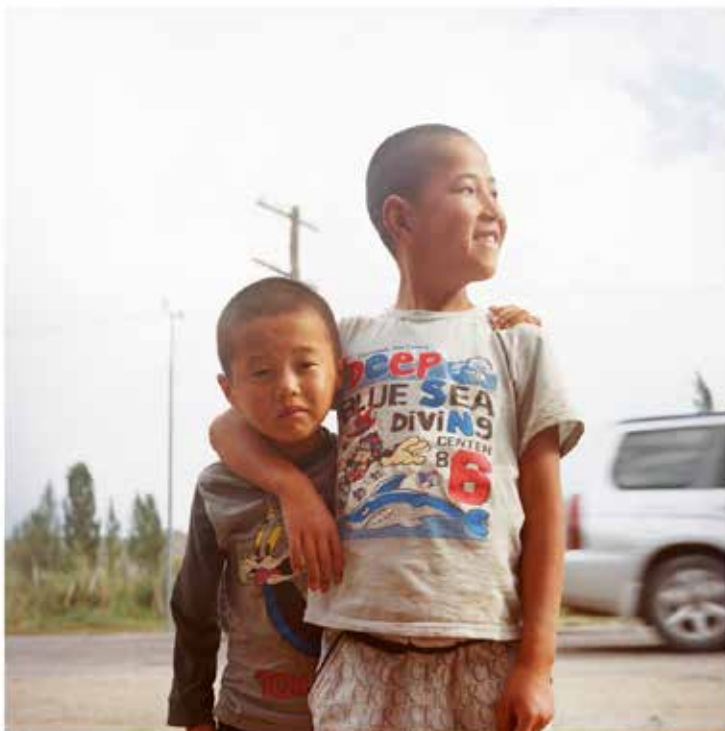
Vues du Kazakhstan Claire Grumellon