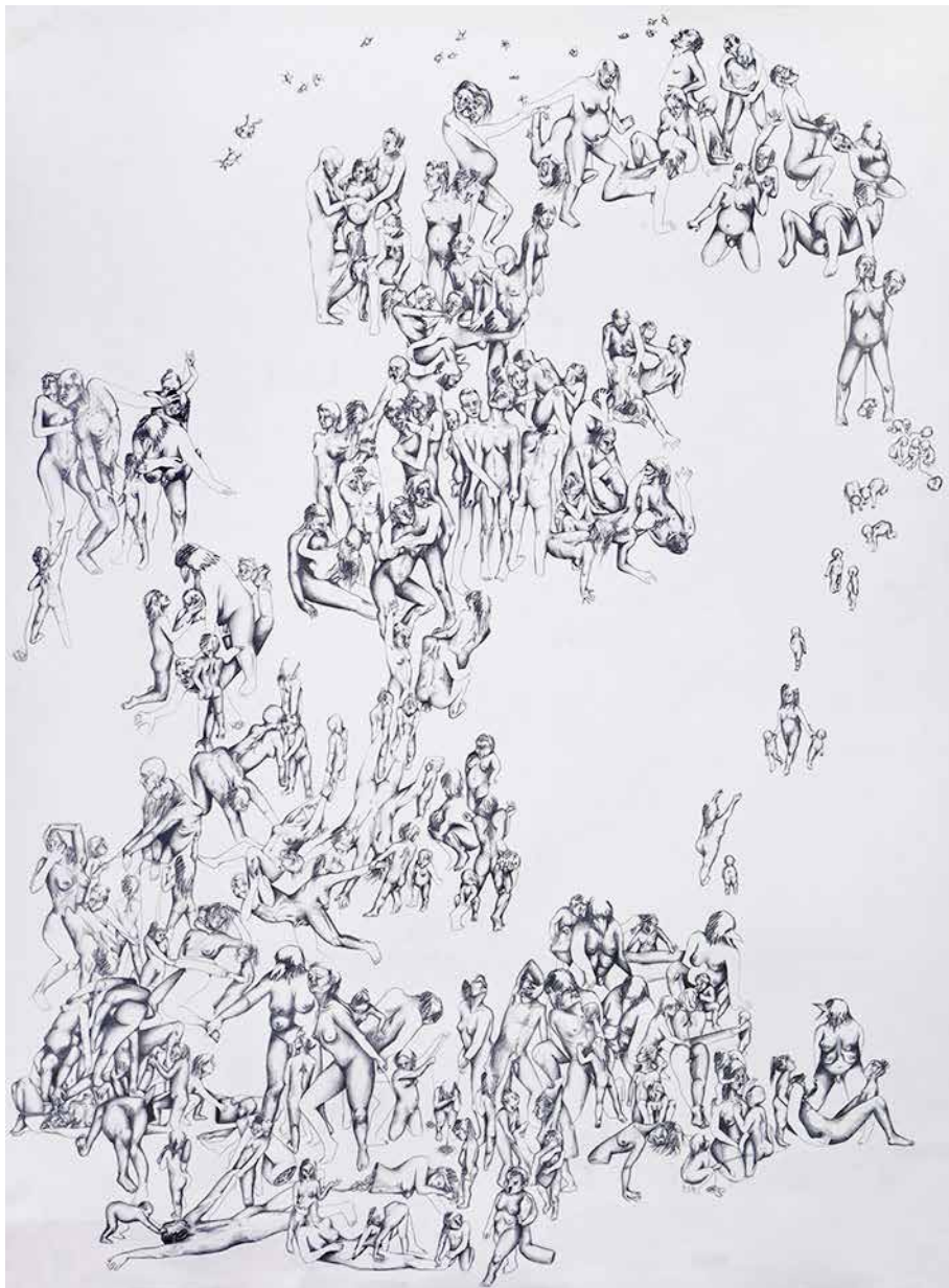
Inferno, série 1 #2 et 3 Graphite, mine de plomb et fusain sur papier Vélin 60 x 32,5 cm 2017