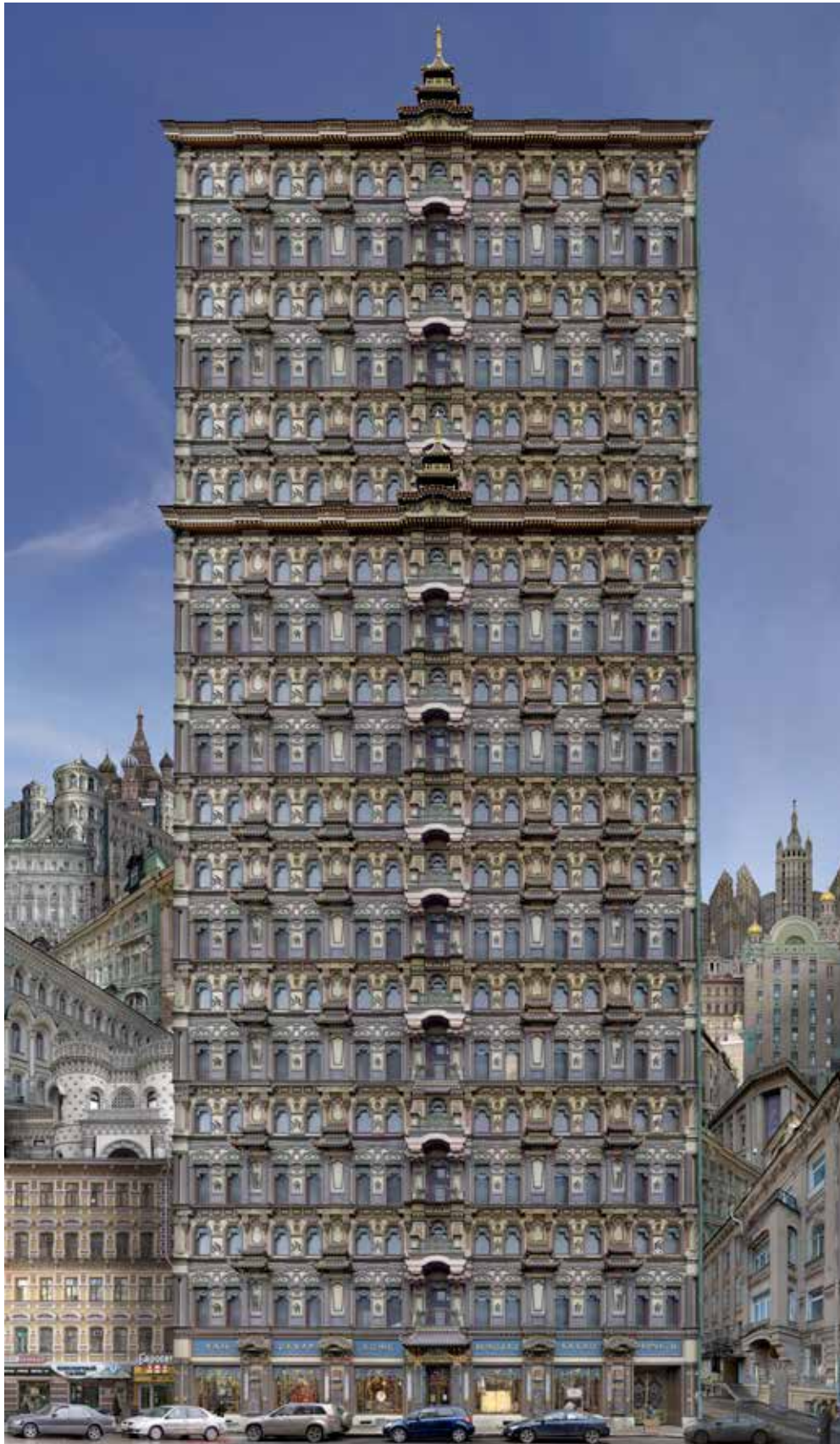
Babel Moscou Jean-François Rauzier