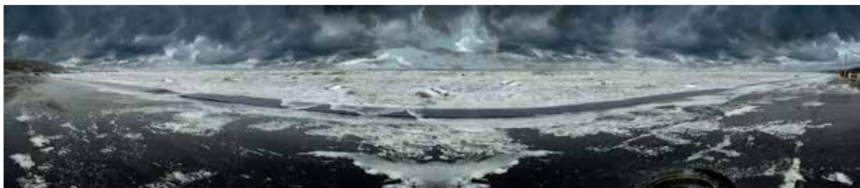
Tempête à Omaha Beach Jean-François Rauzier

Ces nouvelles images prises restaient assez déformées puisque la technique de prise de vue implique des lignes de fuite courbes. Il reconnaît l'intérêt de ces déformations d'un point de vue plastique, il les utilisera d'ailleurs volontairement dans certaines de ses premières images comme Tempête à Omaha Beach . Mais encore une fois cela était insuffisant pour lui car il trouvait l'effet trop systématique et cherchait à redresser ses lignes de fuite pour obtenir un paysage moins marqué, moins connoté par la technique.