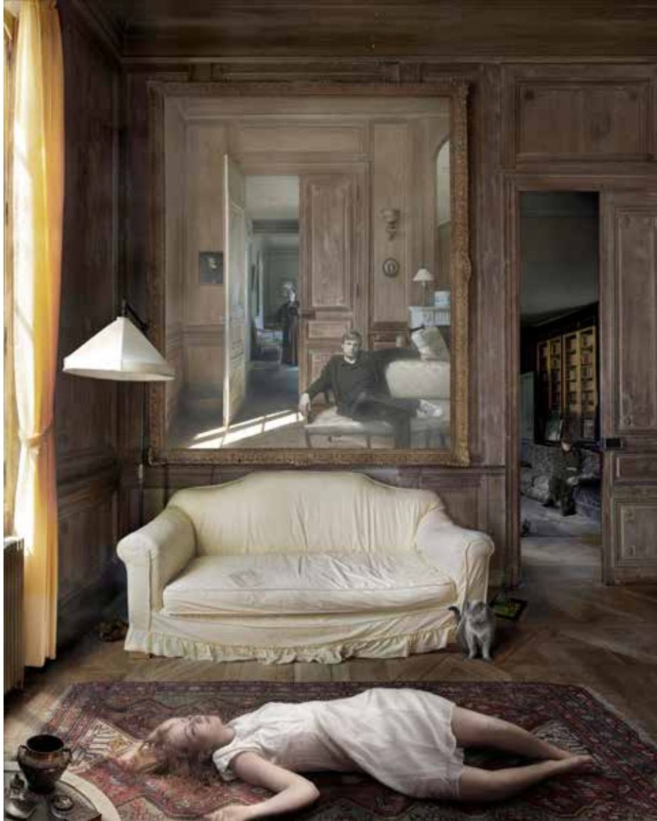
Belle Endormie Jean-François Rauzier

Belles Endormies, inspirée par le livre éponyme de Kawabata. Dans ce livre, des vieillards se rendent dans une maison de repos d'un genre un peu particulier où des jeunes filles sont droguées pour qu'elles ne se réveillent pas. Ils payent pour passer la nuit à leurs côtés et ce que raconte le livre c'est que ces moments deviennent des moments d'introspection sur des questions existentielles face à la pureté et la beauté des jeunes filles. Dans l'interprétation de Jean-François, des jeunes filles sont étendues sur des divans pendant que des hommes les regardent avec en fond la mère maquerelle qui fume sa cigarette.