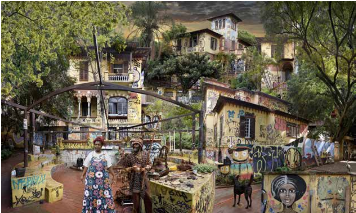
Arte Rua Sao Paulo Exemple de tag Jean-François Rauzier