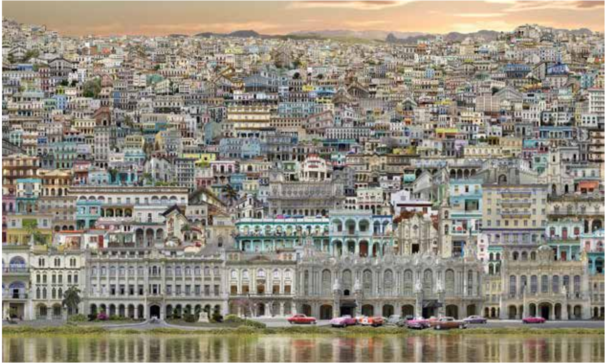
Veduta de Cuba Jean-François Rauzier