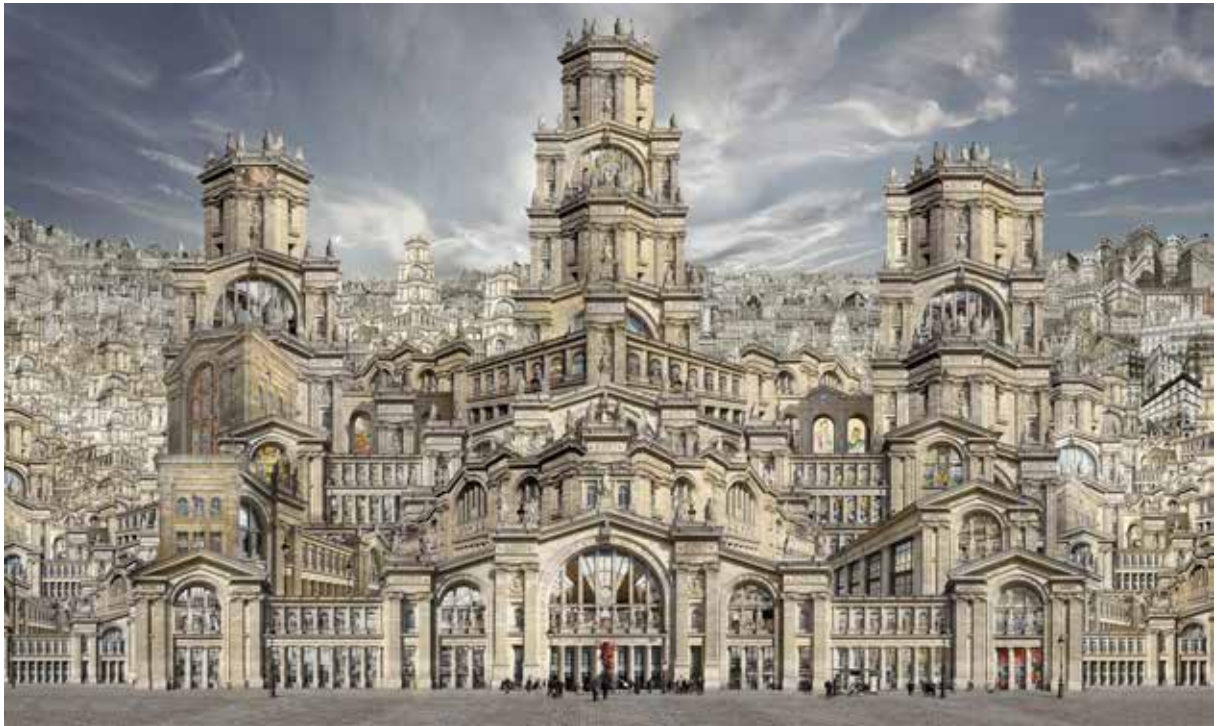
Gare du Nord Jean-François Rauzier