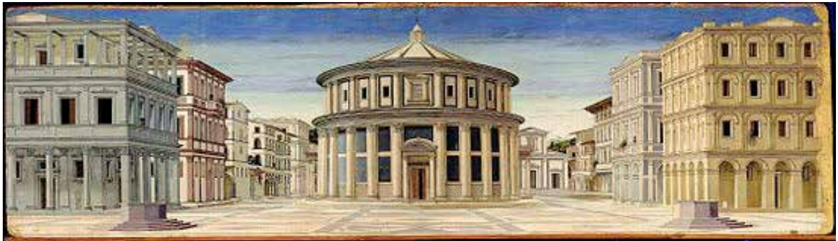
Cité Idéale Piero della Francesca