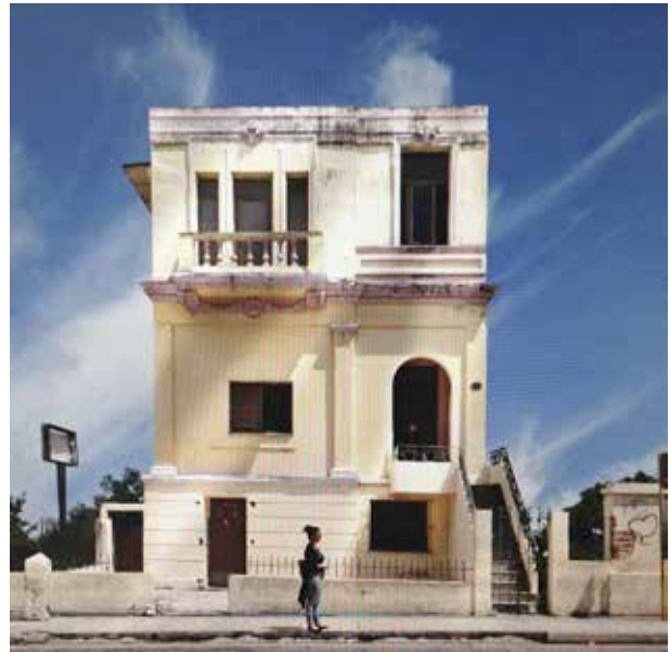
Maison cubaine avant détourage Image finale d'une maison cubaine