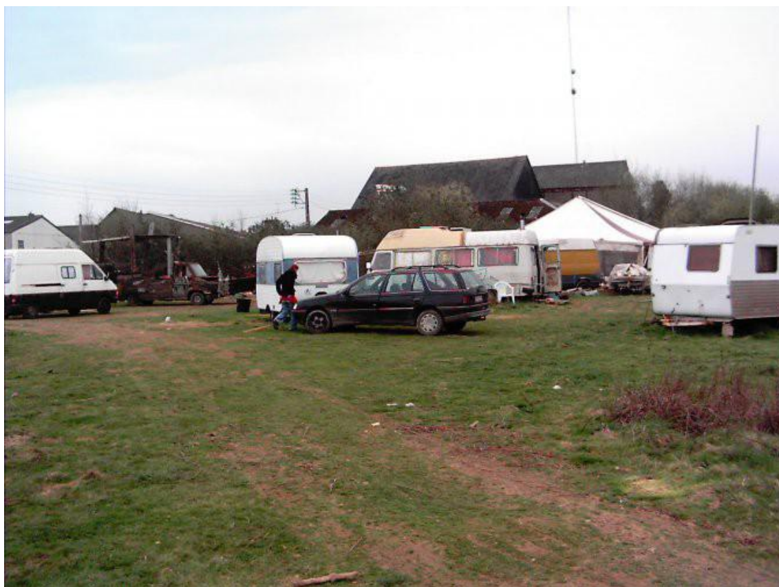
Le Terrain des chap'

À cette époque, l'occupation de La Villa est tolérée par le propriétaire. Pour le collectif ces deux lieux sont distincts, note Jean-Pierre Boucher, étant donné que La Villa est un squat 120 . Squatter est une infraction inscrite dans le Code pénal. Par conséquent pour continuer à obtenir le soutien de la ville de Rennes, les deux lieux doivent être dissociés alors même que de nombreux habitants de La Villa sont des Élaborantins .