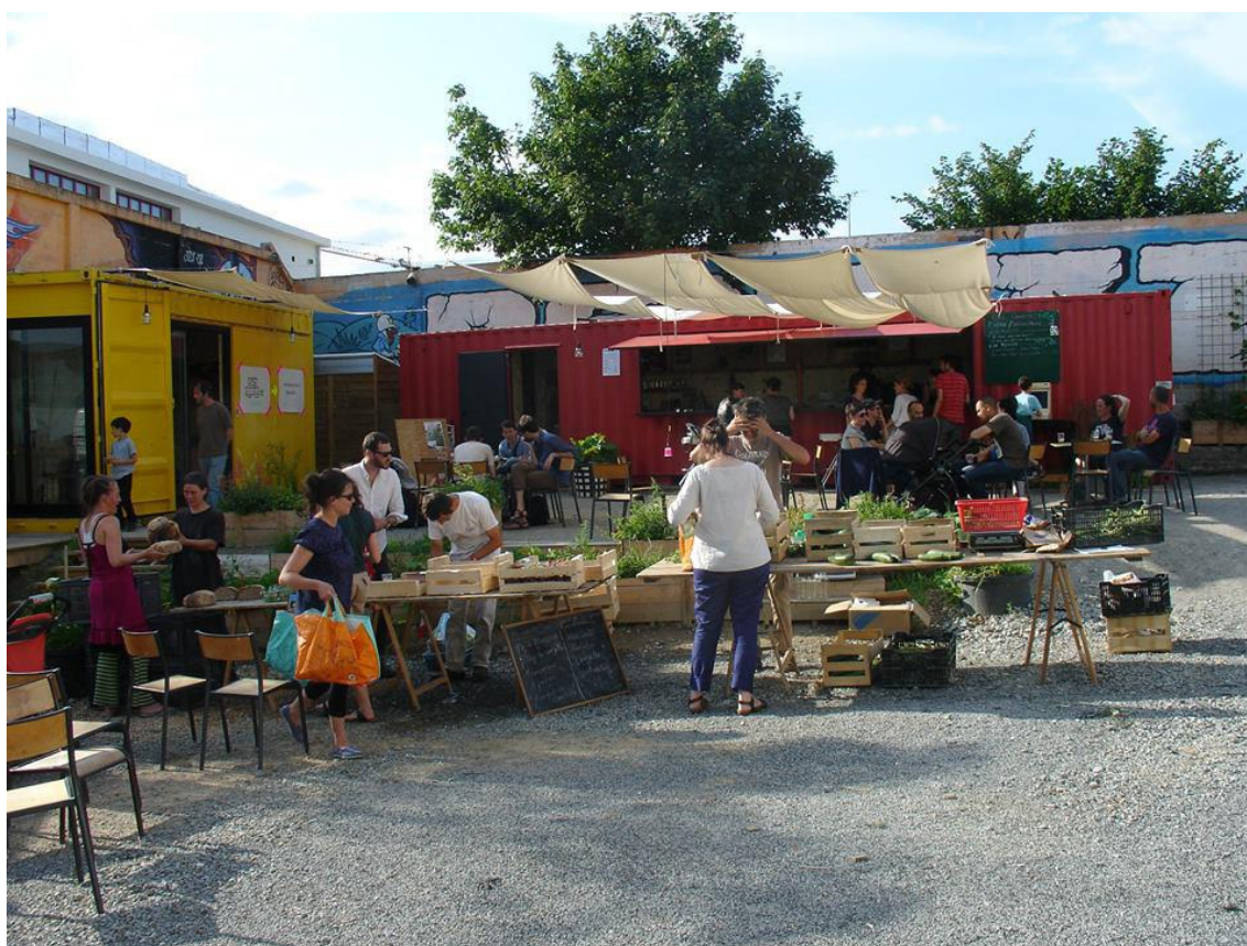
La Place des containers

l'interpellation des habitants, acteurs dans cette démarche.