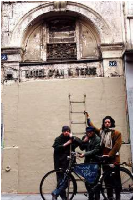
Le KGB avant l'ouverture du 59 Rivoli en 1999 en ligne : http://59rivoli-eng.org/history.html 23/09/216.