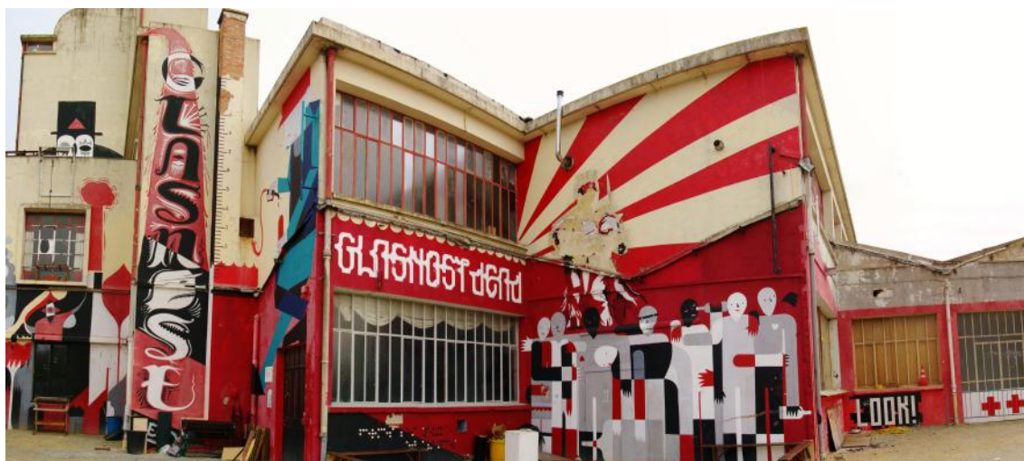
Les Ateliers du vent (avant les travaux de mises aux normes)

Ce collectif est basé à Rennes dans une ancienne usine à moutarde Amora désaffectée près du nouveau quartier de la Courrouze et insérée dans la ZAC Claude-Bernard/Alexandre-Duval.