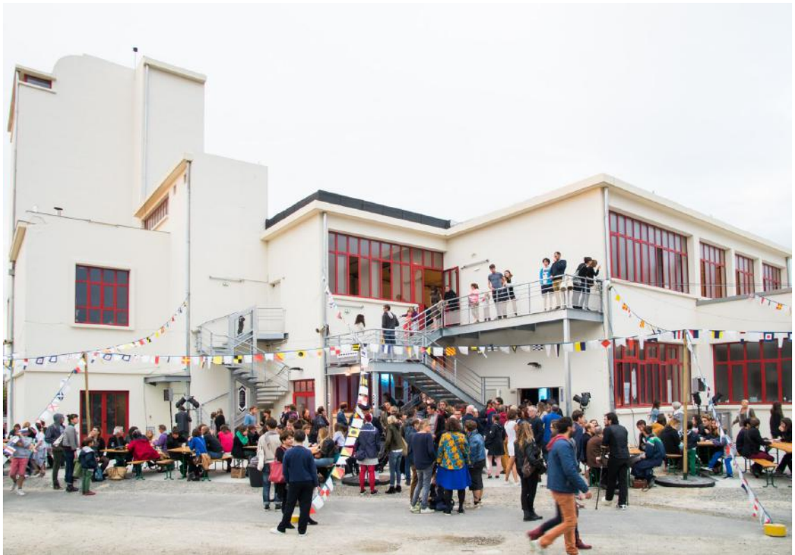
Les Ateliers du vent (après la réhabilitation)

en ligne : http://www.lesateliersduvent.org/le-collectif , 22/05/2017.