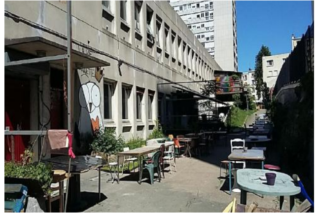
Le Théâtre de verre au 12 rue Henri Ribière ELENA CAPRA Maria, 2017.