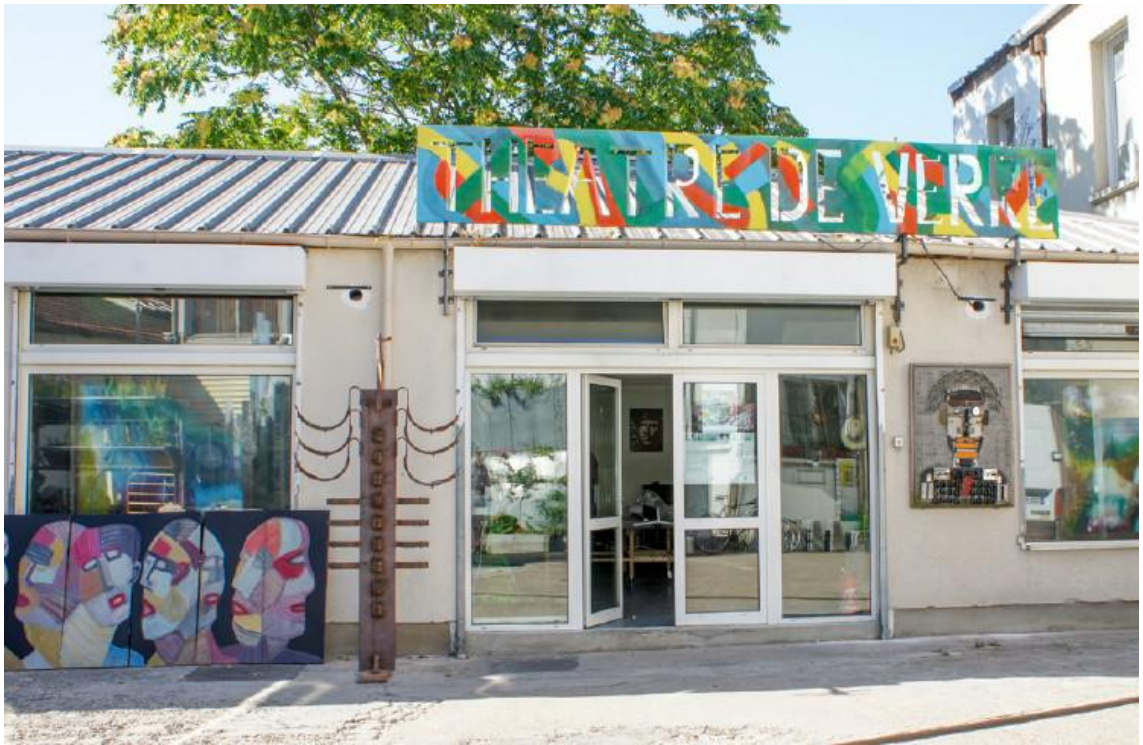
Théâtre de verre au 17 rue de la Chapelle

Théâtre de verre, Rapport d'activités : saison 2013-2014, 2015 , en ligne :