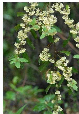
Figure 32 : Litsea cubeba

Lieu de récolte : Asie, Hymalaya, Vietnam