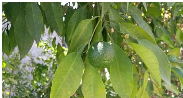
Figure 12 : Citrus aurantium (jeune fruit)