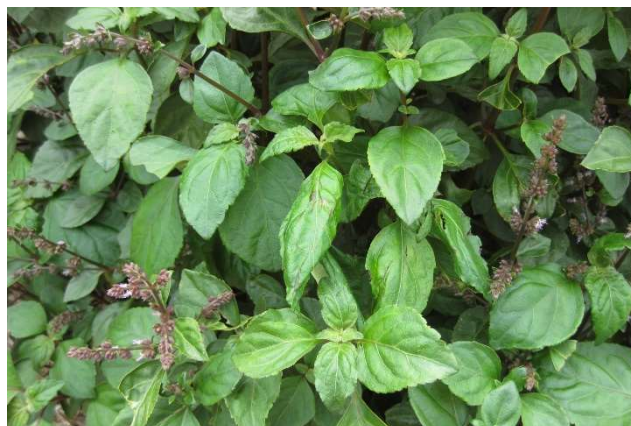
Figure 40 : Pogostemon cablin

Lieu de récolte : Asie du Sud-est (Chine, Malaisie, Indonésie), Madagascar, Seychelles, Brésil.