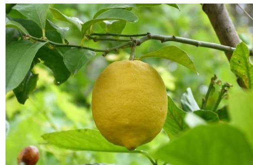
Figure 13 : Citrus limon

Lieu de récolte : Italie, Sicile, Espagne, Afriques, caraïbes, Inde