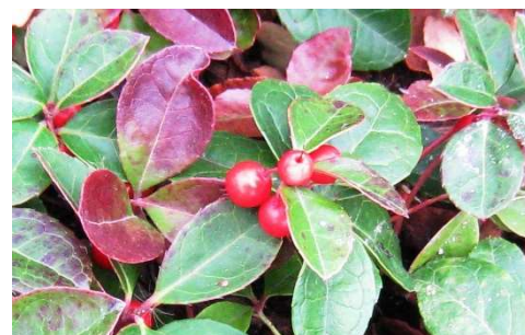
Figure 25 : Gaultheria procumbens

Lieu de récolte : Est des Etats unis d'Amérique et du Canada