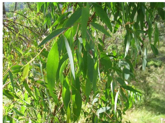
Figure 23 : Eucalyptus radiata

Lieu de récolte : Australie, bassin méditerranéen, Amérique du Sud.