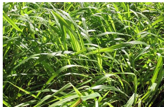
Figure 18 : Cymbopogon winterianus

Lieu de récolte : Vietnam, Indonésie, Chine