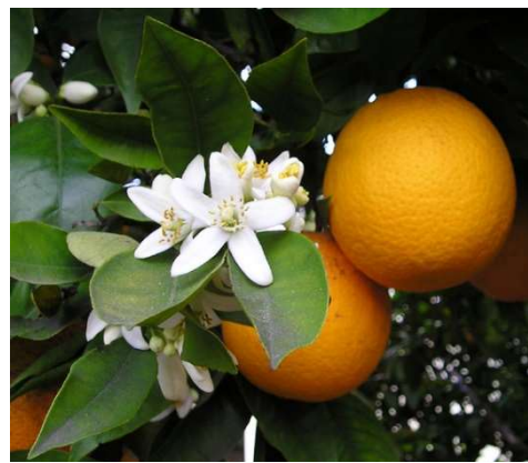
Figure 15 : Citrus sinensis

Lieu de récolte : Asie, Portugal, Brésil