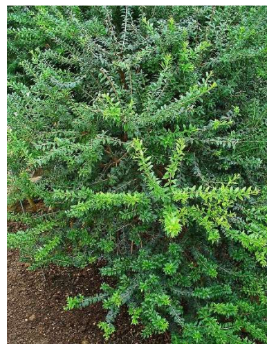
Figure 35 : Myrtus communis

Lieu de récolte : France, Europe méditerranéenne, Afrique septentrionale et en Asie occidentale.