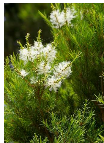
Figure 2 : Melaleuca alternifolia

Lieu de récolte : Zones humides d'Australie, Nouvelle Zélande