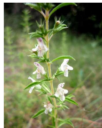
Figure 43 : Satureja montana