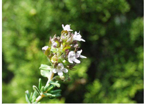
Figure 45 : Thymus vulgaris