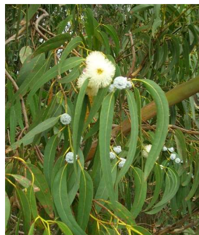
Figure 22 : Eucalyptus globulus

Lieu de récolte : Australie, Tasmanie, régions subtropicale d'Afrique, d'Asie (Chine Inde, Indonésie), et Amérique du sud, Europe méridionale (Espagne, Portugal) Chine