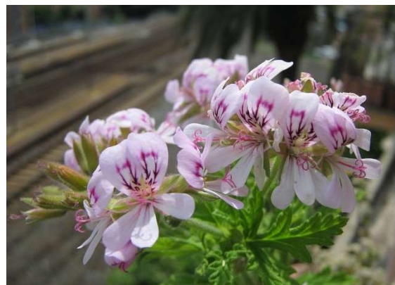
Figure 38 : Pelargonium graveolens

Lieu de récolte : France, Egypte, Madagascar, Réunion