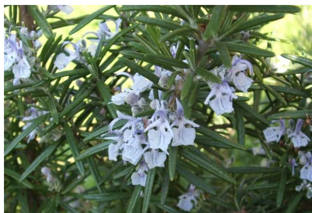
Figure 41 : Rosmarinus officinalis

Lieu de récolte : Europe, Afrique, Pays du pourtour méditerranéen