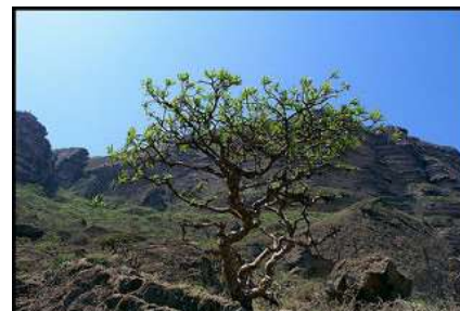
Figure 5 : Boswellia sacra

Origine : Ethiopie, Yémen, Somalie, Arabie Saoudite, Erythrée