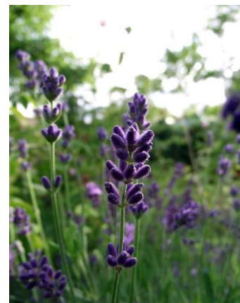
Figure 29 : Lavandula officinalis

Lieu de récolte : France (Il existe une appellation d'origine contrôlée « huile essentielle [ou essence] de lavande de haute Provence)