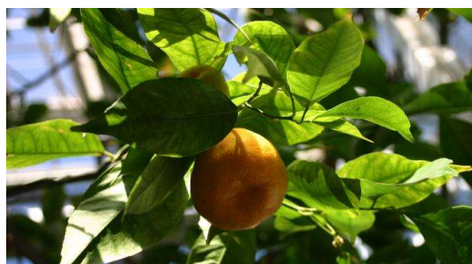
Figure 14 : Citrus reticulata

Lieu de récolte : Italie, Afrique du sud