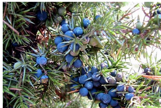
Figure 27 : Juniperus communis

Lieu de récolte : au Maroc en Moyen Atlas, Balkans, Europe