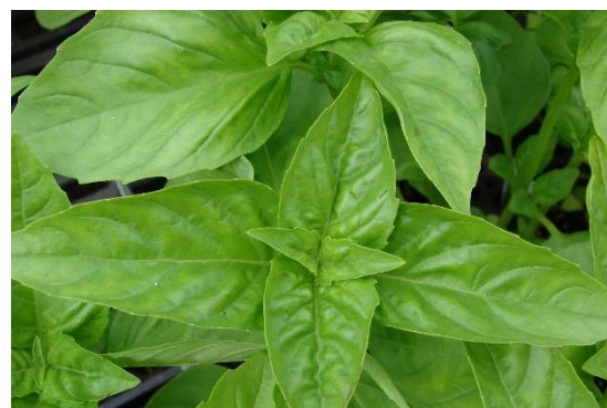
Figure 3 : Ocimum basilicum

Lieu de récolte : Madagascar, zones tropicales d’Afrique et d’Asie, Afrique du Nord, France, Italie, pourtour méditerranéen