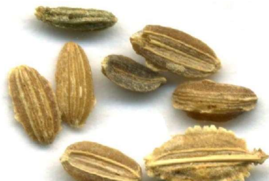
Figure 19 : Daucus carotta

Lieu de récolte : France, Inde, Italie, Maroc, Pologne, Hongrie