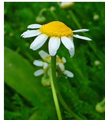
Figure 7 : Chamaemelum nobile

Lieux principaux de récolte : Europe occidentale, ouest de la France