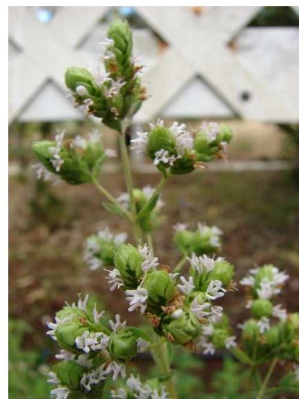
Figure 37 : Origanum majorana

Lieu de récolte : France, bassin méditerranéen