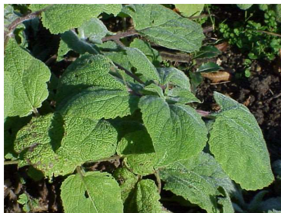
Figure 42 : Salvia sclarea

Lieu de récolte : Europe du Sud, cultivée en France et en Russie