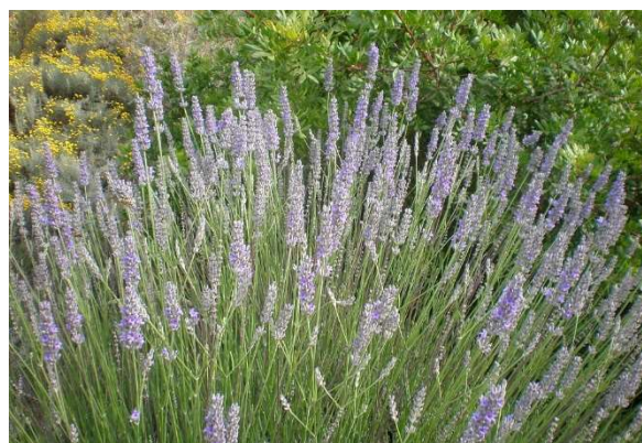
Figure 30 : Lavandula x intermedia clone super