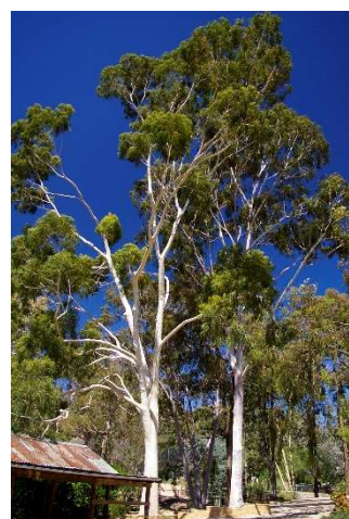
Figure 21 : Eucalyptus citriodora

Lieu de récolte : Chine, Vietnam, Brésil, Ethiopie, Australie, Inde, Madagascar