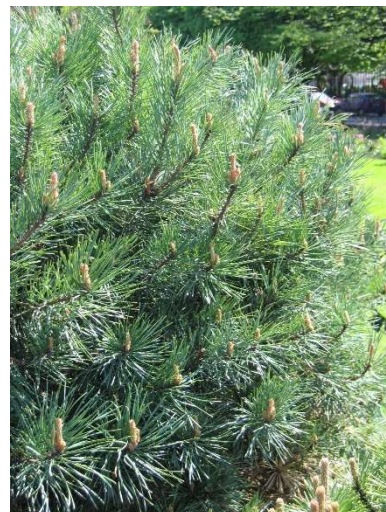
Figure 39 : Pinus sylvestris