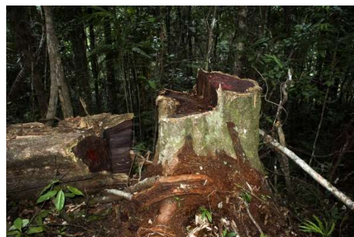
Figure 4 : Aniba rosaeodora

Lieu de récolte : Amérique du sud (Amazonie, Guyane)