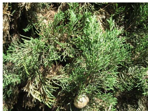
Figure 16 : Cupressus sempervirens

Lieu de récolte : France, Maroc, Europe méditerranéenne Asie occidentale.