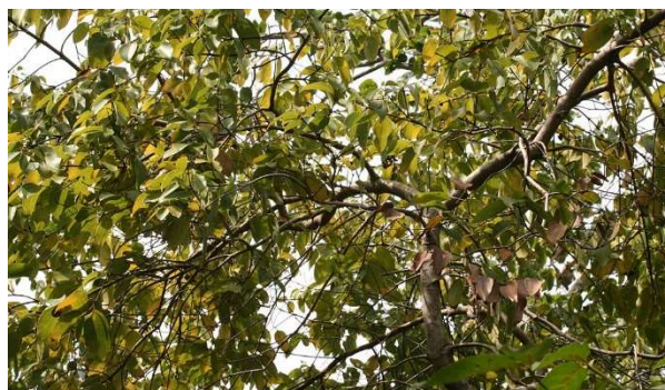
Figure 9 : Cinnamomum verum

Lieu de récolte : Présents sur les îles de Ceylan, Maurice, Seychelles, Réunion, Madagascar, Antilles, Indes et Chine. (Grosjean 2011)