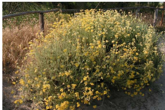
Figure 26 : Helichrysum italicum

Lieu de récolte : France, Italie, Corse et Bosnie