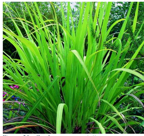
Figure 20 : Cymbopogon martinii