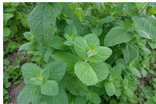
Figure 34 : Mentha ×piperita

Lieu de récolte : Etats-Unis d'Amérique (Idaho, Oregon, Indiana, Wisconsin, Washington), France, Italie, Royaume-Unis.