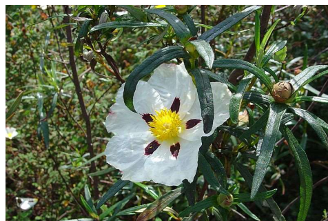
Figure 10 : Cistus ladaniferus

Lieu de culture : France, Espagne, Maroc, Portugal