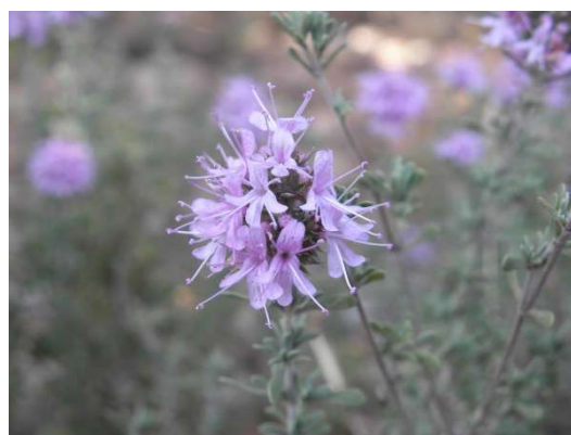
Figure 44 : Thymus satureioides