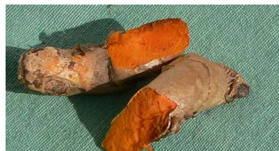
Figure 17 : Curcuma longa

Lieu de récolte : Inde, Asie tropicale, Afrique, Antilles