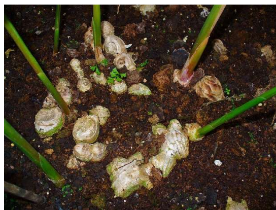
Figure 46 : Zingiber officinale

Lieu de récolte : cultivé en Chine, en Inde, en Asie du Sud Est, en Afrique et au Brésil.