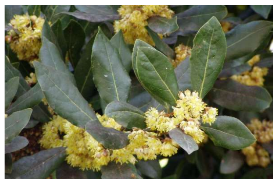
Figure 28 : Laurus nobilis

Lieu de récolte : France, Slovénie, Asie mineur, Maroc, Portugal, Balkans.