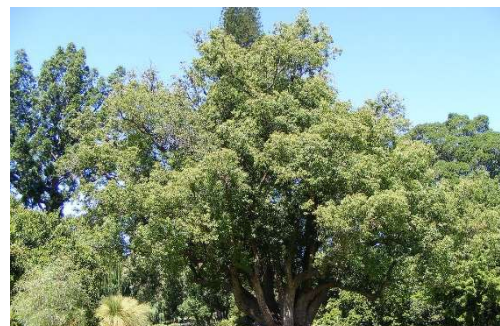
Figure 8 : Cinnamomum camphora