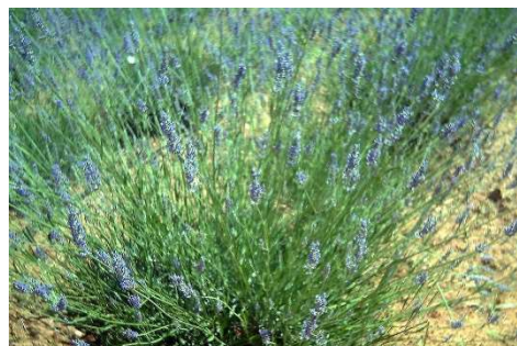
Figure 31 : Lavandula latifolia

Lieu de récolte : Récoltée dans les mêmes régions que la lavande vraie mais à des altitudes plus basses