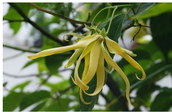
Figure 6 : Cananga odorata

Lieu de récolte : Traditionnellement présent en Malaisie et Indonésie. Il a été introduit dans la plupart des îles du Pacifique, ainsi qu'en Australie du Nord, en Thaïlande et au Viêt-Nam.