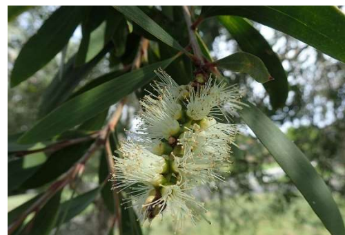
Figure 33 : Melaleuca quinquenervia

Lieu de récolte : Madagascar, Australie, sud-est asiatique, Nouvelle Calédonie, Papouasie-Nouvelle-Guinée