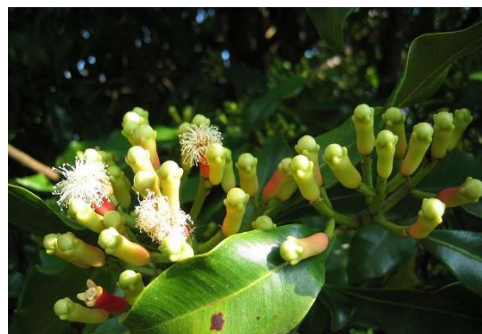
Figure 24 : Syzygium aromaticum

Lieu de récolte : Tanzanie, Madagascar, Comores, Sri Lanka, Indonésie, Malaisie, Chine, Kenya