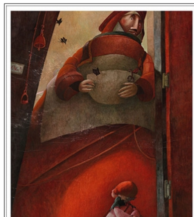
Babayaga de Tai-Marc Le Than, illustration de Rébecca Dautremer