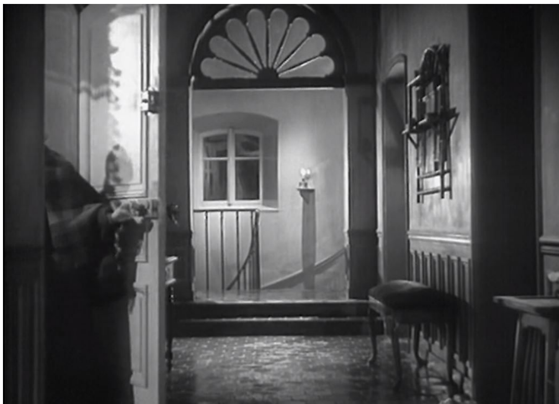
Tante Délie fermant sa porte, Les Dernières Vacances , 00:18:34

regret de cet enfermement, comme elle l'exprime à la fin du film, au moment du départ. Elle est plusieurs fois filmée, toujours sous le même angle, entrant dans sa chambre et la fermant à clé.