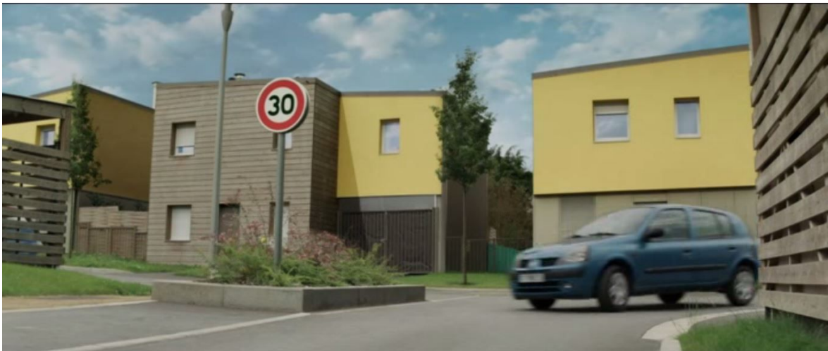
Opposition entre la maison de famille et le lotissement, Belles familles , 00:30:43 et 00:41:48