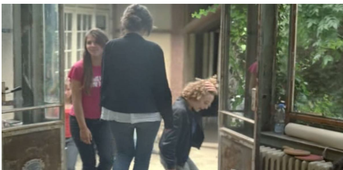
La maison ouverte, mouvante, circulante à la fin de L'Heure d'été , 01:31:27 et 01:31:39