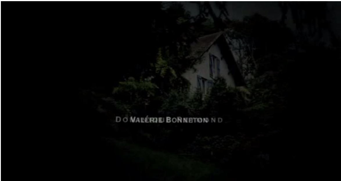
Générique de début de L'Heure d'été , ouverture au noir, 00:00:34

Telle une image enfouie dans la mémoire collective de la famille qui ressurgirait progressivement de l'oubli, une image mélancolique et rêveuse, elle finit par se fondre à nouveau dans un noir sur lequel s'apposent les caractères du titre du film. « C'est parce que les souvenirs des anciennes demeures sont revécus comme des rêveries que les demeures du passé sont en nous impérissables. » 27