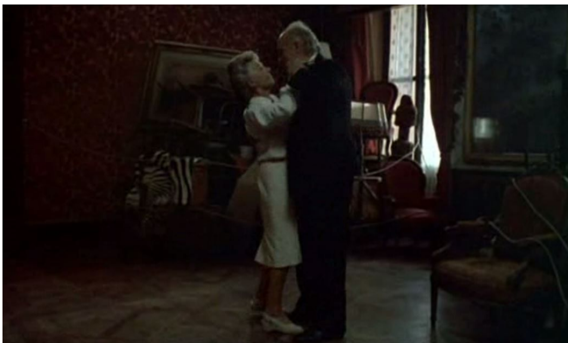
Madame Vieuzac, fantôme musical, Milou en mai , 01:40:29 et 01:40:50