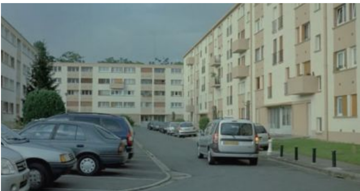
Opposition formelle entre ville et nature, L'Heure d'été , 01:25:31 et 01:27:41