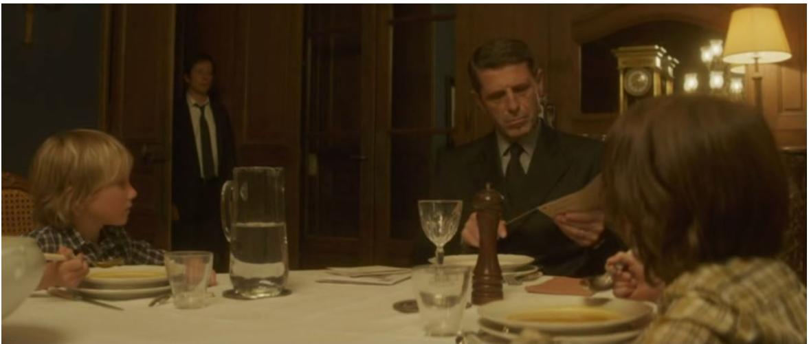
La porte révèle le souvenir dans le présent, Belles familles , 00:32:32 et 00:32:46

Placée au sein d'une séquence longue de plusieurs minutes où les violons nostalgiques sont omniprésents, cette scène est, elle, silencieuse, marquant bien le passage vers le monde du souvenir et des morts. Autre instance de porte-passage, dans la très belle dernière séquence de Milou en mai , alors que toute la famille est enfin repartie après moult aventures rocambolesques dans la campagne gersoise et alors que l'agitation de mai 1968 finit doucement de s'éteindre, Milou réinvestit la maison, seul. Dans l'entrée vidée de ses meubles massifs, un air au piano s'élève à travers la porte porte du salon qui se fait passage vers le fantôme de sa mère, assise