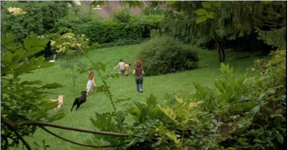
Enclave protectrice du jardin, L'Heure d'été , 00:01:27

Dans Belles familles , le premier retour de Jérôme (interprété par Mathieu Amalric) dans la maison d'Ambray semble tout autant teinté de nostalgie que d'inquiétude. Le ressentiment de Jérôme envers son père investit la maison d'une aura d'angoisse diffuse. Haute et imposante, filmée en contre-plongée, elle semble le toiser.