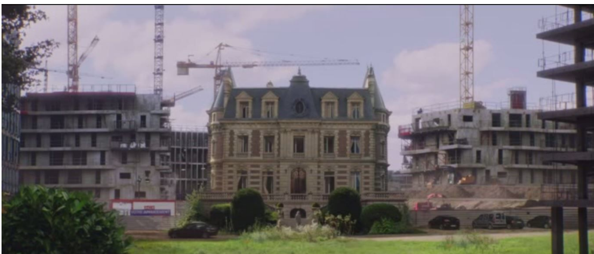
La maison en prise avec le monde moderne, Belles familles , 01:44:51

« J'ai longtemps pensé que le cinéma était l'endroit où l'on pouvait plus facilement qu'ailleurs changer les choses, changer les meubles de place dans la maison ou même reconstruire la maison autrement » 103 , dit Jean-Luc Godard en parlant de la puissance de réaménagement et de transformation de la maison.