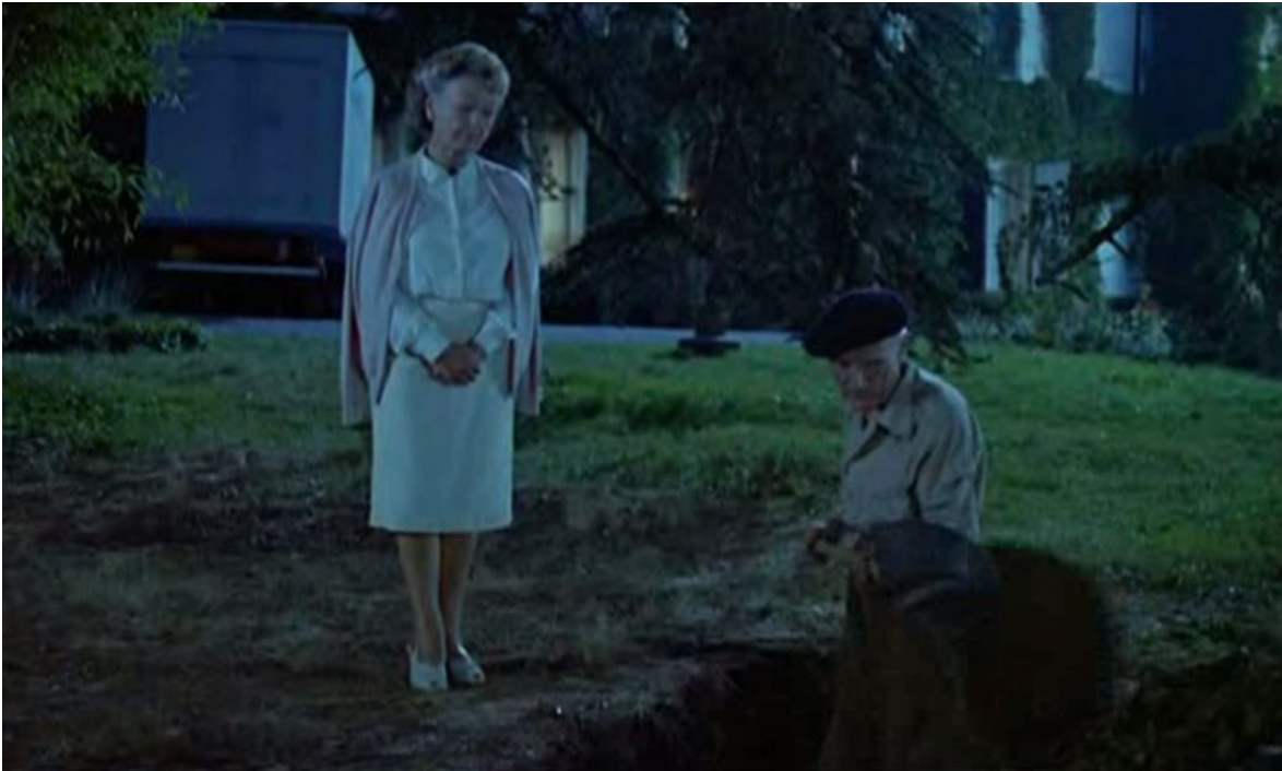
Léonce creuse, encore et encore, Milou en mai , 01:02:45, 01:04:45, 01:06:30, 01:10:52 et 01:12:41

L'arrivée consécutive de M. et Mme Boutelleau, les voisins dont nous avons déjà tiré le portrait, sonne le glas des utopies soixante-huitardes familiales et sert de point de bascule de la claustrophobie à une nouvelle agoraphobie. Une deuxième coupure de courant, alors que les personnages tentent d'obtenir des nouvelles de Paris à la radio, vient conclure cette phase d'ouverture. Elle sera suivie d'une fuite mémorable et ubuesque de toute cette troupe de personnages à travers les champs et les bois au petit jour, transportant leurs biens de valeur (tableaux, bibelots) sur des mulets et tentant de survivre comme ils peuvent (mais en mangeant toujours bien), pour échapper à des assaillants communistes imaginaires qui seraient à leur poursuite. Cette paranoïa bourgeoise et matérialiste est traitée de manière comique