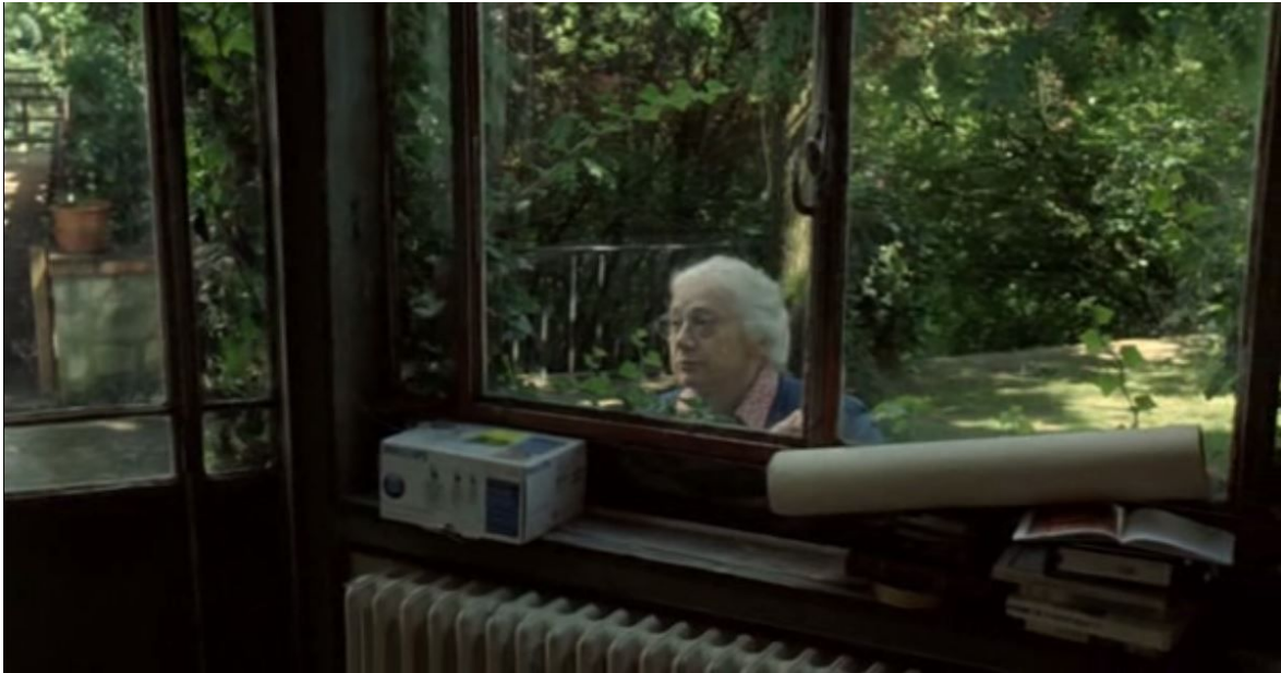
Éloïse, de l'autre côté du miroir, L'Heure d'été , 01:26:54 et 01:27:03