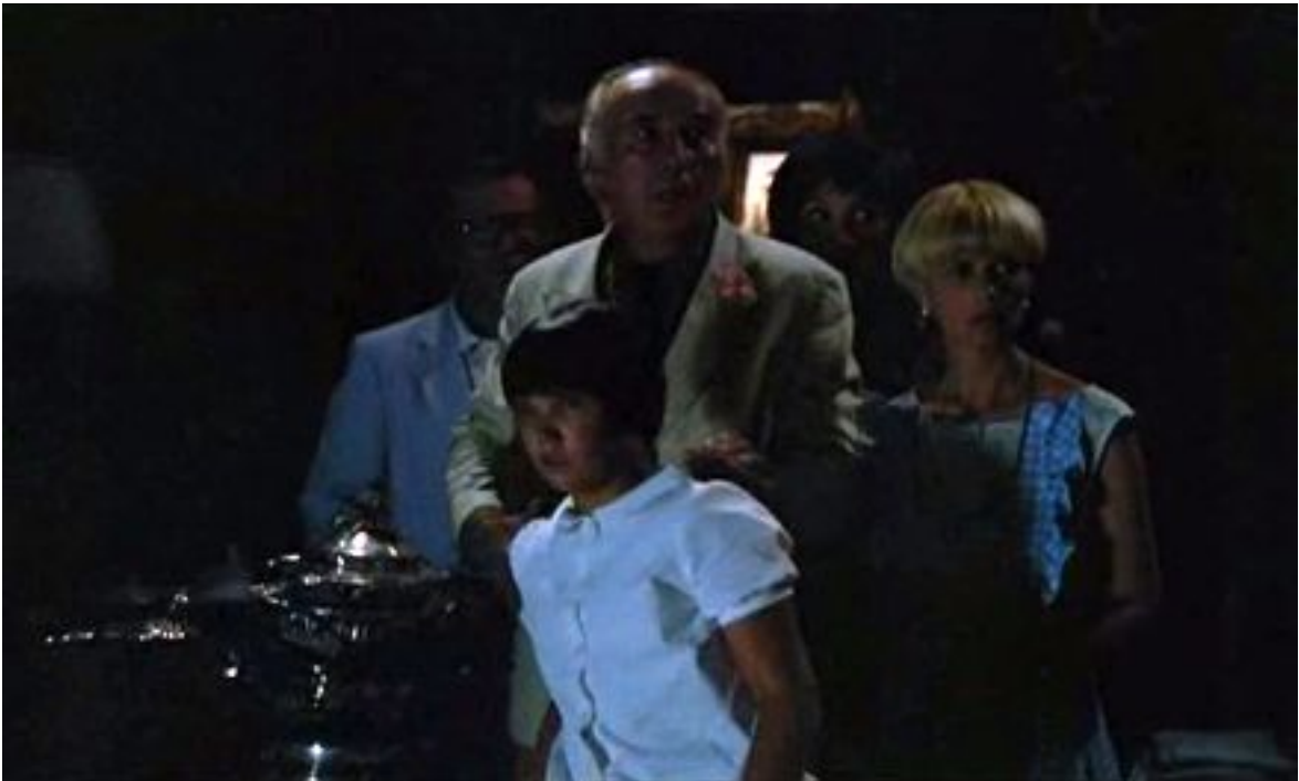
La menace vient de l'extérieur, Milou en mai , 00:48:30 et 00:48:49

À ce moment, la famille, à l'intérieur de la maison, se trouve presque en état de siège. Camille demande où se trouve le fusil, dans une recherche claire de faire respecter la frontière entre intérieur et extérieur. C'est donc Pierre-Alain, le fils de