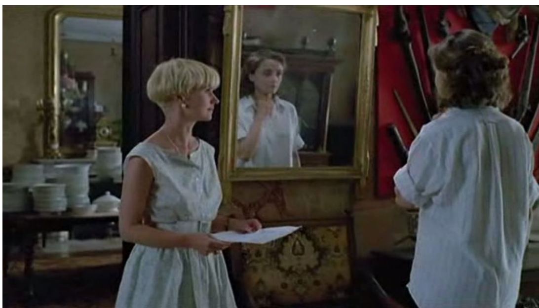
Le miroir comme signe de muséification, transformant les personnages en portraits, Milou en mai , 00:33:22

sous la forme concrète d'un objet, l'immémorialisation d'un être précédent – processus équivalent dans l'ordre imaginaire à une élision du temps. » 67 La clôture est complète, dans un espace défini que l'on veut non soumis aux lois du temps. D'après Baudrillard, toujours, les signes à chercher du renfermement sont les miroirs et les horloges, qui sont toujours présents dans les vieilles maisons bourgeoises. « Car l'horloge est l'équivalent dans le temps du miroir dans l'espace. De même que la relation à l'image spéculaire institue une clôture et comme une introjection de l'espace, de même l'horloge est paradoxalement symbole de permanence et d'introjection du temps. » 68 Le son de la vieille horloge de la salle à manger comme l'image se dessinant dans le grand miroir de l'entrée deviennent les traces, les indices de l'autarcie spatiale et temporelle et par conséquent, de la muséification des maisons de famille.