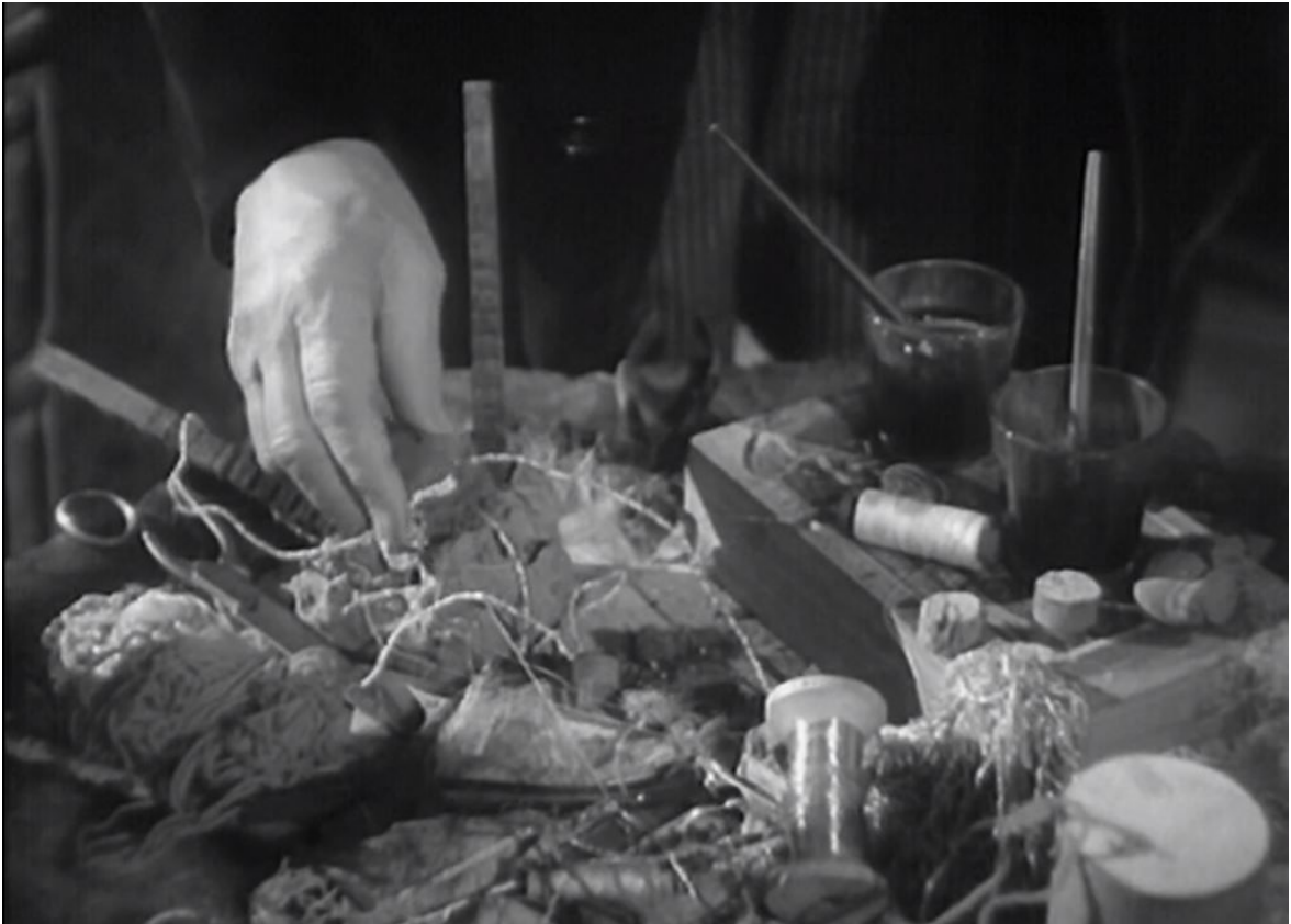
L'ouvrage de Tante Délie, Les Dernières Vacances , 01:23:53

dissimule est enfin soulevé à la fin du film, c'est une œuvre tordue et sinistre que l'on découvre. Elle y aura peut-être déversé tous ses regrets, tout son ressentiment, cachés aux yeux du monde.