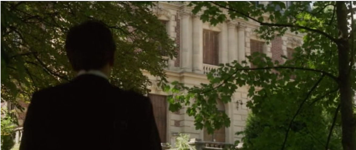
Première arrivée de Jérôme à Ambray, Belle familles , 00:08:29

Dans Belles familles , le premier retour de Jérôme (interprété par Mathieu Amalric) dans la maison d'Ambray semble tout autant teinté de nostalgie que d'inquiétude. Le ressentiment de Jérôme envers son père investit la maison d'une aura d'angoisse diffuse. Haute et imposante, filmée en contre-plongée, elle semble le toiser.