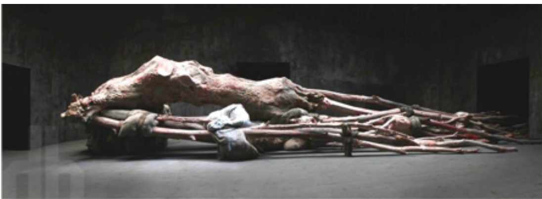
6- Berlinde De Bruyckere - Cripplewood , 2012 – 2013 Cire, époxy, fer, textile, corde, peinture, gypse, toiture 626 (h) x 1002 x 1686 cm