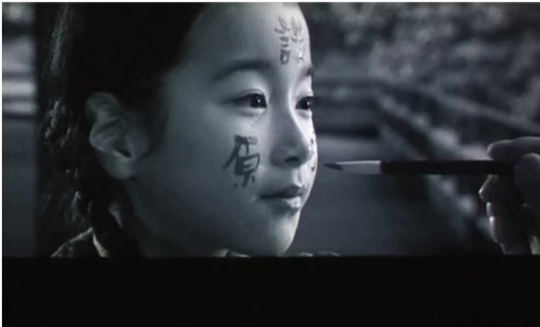
8- Peter Greenaway – The Pillow Book – 1996 – 121 mn