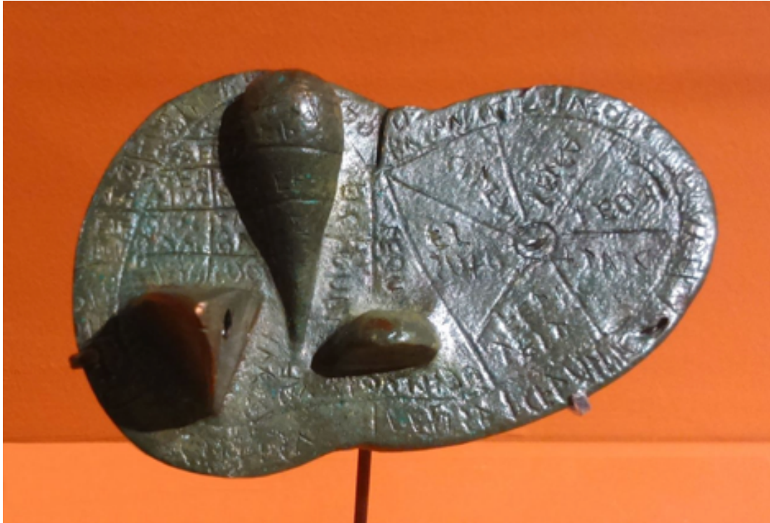
4- Il fegato di Piacenza - Bronze - II ème siècle av. J.-C. - 60x126x76 cm