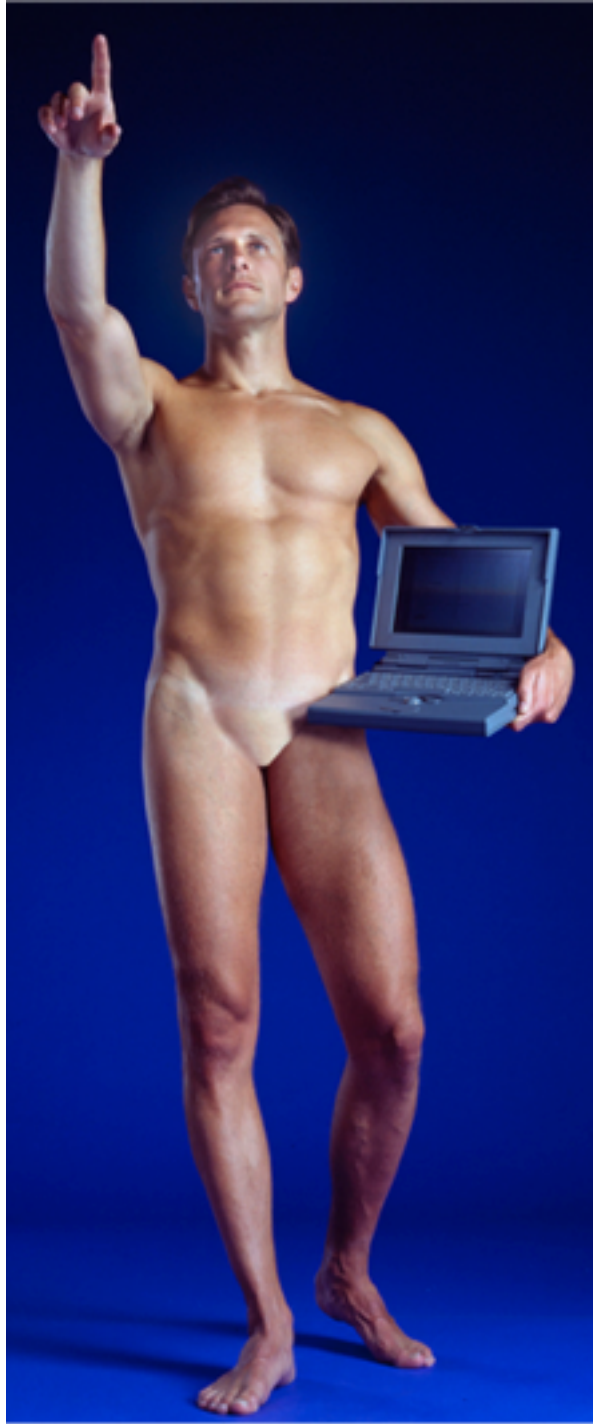
3- Aziz + Cucher , Man with computer - 1992 Série Faith, Honor and Beauty C-print. - 218,4x91,4 cm