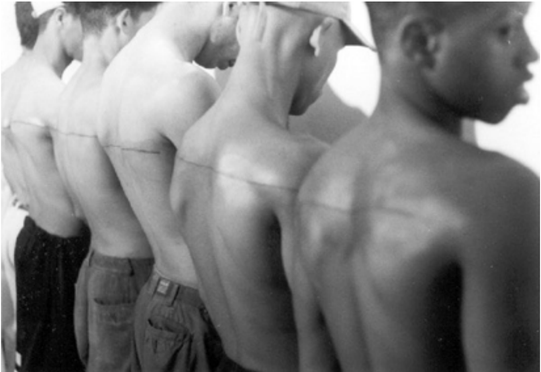
7- Santiago Sierra - Ligne de 250 cm tatouée sur six personnes - 1999 Espace Aglutinor - La Havane – Cuba