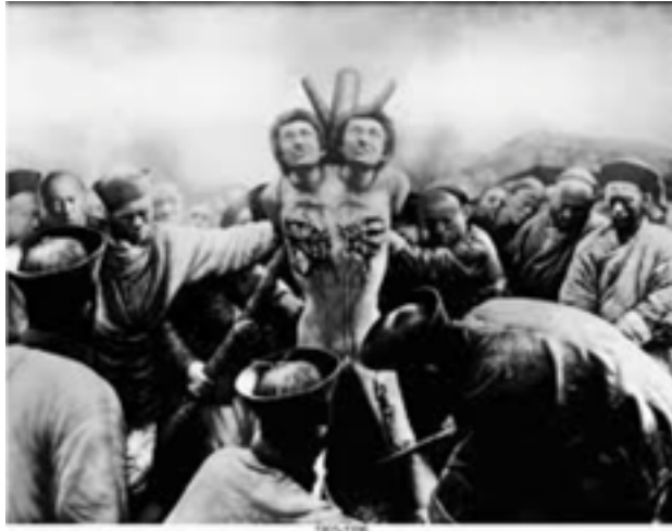
2 - Chen Chieh-Jen - Genealogy of self – 1996 Épreuve laser noir et blanc, 208x260 cm Courtesy galerie nationale du Jeu de Paume Collection de l'artiste