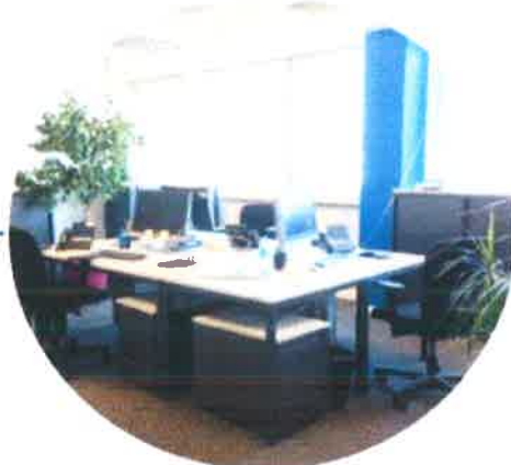
Département rééducation / Département cadre et médecin