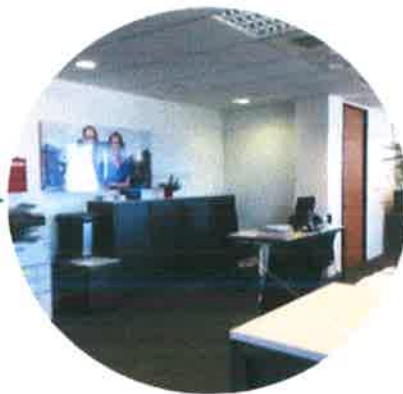
Département petite enfance