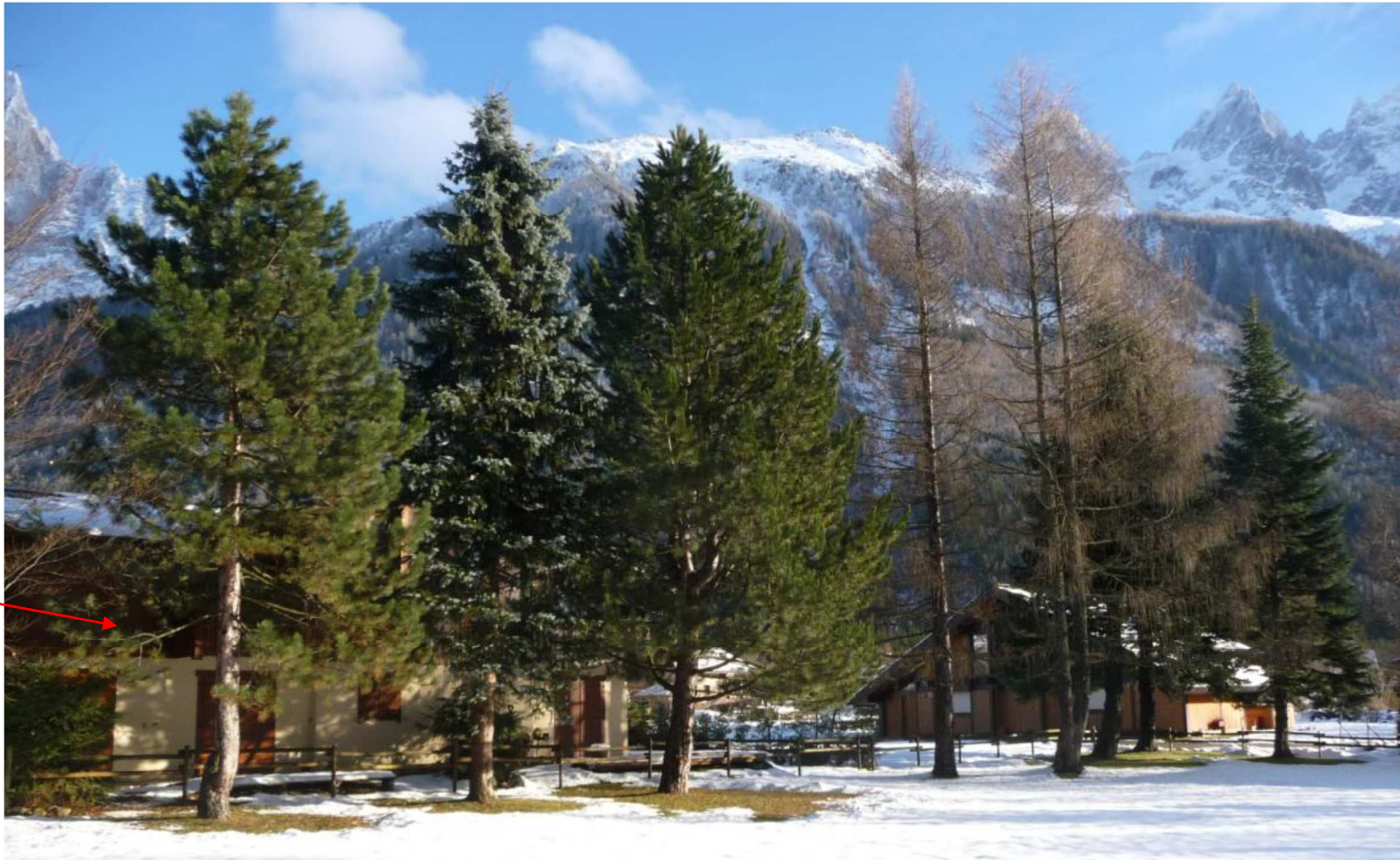
Chamonix Mont Blanc, 2008