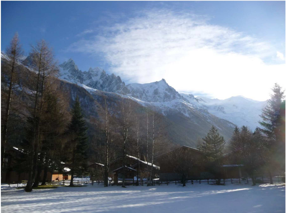
Photo d'une vue sur le Mont-Blanc, 2008.