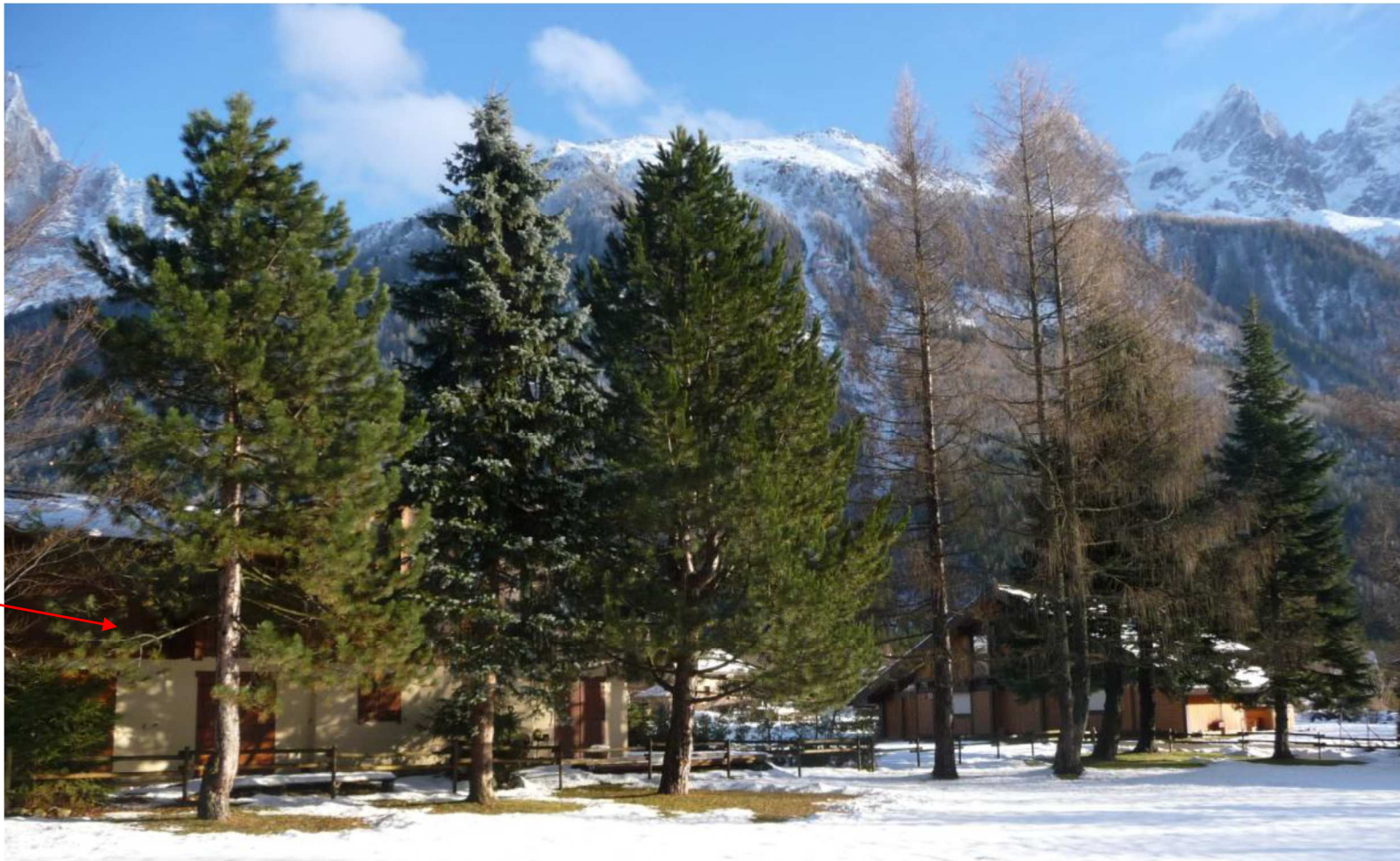
Chamonix Mont Blanc, 2008