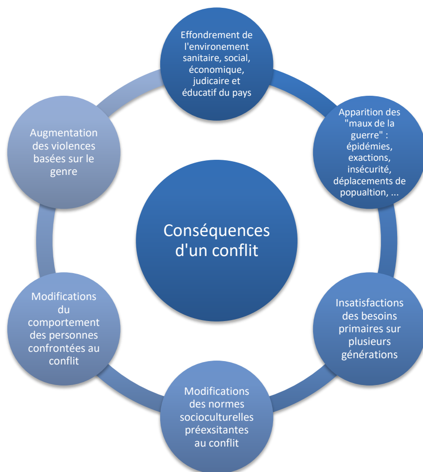
Figure 3 : Conséquences d'un conflit

Par exemple, sur le plan sanitaire, l'effondrement des infrastructures de soins provoque une diminution de l'offre de soin et de son accessibilité. Les centres de soin ne sont plus disponibles et accessibles, les fournitures, le matériel manque ainsi que les professionnels de santé. La population n'a plus accès aux soins de base avec toutes les conséquences sanitaires que cela peut entraîner.