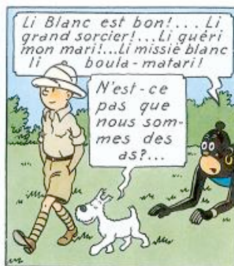
Illustrations 1, 2, 3 : Tintin au Congo paru en 1931 (en noir et blanc) puis en couleurs en 1946.