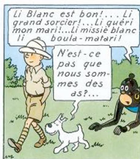
Illustrations 1, 2, 3 : Tintin au Congo paru en 1931 (en noir et blanc) puis en couleurs en 1946.