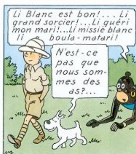
Illustrations 1, 2, 3 : Tintin au Congo paru en 1931 (en noir et blanc) puis en couleurs en 1946.