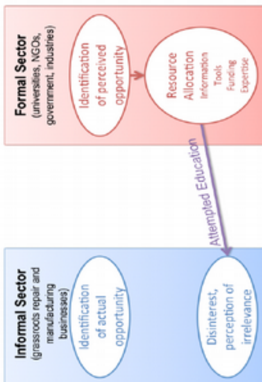
Figure 6. Diagram depicting information flows in two types of cross-sector collaborations. Our research indicates that the informal sector is well aware of business opportunities but may not recognize their full potential.