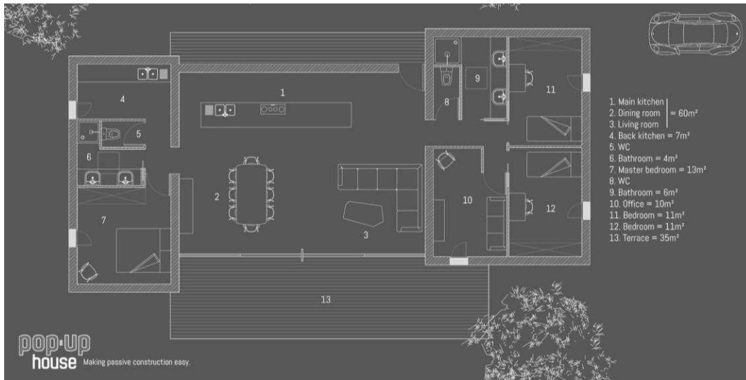
Plan intérieur en coupe verticale de la Pop-up House.

L'interpénétration de l'extérieur et de l'intérieur traduit grâce aux matériaux cette volonté de symbiose avec l'environnement et une grande sensation de liberté de mouvement. La végétation paraît arriver jusque dans votre salon tandis que le vent agitant la cime des arbres est arrêté par une barrière de verre protectrice. On pourrait y projeter mille histoires de vies. Beauté et le confort sont réunis dans un espace splendide et où l'intimité est garantie par les parois intérieures modulables ainsi que par la rangée d'arbres entourant la construction. Très lumineuses, disposant de grands espaces intérieurs, les photographies des projets de maisons alternatives telles qu'elles sont présentées dans des articles tels que celui de Guizmo.com , Journal du Design , Blog Esprit Design , ou Soon Soon Soon , nous présentent de véritables équilibres entre œuvres d'art et structures d'habitation, qui appellent le spectateur à la contemplation.