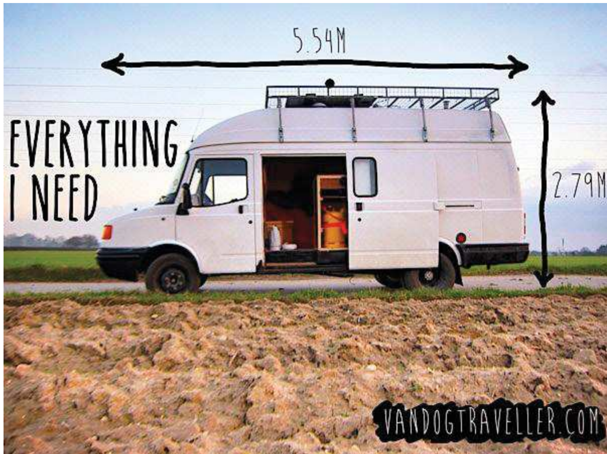
Image présente sur le site de Vandog Traveller : http://vandogtraveller.com/diy-camper-van-conversion/

Les structures d'habitation jouent alors dans ces histoires un rôle fondamental et incarne un personnage à part entière en constituant un des éléments vitaux indispensable à la poursuite du récit. La profusion d'images à disposition nous donne à voir des dispositifs aux courbes originales, et qui sortent du champ conventionnel de l'habitation telle que nous la concevons habituellement. Les Van restaurés, héritiers de la culture hippie, s'équipent d'équipements de campings et "véhiculent" leur idéologie célèbre; yourte et autres installations révolutionnent notre conception de l'habitat.